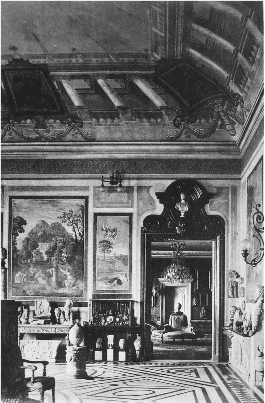
Palais Lanckoroński, Freskosaal mit Durchblick in den Italienischen Saal (Joanna Winiewicz-Wolska, Krakau)