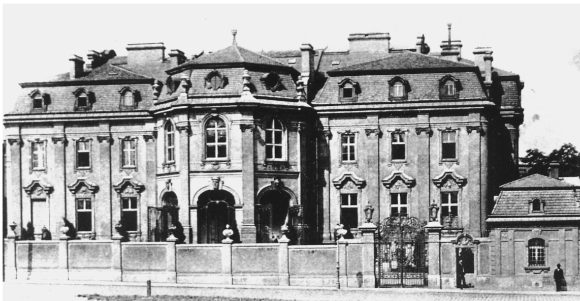
Das Palais Lanckoroński in der Jacquingasse 13 (Joanna Winiewicz-Wolska, Krakau)

fentlichkeit zumaß, ist aus der Tatsache zu ersehen, daß es 1903 in den Baedeker Eingang fand. 43 Genaueres erfährt man aus Zeitungsartikeln, die im Februar 1902 in der Wiener Tagespresse erschienen – also kurz vor Hofmannsthals »Ansprache«, die am 10. Mai 1902 am selben Ort stattfand. Anlaß waren die »Wiener Kunstwanderungen«, eine Wohltätigkeitsveranstaltung, bei der Wiener Palais und Künstlerateliers für die Öffentlichkeit geöffnet wurden. Den größten Andrang hatte das Palais des Grafen Lanckoroński, das am 16. Februar 800 Kunstinteressierte anzog. 44 Es sei das »Allerschönste, was Wien an Kunstschatzen in pri-