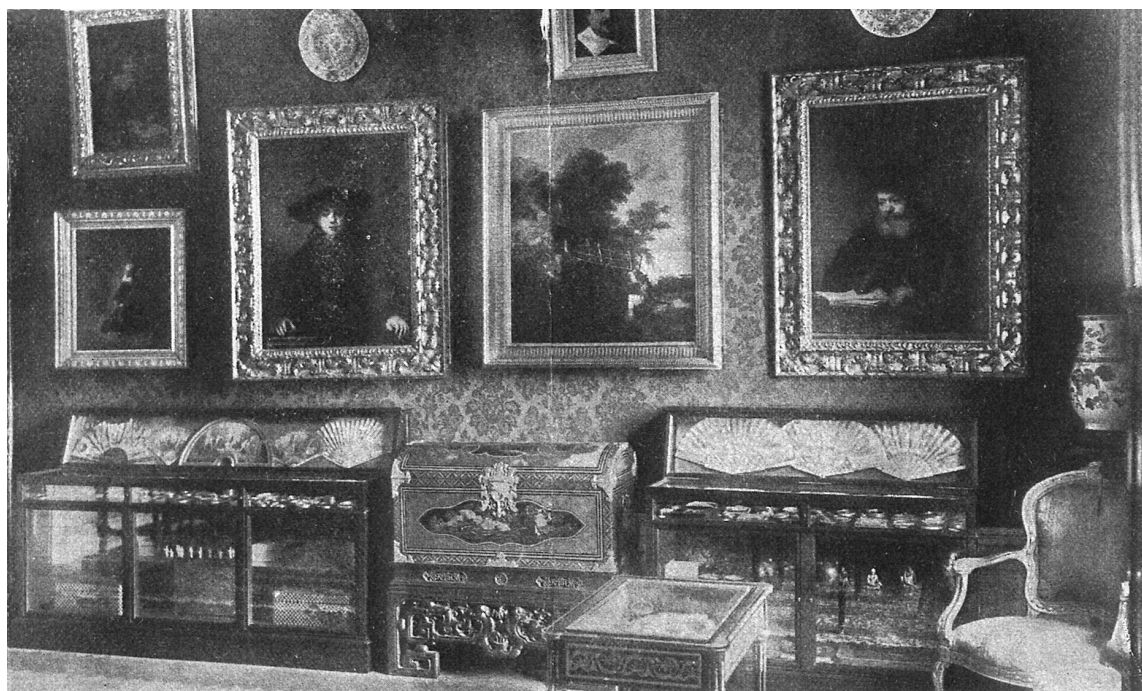
Palais Lanckoroński, Holländischer Saal mit zwei Gemälden Rembrandts und der Fächersammlung (Bezirksmuseum Landstraße, Wien)