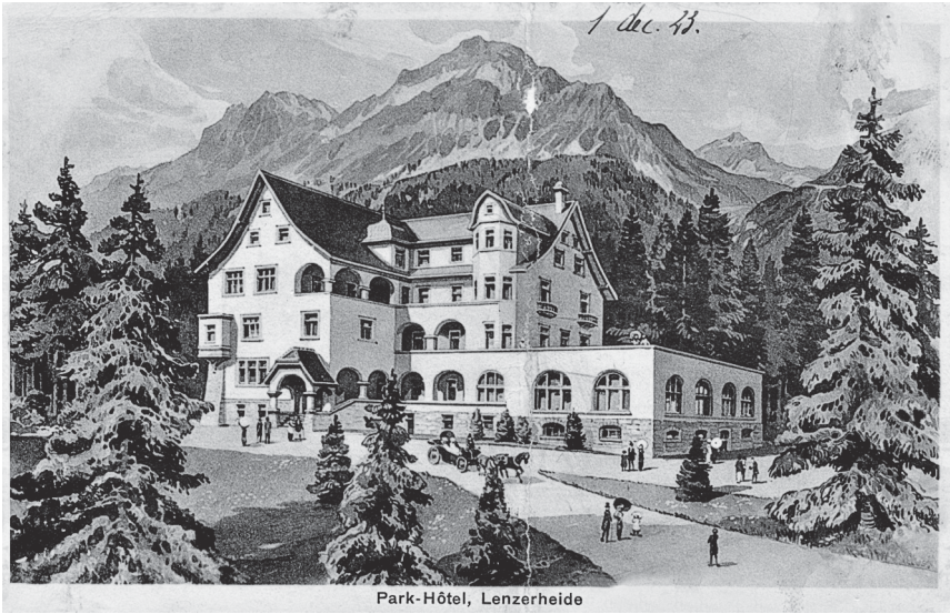
Das Park-Hotel in Lenzerheide, um 1923