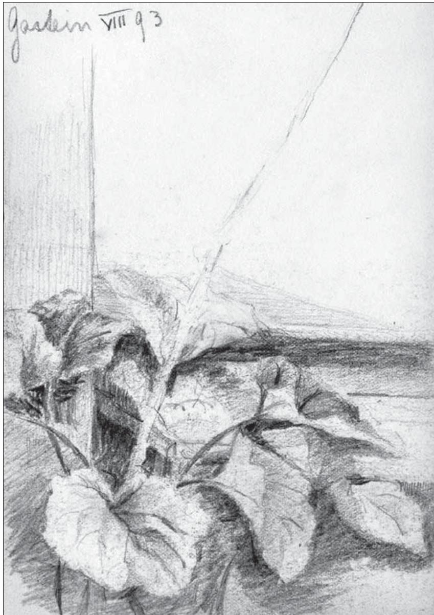
Abb. 10: Aus Elsa Cantacuzènes Skizzenbuch, 1888 (BSB)