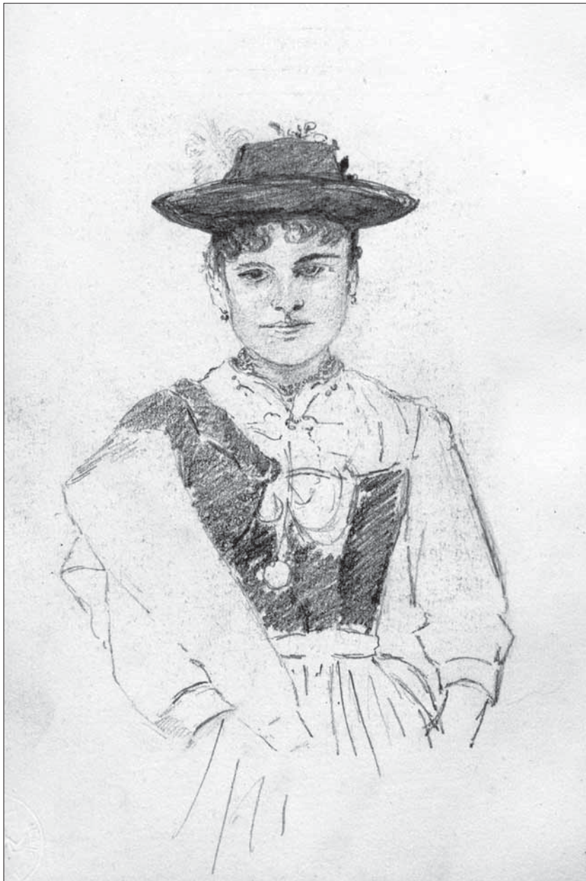
Abb. 4: Aus Elsa Canacuzènes Skizzenbuch, 1888 (BSB)