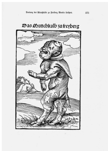
Abb. 2: Mönchskalb zu Freiberg.

gestalt erscheinen, Item auff erden gewliche wunder geborn werden beyde an menschen und thieren“ (WA 23, 10).