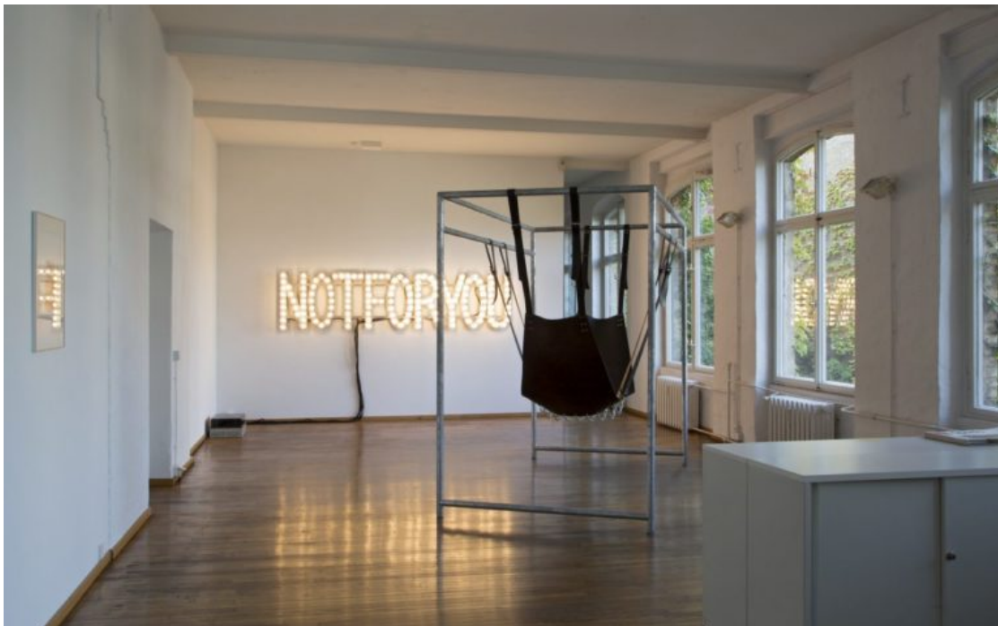
Monica Bonvicini, NOT FOR YOU, 2006, Installation 2016/17, fotostudioschuurman, Sammlung Hoffman, Berlin.

Dieser Print bildet die Grundlage und gleichzeitig den Rahmen für eine weitere rechteckige Collage in der Mitte der Leinwand: Diese kleinere Komposition besteht aus unzähligen kleinen Quadraten, die aus einer vorherigen Zusammenstellung entstanden sind und auf die mit größeren fotografierten Körperteilen gefüllte Leinwand aufgebracht ist: Es handelt sich also um eine Collage auf einer Collage und der Betrachter muss länger hinschauen, um zu erkennen, dass die Schichtung der fotografierten Körperteile unterschiedlichster Herkunft, Geschlecht und Hautfarbe, noch kleinteiliger wird. Es wirkt als sei alles miteinander verwoben – Fragen nach Diversität, Gender und Raum stellen sich.