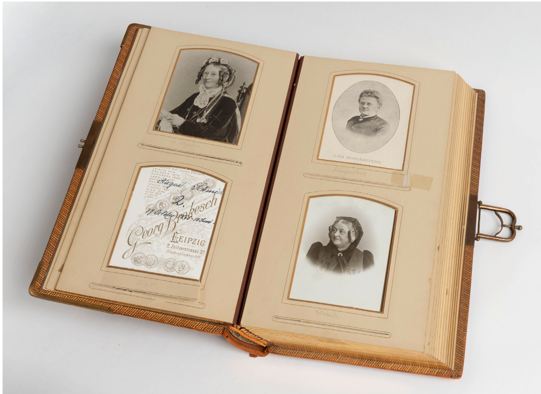
Fotoalbum aus dem Archiv der deutschen Frauenbewegung in Kassel

schen Frauenbewegung kaum im Fokus. Das hat auch mit dem Überlieferungsbruch durch den Nationalsozialismus in Deutschland zu tun. Viele Frauenrechtlerinnen und Politikerinnen wurden durch das nationalsozialistische Regime verfolgt, ins Exil gezwungen, deportiert und ermordet. Die privat angelegten Archive und Verbandssammlungen wurden teilweise zerstört und sind heute verloren. Dies stellt auch einen Erinnerungsbruch dar, der Einfluss hat auf die heutige Erinnerungskultur. Anders sieht es etwa in den Archiven und Museen in Amsterdam und London aus, die vom Ausstellungsteam besucht wurden. Hier konnten Exponate mit internationaler, nationaler und regionaler Bedeutung recherchiert und entliehen werden, die aufzeigten, dass die deutsche Frauenbewegung eng mit den internationalen Diskursen über Kongresse, persönliche Kontakte und Netzwerke verbunden war. Im Museum of London ist z.B. eine reiche Objektdokumentation der radikalen Frauenstimmrechtsbewegung um 1900 vorhanden und in der Women's Library @ LSE finden sich historische Dokumente, aber auch dreidimensionale Objekte wie Fahnen der gemäßigten, reformorientierten Frauenbewegung Großbritanniens. Im Institute on Gender Equality and Women's History (ATRIA) in Amsterdam ist heute das aus der ersten niederländischen Frauenbewegung heraus initiierte Archiv aufbewahrt, welches durch vielfältige Objekte auch die engen Kontakte der deutschen Frauenstimm-