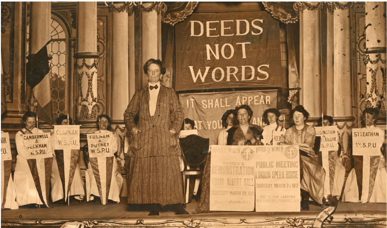
Unter dem Motto „Deeds Not Words“ riefen englische Suffragetten zu zivilem Ungehorsam auf.

zuschätzen gewusst. Sie beharrte darauf: „Nicht das Schreien, sondern das Leisten tut's.“ 50 Sie bezeichnete es als „Taktik“, zunächst „einzudringen in die Arbeit der Gemeinden, die Schulverwaltungen, die Universitäten, die verschiedenen Berufszweige, (um durch) Leistungen [...] hinreichende Garantie für die Gewährung weiterer Rechte“ zu erlangen. 51