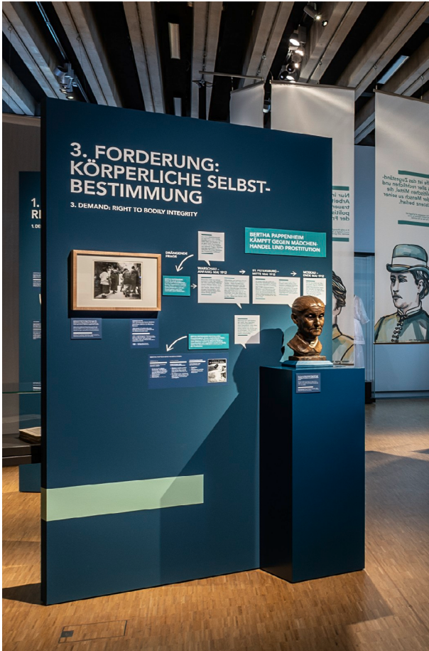
Ausstellungswand zur feministischen Forderung nach körperlicher Selbstbestimmung

Zuge der Industrialisierung, der darauf reagierenden Reform- und sozialpolitischen Bewegungen und Politik um 1900 veränderten sich auch der Alltag und die Selbstwahrnehmung von Frauen.