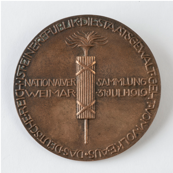
Medaille zur Verabschiedung der Weimarer Verfassung

Augspurg und Lida Gustava Heymann. Viele prominente Aktivist*innen der historischen Frauenbewegung wurden verfolgt und ermordet. Einige Objekte zum Schluss der Ausstellung zeigten, was übrig blieb, z.B. das Manuskript „Erlebtes – Erschautes“ von Anita Augspurg und Lida Gustava Heymann, Geschirrfreste aus der Ruine des Hauses von Gertrud Bäumer in Schlesien oder Regeln zum Besuch des Polizeigefängnisses, die im Zusammenhang mit Johanna Teschs Verhaftung stehen. Johanna Tesch überlebte die Inhaftierung im KZ Ravensbrück nicht. Sie starb am 13. März 1945. Gertrud Bäumer, die nicht eindeutig genug Stellung gegen den Nationalsozialismus bezogen hatte, beteiligte sich am Aufbau der Bundesrepublik Deutschland und starb 1954 in Bielefeld. Andere, wie Tony Sender (gest. 1964 in New York) oder Helene Stöcker (gest. 1943 in New York) hatten als Verfolgte keine andere Möglichkeit als das Land zu verlassen. Was sie zurückließen, wurde zerstört oder ging verloren. Um diese verschiedenen biografischen Handlungsspielräume und ihre Spuren sichtbar zu machen, fanden diese letzten Fragmente einen Platz in besonderen Einzelvitrinen.