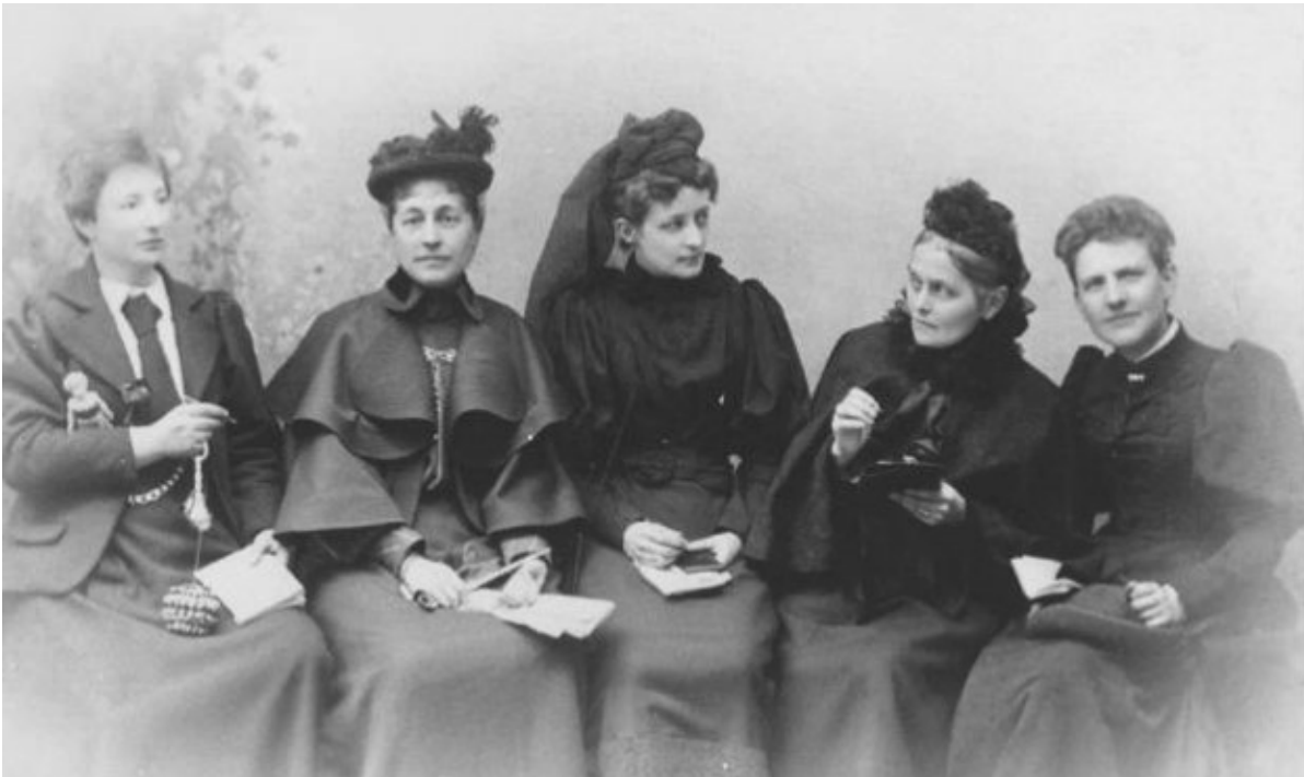
Anita Augspurg, Marie Stritt, Lily von Gizycki, Minna Cauer, Sophia Goudstikker (v. l. n. r.)

Massenbewegung, die zeitweise alle Richtungen einschloss, wurde die deutsche Frauenbewegung erst am Ende des 19. Jahrhunderts, als sie Proteststürme, Massenpetitionen und überall im Land riesige Versammlungen gegen die Verabschiedung eines neuen, für ganz Deutschland geltenden Bürgerlichen Gesetzbuches (in Kraft seit 1900) veranstaltete. Doch trotz dieser neuen Öffentlichkeit, trotz neuer Netzwerke und Vereine zur Rechtshilfe für Frauen und neuer Expertise in Rechtsfragen – es half nichts. Die damalige Vorsitzende des BDF Marie Stritt musste feststellen: „das Familienrecht und die wichtigsten Lebensfragen der größeren Volkshälfte (wurden im Parlament) ganz oberflächlich erledigt, unter üblicher Betonung [...] der ‚gottgewollten Ordnung‘, des ‚Schutzes des schwachen Geschlechts‘, aber auch meist unter einer das gewohnte Maß übersteigernden ‚Heiterkeit‘ [...]“ 47 .