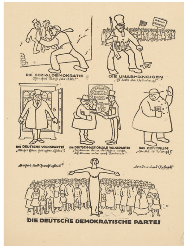
Flugblatt der DDP zur Nationalversammlung 1919