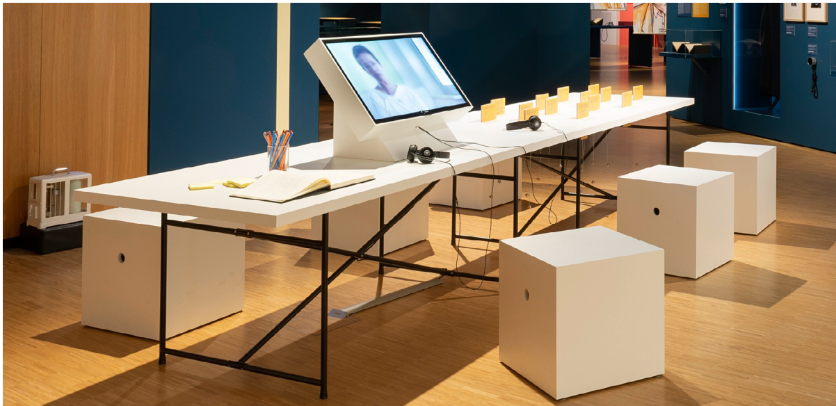
Das ‚Politiklabor‘ animierte zur aktiven Partizipation.

Andere gingen in die ‚innere Emigration‘ oder passten sich an. Nach 1945 stand die Gleichberechtigung als Grundrecht im Zentrum der Forderungen.