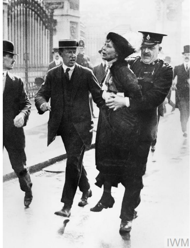
Verhaftung von Emmeline Pankhurst

Recht und Gewalt für ihre Rechte kämpften, bis heute gestritten. 21