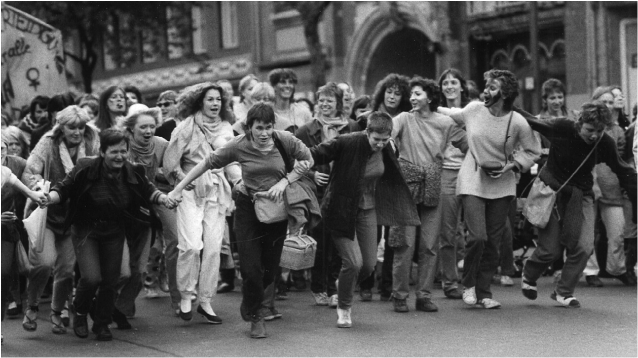
Walpurgisnacht-Demonstration 1983 in Westberlin

Subkultur mit einer beachtlichen Infrastruktur. Der Schwerpunkt lag – so der bisherige Forschungsstand – auf Geselligkeit und war für diejenigen, die die Subkultur erreichte und diese nutzen konnten, eine gelungene Antwort auf gesellschaftliche Isolation.