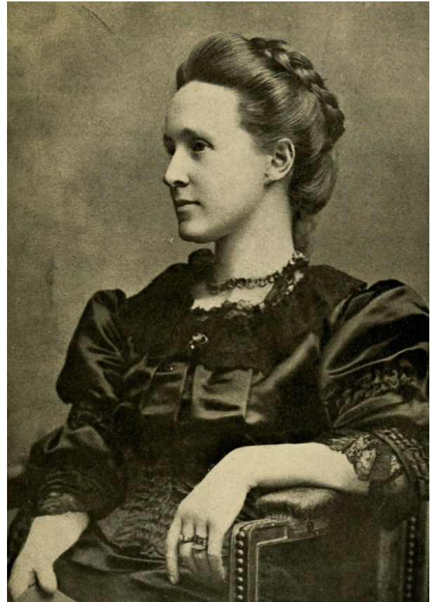
Millicent Garrett Fawcett

unzuverlässig, da die politische Unterstellung, Frauen wählten eher konservativ, Allianzen zwischen Sozialisten und Feministinnen erschwerte. Das führte gerade in England zu der paradoxen Situation, dass zeitweise die Konservativen – soweit es um ihre Verstärkung durch die Besitzbürgerinnen ging – als Verbündete der Stimmrechtsbewegung gewonnen wurden.