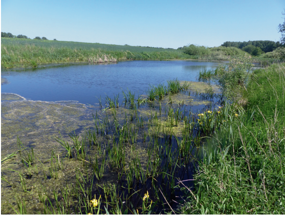
Loc. 11; Feldsoll II Mahl- zow, 20.V.2018.