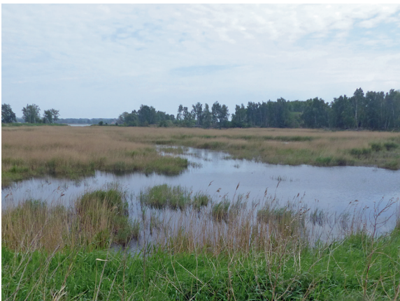
Loc. 27; Lagune Liepe, 15.V. 2018.