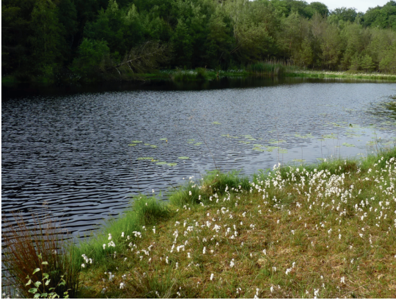
Loc. 21; Mümmelkensee, 2.VI.2016.