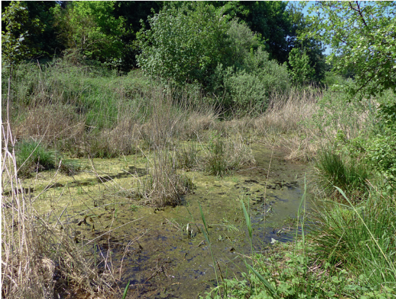
Loc. 26; Feldsoll Benz, 19.V. 2018.