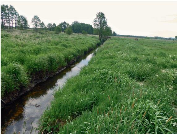
Loc. 43; Graben Großes Moor, 16.V.2018.