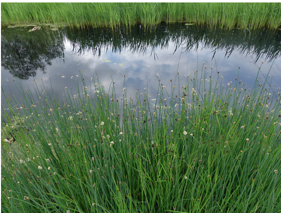
Loc. 12; Graben III, nördl. Karls-hagen, 18.V.2018.