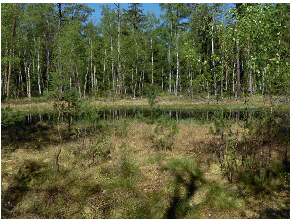
Loc. 35; Moorkolk Jung- fernmoor, 7.V.2018.