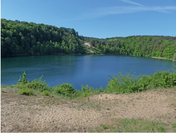
Loc. 41; Türkissee, 21.V.2018.