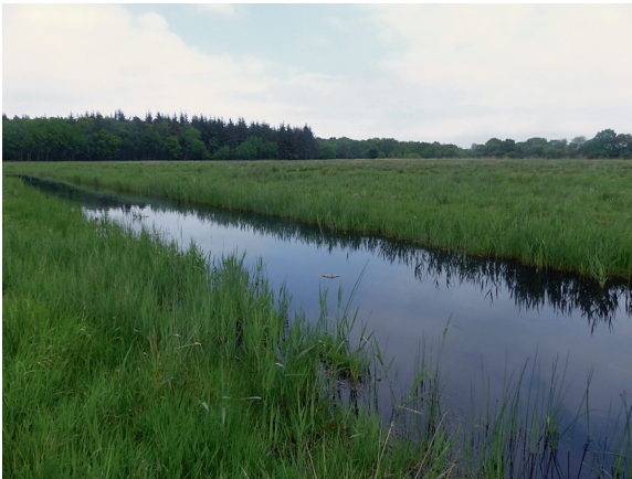
Loc. 12; Graben III, Karls- hagen, 18.V.2018.