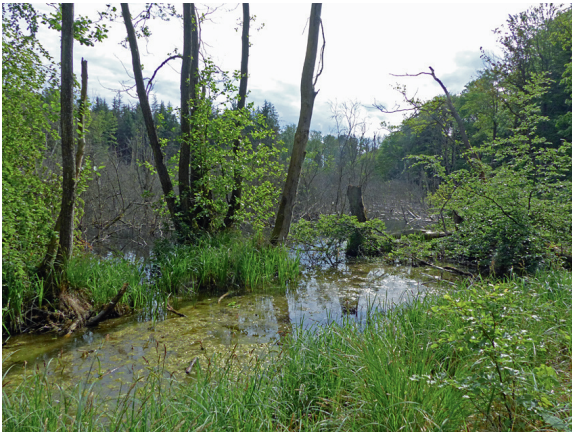
Loc. 34; Bruchgewässer Wolgastsee, 22.V.2018.