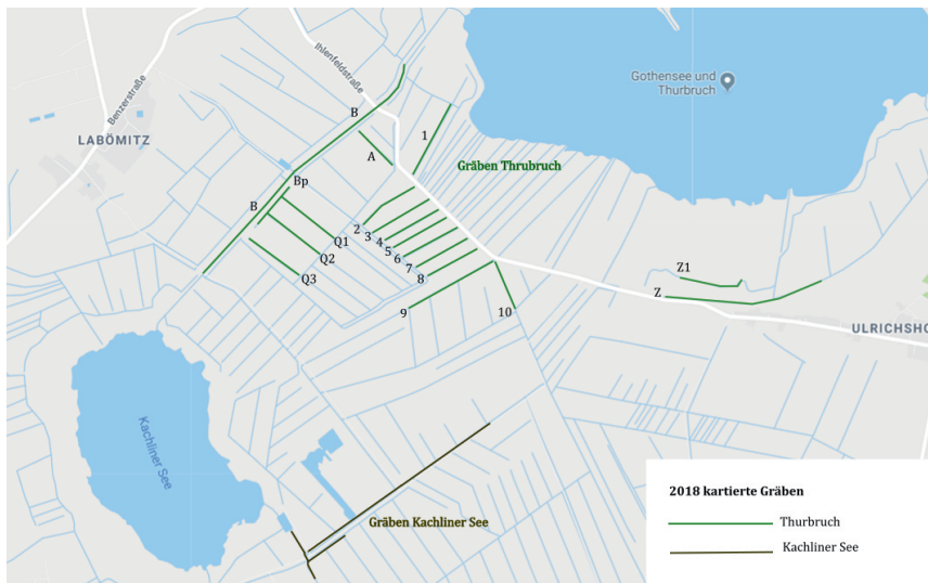
Abb. 1. Kartierte Gräben im Thurbruch und am Kachliner See.

Gräben sind künstliche linienförmige Gewässer, deren Libellenfauna vom Grad der Besonnung, der Vegetation und der Wasserqualität abhängig ist. Auf Usedom sind ausgedehnte Entwässerungssystemen über die ganze Insel verteilt und hier der häufigste