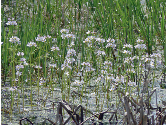
Loc. 5; Feldsoll, Östlich Lentschow, Wasserfeder ( Hottonia palustris ), 15.V.2018.