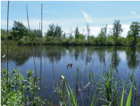
Loc. 8; Torfstich, Peenewiesen bei Güstrow, 23.V.2018.