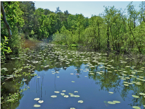
Loc. 46; Zaterek See, 21.V. 2018.