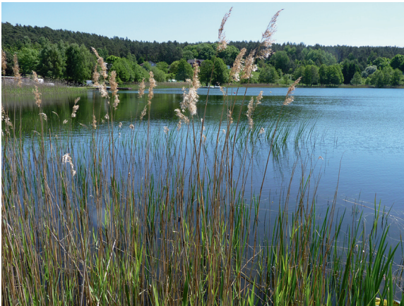
Loc. 45; Wiselka See, 21.V. 2018.