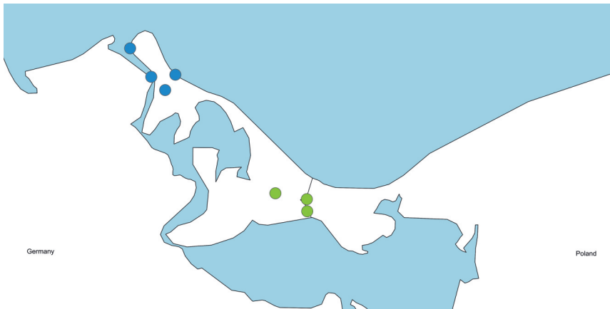
Abb. 2. Vorkommen von Sympecma fusca (blaue Punkte) und S. paedisca (grüne Punkte) im Untersuchungsgebiet.

Regelmäßig geräumte Niedermoorgräben in extensiv bewirtschafteten Wiesen, wie im Thurbruch (Loc. 28) und nördlich von Karlshagen (Loc. 12), weisen dagegen sehr gute Habitatbedingungen für zahlreiche Libellenarten auf, insbesondere wenn die Uferstreifen nicht gemäht werden. Hervorzugeben sind an diesen Grabensystemen die stabilen Vorkommen der Winterlibellen Sympecma fusca und S. paedisca , die allerdings strikt voneinander getrennt liegen ( S. fusca im Norden, S. paedisca im Süden von Usedom). Die mittlere Artenzahl/Gewässer beträgt 5,96 (min.: 0; max.:12) (n=25).