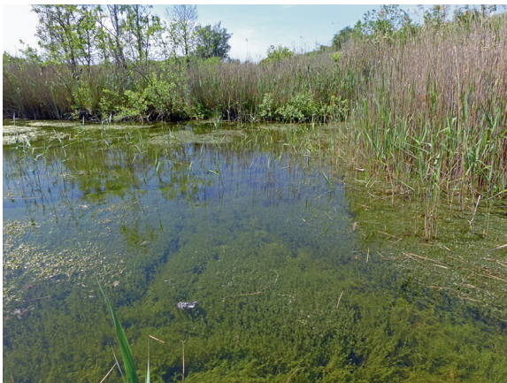
Loc. 8; Torfstich, Peenewiesen bei Güstrow, 23.V.2018.