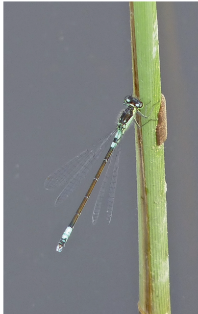
Abb. 3. Coenagrion armatum , Loc. 28, Mai 2016.