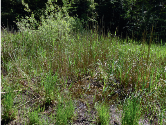
Loc. 42; Waldtümpel, 21.V. 2018.