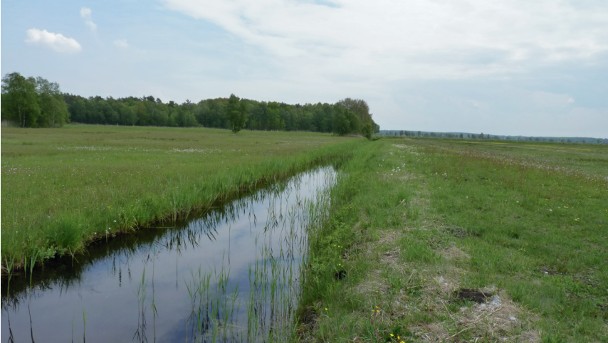
Abb. 4. Entwässerungsgraben (A) mit C. armatum -Nachweis im Thurbruch.

Die Verbreitung von Coenagrion armatum beschränkt sich in Deutschland auf Schleswig-Holstein (Winkler 2015). Diese Art besiedelt dort vor allem mesotrophe Moorgewässer, die Flachwasserzonen mit ausgeprägter Helophyten-Vegetation aufweisen. Da sich C. armatum vorzugsweise an und zwischen den Halmen aufhält, ist eine lockere Vegetationsstruktur von entscheidender Bedeutung für die Habitataignung (Bouwman & Ketelaar 2008, Winkler 2015; vgl. auch Abb. 4, die eine lockere Vegetationsstruktur aus austreibenden Schilfhalmern dokumentiert).