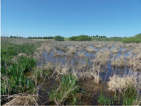
Loc. 32; Feldsoll 1, Zeche- rin, 7.V.2018.