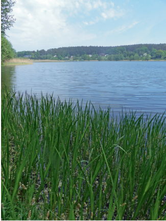
Loc. 45; Wiselka See, 16.V. 2018.