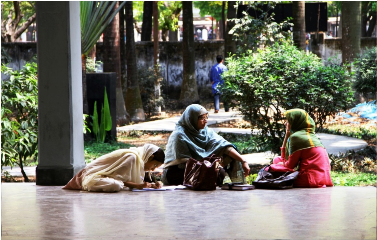
Abbildung 2: Studentinnen bereiten sich in der Mittagspause auf die bevorstehende Präsentation vor. Dhaka University, 2012

Die Arbeit teilt sich in einen theoretischen und einen methodischen Hintergrund sowie in einen empirischen Teil der Feldforschungsergebnisse. Unter dem methodischen Hintergrund wird die Grundlage der angewandten wissenschaftlichen Methodik erläutert. Im Zentrum stehen hierbei der Einsatz von Fotografie in der Sozialforschung, das Problemzentrierte Interview als Erhebungsverfahren und die Reflexive Fotografie als ein qualitativ-methodischer Zugang zu den persönlichen Lebenswelten der Studierenden im universitären Kontext.