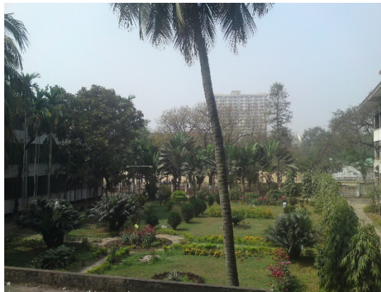
Abbildung 6: Ausblick aus dem Institut auf den fachbereichseigenen Garten, Dhaka, 2012