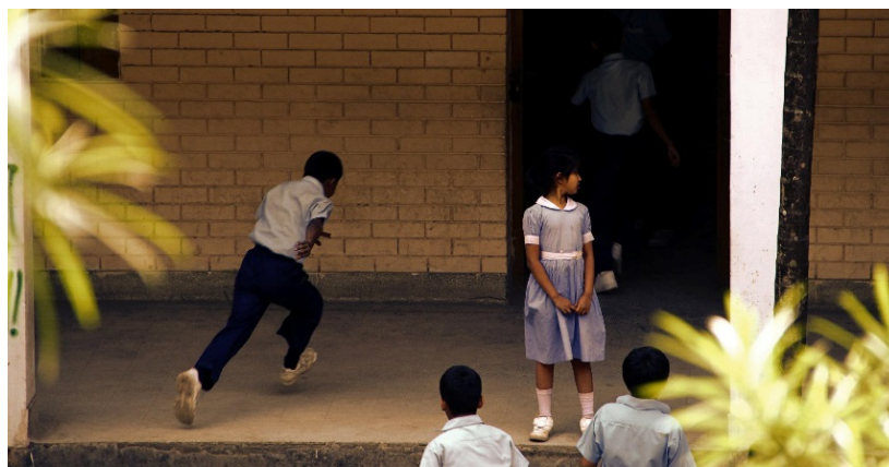
Abbildung 10: Grundschülerinnen und Grundschüler stürmen bei Pausenende in die Klassenzimmer, Dhaka, 2012

Zwar besuchen über 95 Prozent der Sechsjährigen die erste Klasse, doch lediglich 50 Prozent der 11- bis 15-jährigen Jungen und Mädchen besuchen auch weiterhin noch die Schule. Die Abbruchquote in der weiterführenden Schule (nach der Grundschule) beträgt 58,29 Prozent bei Jungen und 66,18 Prozent bei Mädchen (vgl. Maleque 2009, S. 126–127). Nur wenige Kinder und Jugendliche wachsen in privilegierten Verhältnissen auf und können eine umfassende Schulbildung genießen, die es ihnen künftig ermöglicht, eine angemessene Arbeit zu finden und so etwas zum Wohlstand des ganzen Landes beizutragen: