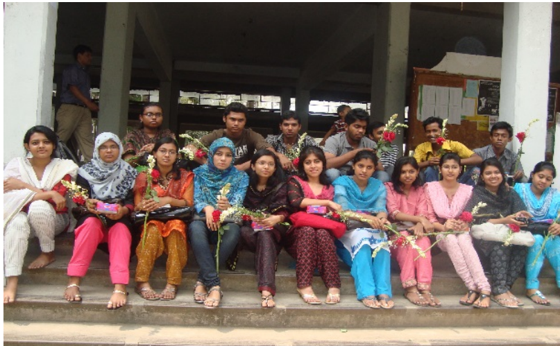
Abbildung 7: Studierende machen ein gemeinsames Foto von ihrem Jahrgang als Erinnerung, Dhaka, 2012

Die von den Probandinnen und Probanden angefertigten Fotos (vgl. Abbildungen 5 bis 7) vermitteln die Wahrnehmung der Studierenden der Dhaka Universität: Betrachtet man die Wahrnehmung der sechs Befragten hinsichtlich der Studienbedingungen, so lässt sich erkennen, dass die drei Studentinnen aus Bangladesch empfinden, zu den Privilegierten der Gesellschaft zu gehören, also zu denjenigen, die nicht den 87 Prozent der Bevölkerung angehören, die unter der Armutsgrenze und unter schlechten sozioökonomischen Bedingungen leben. Dementsprechend empfinden sie große Dankbarkeit, zu den Zukunftsträgerinnen Bangladeschs zu gehören und das auch noch an der größten und angesehensten Universität des