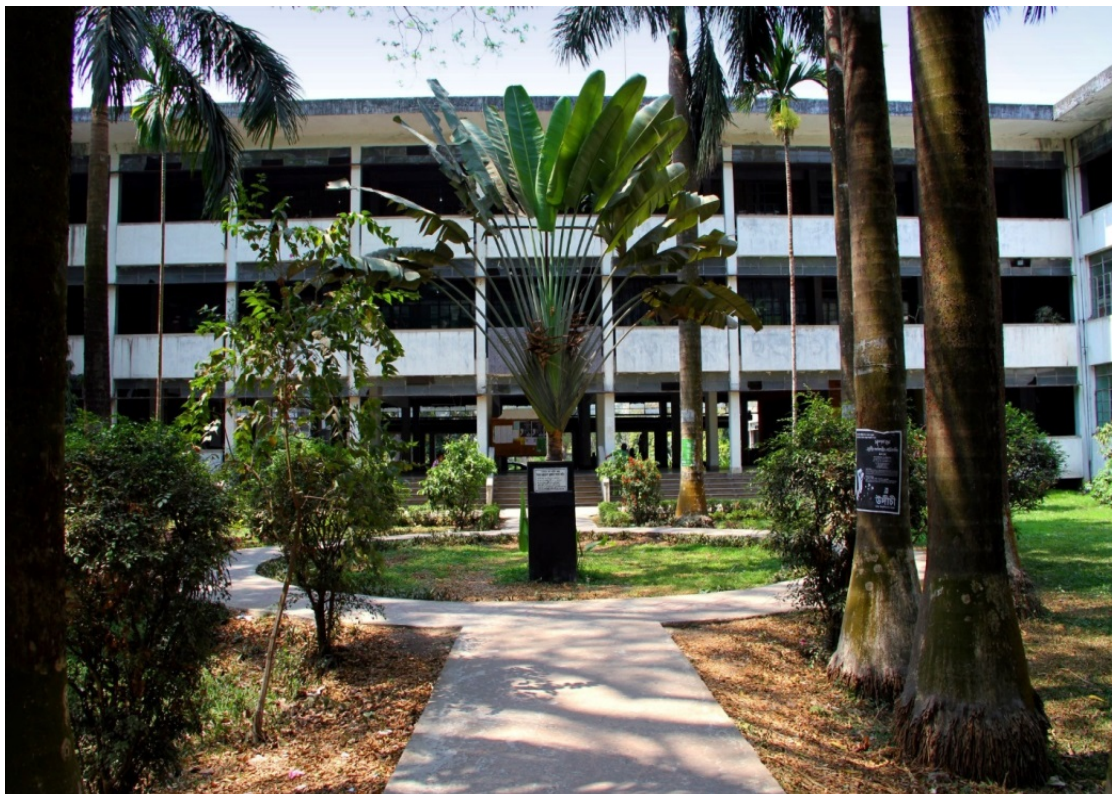
Abbildung 1: Repräsentativer Eingangsbereich zum Institute for Education & Research mit gepflegtem Vorgarten. Dhaka University, 2012

Der Anspruch, möglichst präzise und realitätsnahe Ergebnisse zu sichern, erforderte zum einen den persönlichen Aufenthalt zum Zweck der Forschungsarbeit an der Goethe-Universität in Frankfurt am Main sowie eine Forschungsreise an die University of Dhaka nach Bangladesch, um dort durch einen zweimonatigen Forschungsaufenthalt gleiche Ausgangsbedingungen für diese Untersuchung zu gewährleisten. Die Eindrücke dieser Forschungsreise wurden mittels Fotografien festgehalten (vgl. Abbildungen 1 und 2).