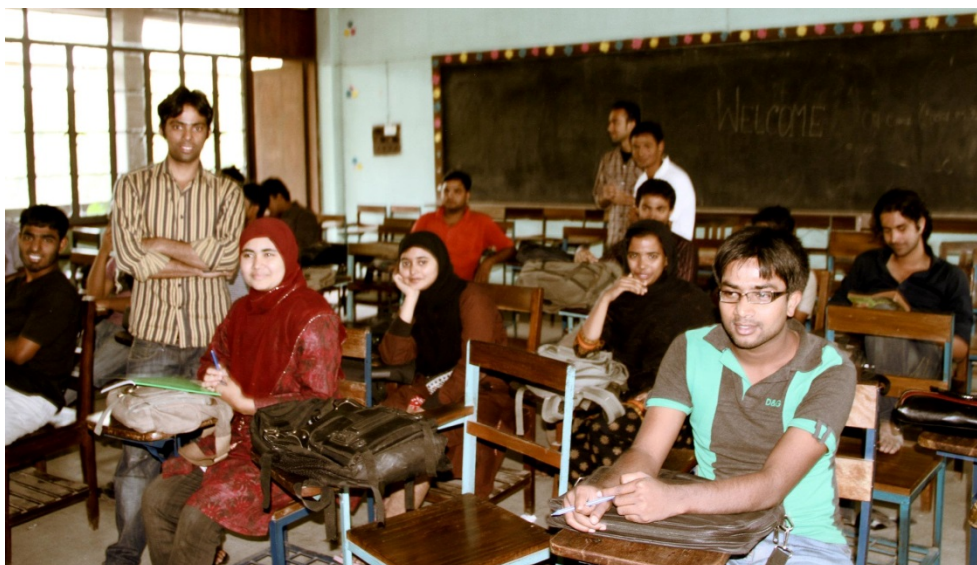
Abbildung 11: B.A.-Studierende am Fachbereich Education & Research im Seminarraum an der Dhaka University, 2012

Die Interviews mit den Probandinnen und Probanden zum Forschungsgegenstand hatten eine Aushandlung der subjektiven Sichtweisen der Interviewten zum Ziel. Die im Kurzfragebogen enthaltenen Informationen und Fragen dienten dazu, den Gesprächseinstieg zu erleichtern. Eine vorformulierte Einleitungsfrage diente als Mittel der Zentrierung des Gesprächs auf das zu untersuchende Problem. Die Herausforderung bestand darin, eine Frage so offen zu formulieren, dass sie für die Interviewten wie „eine leere Seite“ wirkte, die in eigenen Worten und mit eigenen Gestaltungsmitteln gefüllt werden will (vgl. Baumgart 2007, S. 212).