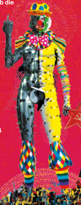
Illustration: Rocket & Wink

Weitere Vorstellungen: 14/3, 30/3, 31/3, 14/4