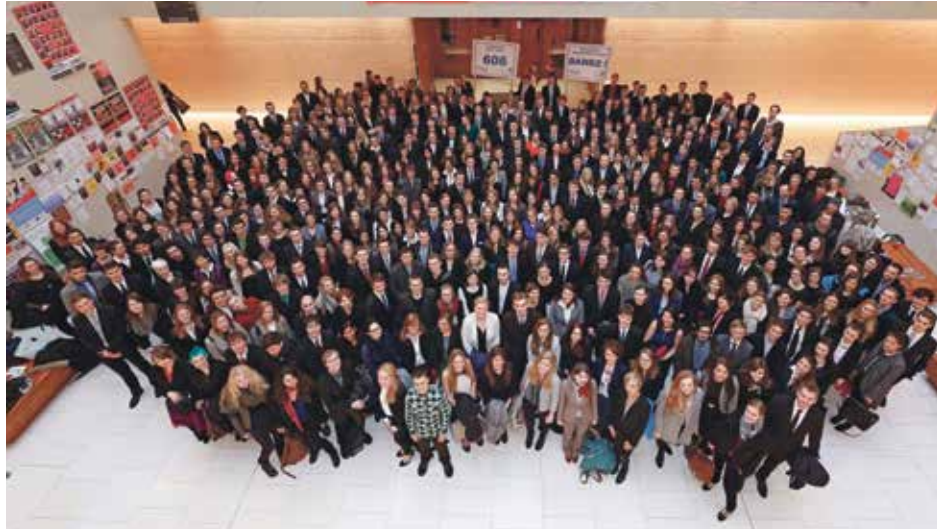
Vergabefeier der Deutschlandstipendien 2016.