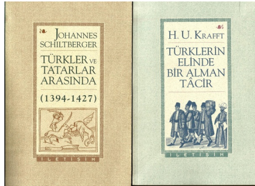
Schiltberger 1995 ve Krafft 1996