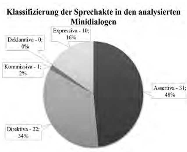
Abbildung 3: Klassifizierung der Sprechakte in den analysierten Minidialogen ( Deutsch.com 1 )

Abbildung 3 zeigt, dass abgesehen von den Deklarativa alle Sprechaktklassen vertreten sind, wobei Assertiva (z. B. die Sequenz im Minidialog in der fünften Lektion: B9 „Ich bin 16 und Lea ist 15 Jahre alt. Wir sind Schülerinnen.“, NEUNER 2008: 31) und Direktiva (z. B. B10 „Hast du am Wochenende Zeit?“, NEUNER 2008: 43) mehr als vier Fünftel der Fälle darstellen. Ein quantitativer Vergleich mit Deutsch.com 3 wurde bei der Analyse der Gesprächssequenzen nicht durchgeführt, weil diese in Deutsch.com 3 kaum vertreten sind (s. oben).