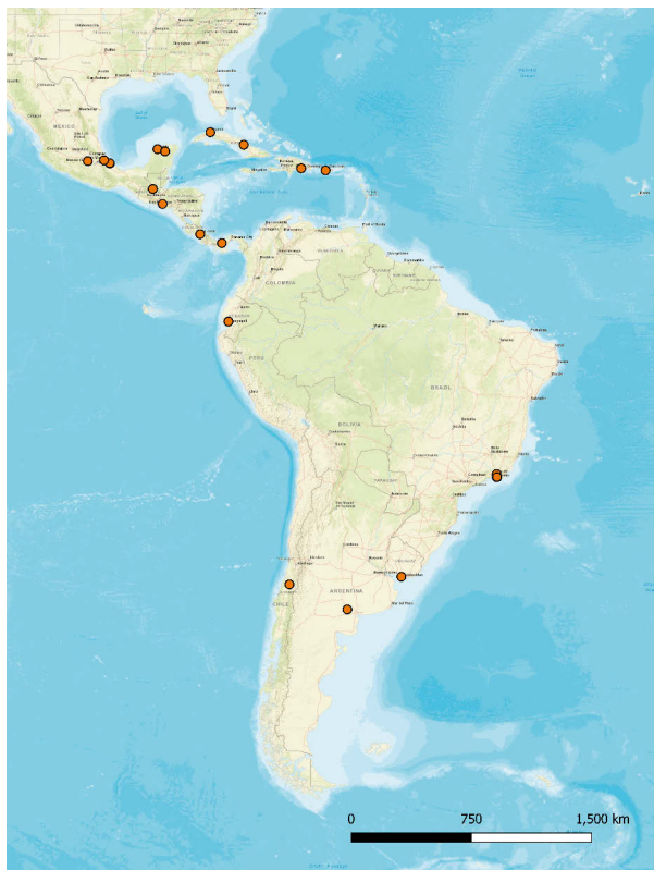
Abbildung 3: Reisewege Gabriela Mistral

Als 1889 im entlegenen chilenischen Valle de Elqui Lucila Godoy Alcayaga auf die Welt kam, ahnte niemand, dass sie als Gabriela Mistral zu einer der wichtigs-