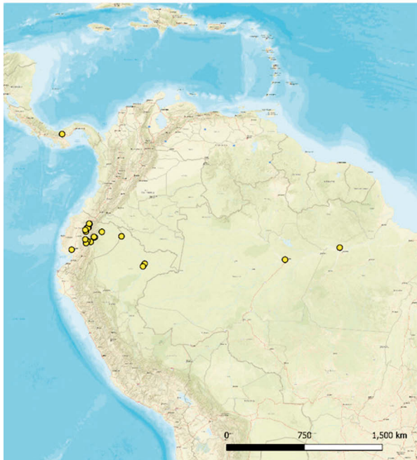
Abbildung 9: Reisewege Henri Michaux

Während Mistral und Andrade zu ihren Reisen aufbrachen, schiffte sich auf der anderen Seite des Atlantiks ein junger belgischer Künstler auf einem Dampfer Richtung Lateinamerika ein. Als er im Jahr 1927 in See stach, hatte der 28-jährige Michaux bereits ein abgebrochenes Medizinstudium sowie eine kurze Karriere als Matrose und einen längeren Aufenthalt in Paris hinter sich. 1 Im Umfeld