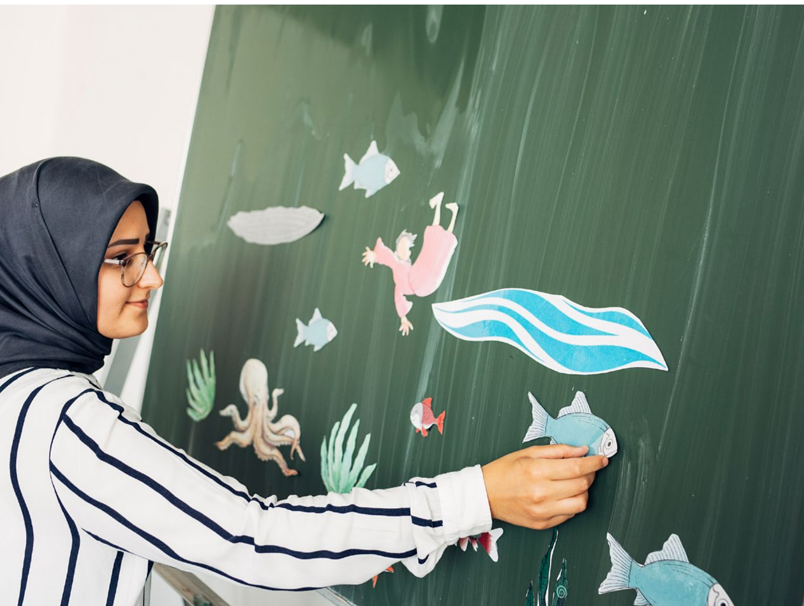
Die Geschichte von Jona: Alle drei großen monotheistischen Weltreligionen kennen den Propheten, der von einem Wal verschluckt wurde.