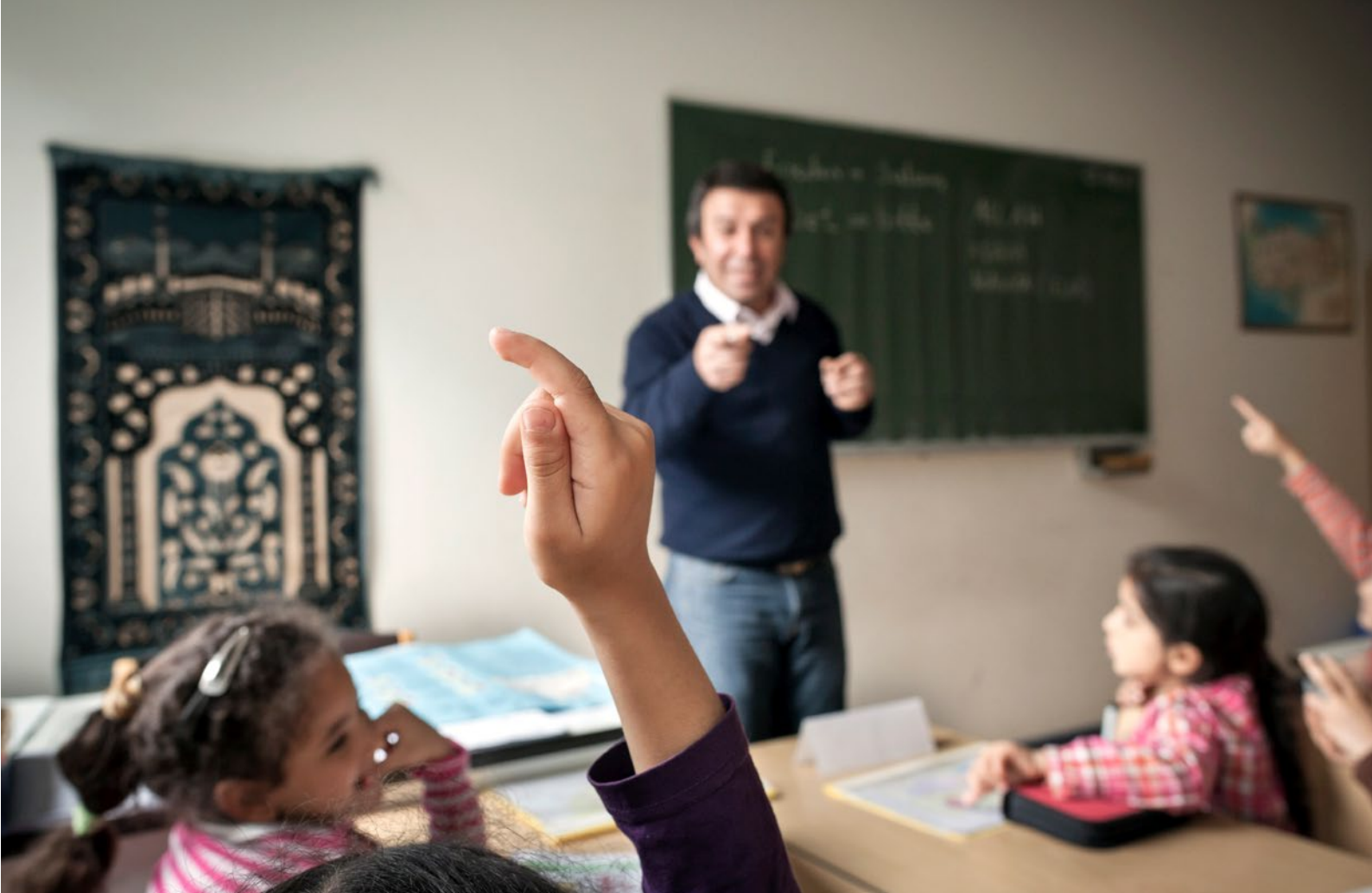
Schüler_innen einer Berliner Grundschule während des islamischen Religionsunterrichts.

Überzeugungen“. 9 Die Autor_innen empfehlen daher, dass in der Lehrer_innenausbildung nicht nur Wissen vermittelt wird, sondern insbesondere die Möglichkeit der kritischen Auseinandersetzung mit der Religion gegeben sein muss. 10 Eine systematische, deutschlandweite Untersuchung steht noch aus.