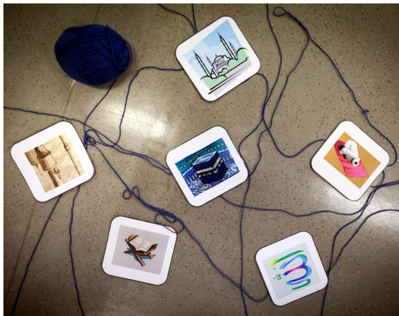
Worum geht es im Islam? Der islamische Religionsunterricht vermittelt Grundlagenwissen zur muslimischen Religion.

Niedersachsen führte ab dem Schuljahr 2003/2004 an öffentlichen Grundschulen im Rahmen eines Schulversuchs bekenntnisorientierten islamischen Religionsunterricht ein. 60 Da sich die niedersächsischen Muslim_innen nicht zu einer Religionsgemeinschaft gemäß Art. 7 Abs. 3 GG zusammengeschlossen haben, wurden Vertreter_innen aus Gemeinden und Vereinen zu einem Runden Tisch eingeladen, die als Ansprechpartner_innen für die Zeit des Schulversuchs agieren sollten. 61 Im Jahre 2007 wurde beschlossen, den Schulversuch auszuweiten. Von Anfang an war klar, dass der Runde Tisch verfassungsrechtlich keine Religionsgemeinschaft darstellt. Dies war aber vom Land Niedersachsen beabsichtigt. Auf den Schulversuch als Übergangslösung hatten sich alle Beteiligten geeinigt. 62 Im Jahr 2011 haben der DITIB-Landesverband Niedersachsen und Bremen e. V. und die Schura Niedersachsen einen gemeinsamen Beirat gebildet. Mit der Gründung wurde der Beirat von beiden Partnern personell besetzt und eine Iğāza -Ordnung verabschiedet. 63