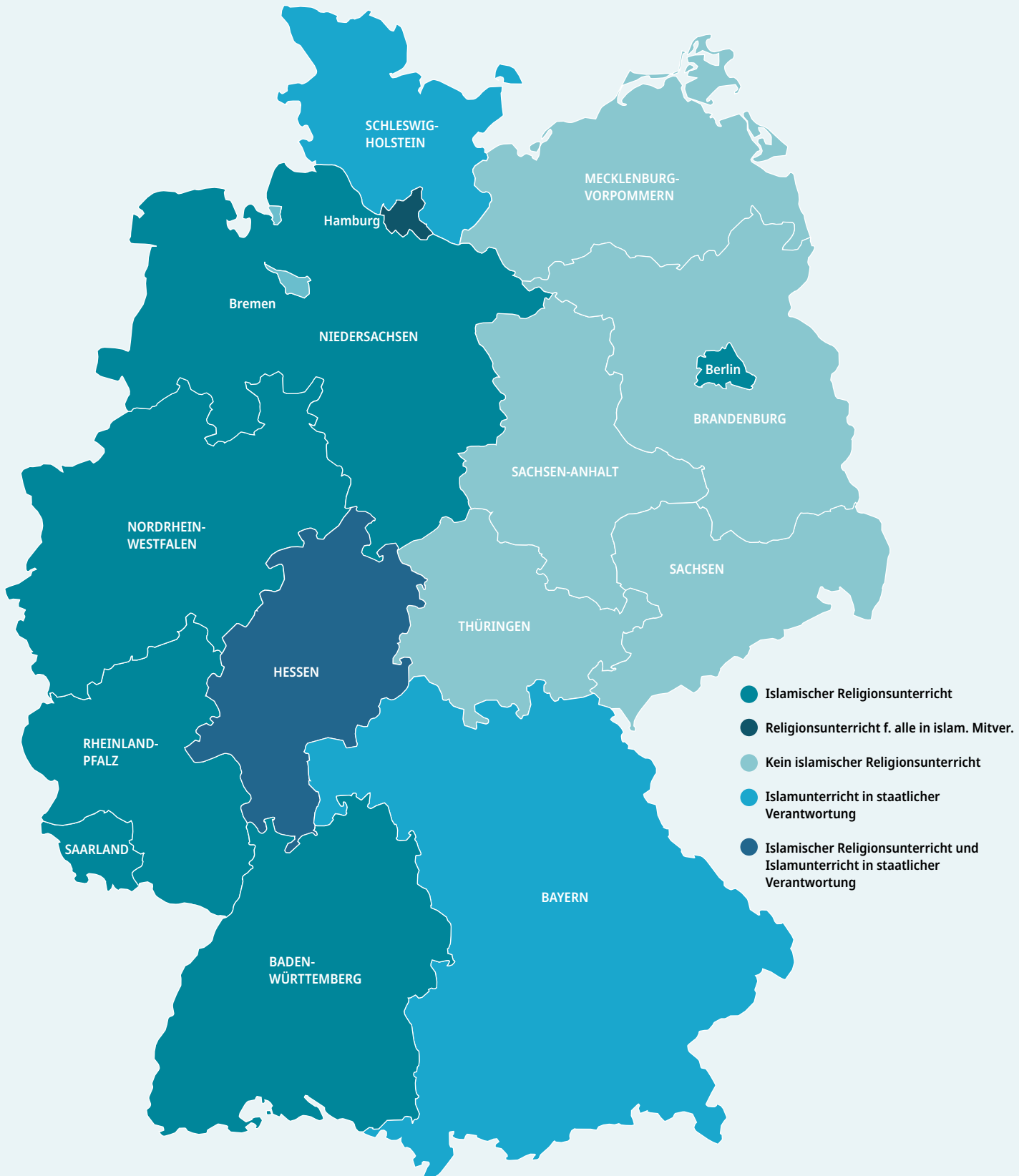
Die Karte gibt einen Überblick über den gegenwärtigen Stand in den 16 Bundesländern.