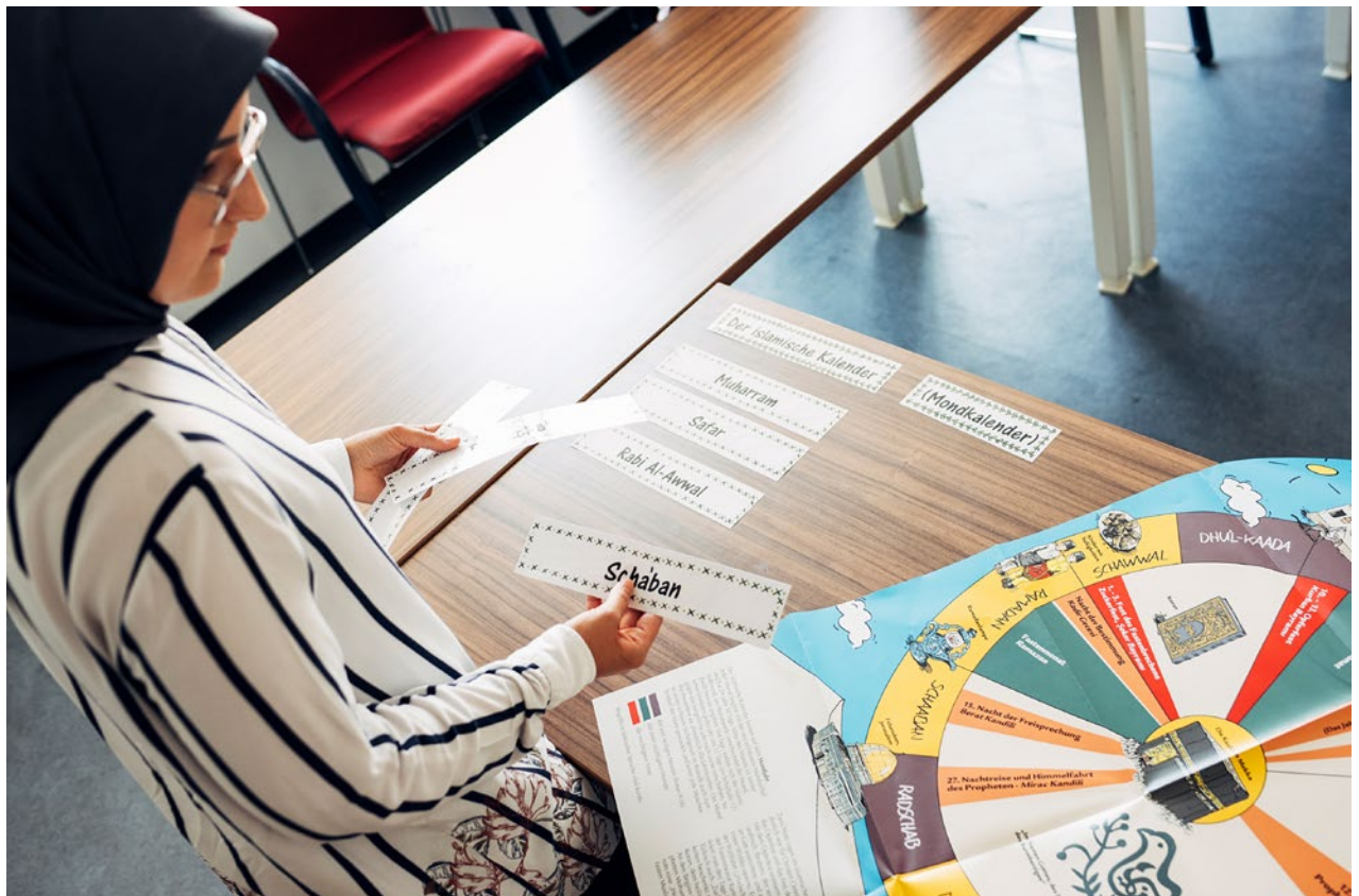
Unterrichtsvorbereitung: Der islamische Kalender mit Festen verteilt über das ganze Jahr.