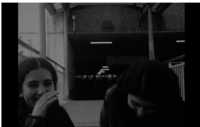
Abb. 13–15. Film-Stills, This Makes Me Want to Predict the Past .