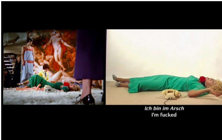
Abb. 6. Film-Still, Lerne deutsch mit Petra von Kant .

Im Unterschied zu den vorherigen Einstellungen imitiert Wongs Version das Original hier nicht in identischen Einstellungen. Anstatt von hinten ist Petra/Wong von vorn zu sehen, der Fokus bleibt auf ihrem/seinem Ausdruck. Petra lehrt Wong Lektionen in Negativität, bis zum Todeswunsch. Das Video endet damit, dass Petra/Wong auf dem Boden liegen, zum Teil auf dem Rücken wie ein Käfer mit Beinen und Armen in der Luft strampelnd (s. Abb. 6 und Abb. 7). Sie lallen: