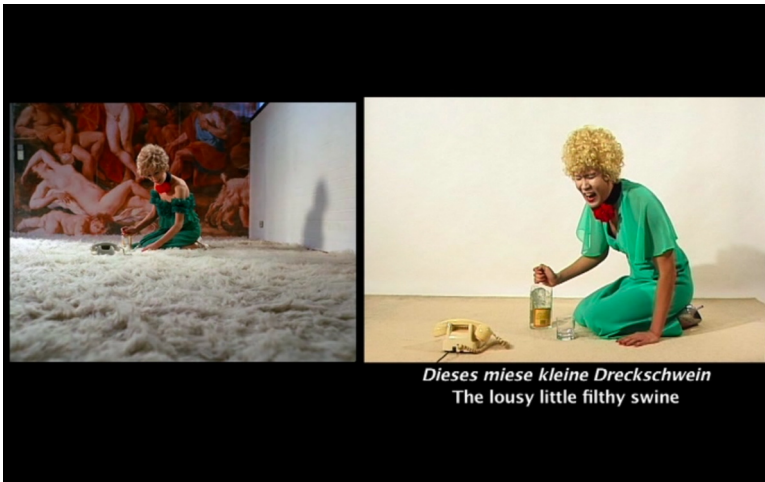
Abb. 3. Film-Still, Lerne deutsch mit Petra von Kant .

Fassbinders Original gegen Ende des Films zu sehen sind. Darin ist Petra zunächst allein in ihrem leergeräumten Studio/Schlafzimmer. Sie wartet verzweifelt auf einen Anruf von Karin, betrunken, monologisierend. Wong, auf ähnliche Weise wie Petra gekleidet und geschminkt, befindet sich ebenfalls in einem leeren Raum, nur mit Telefon und Ginflasche ausgestattet. Hingebungsvoll spricht er Petras verbale Ausbrüche nach, während diese gleichzeitig unterhalb des Bildausschnitts eingeblendet werden: