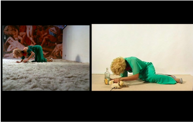
Abb. 2. Film-Still, Lerne deutsch mit Petra von Kant .

weißer Wollteppich im Vordergrund und im Hintergrund eine Bildtapete, auf der eine beschnittene und stark vergrößerte Reproduktion von Nicolas Poussins Gemälde Midas und Bacchus (um 1624) zu sehen ist. Die Figuren in Die bitteren Tränen der Petra von Kant sind so im Raum positioniert, dass sie als Teil der Bildtapete erscheinen (s. Abb. 2 und Abb. 3). 13