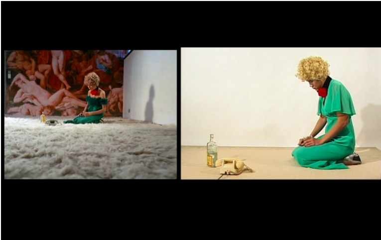
Abb. 1. Film-Still, Lerne deutsch mit Petra von Kant , Regie: Ming Wong (Ming Wong, 2007).

Figuren des Originals. Lerne deutsch mit Petra von Kant ist ein frühes Beispiel dieser Methode. Er erforscht darin die ihm fremde Kultur durch imitierende, expressive Verkörperung, Gestik, Mimik und Aussprache. Die Video-Version, auf die ich mich hier beziehe, zeigt im split screen das Original und Wongs Version nebeneinander. 11 In Wongs Performances verschmelzen Original und Imitation miteinander, ohne dass das Original verschwindet. Die Figuren sind »co-extensive with one another, echoing each other formally and occasionally becoming one, while still retaining distinct outlines«. 12