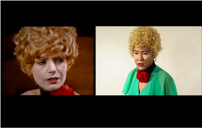
Abb. 4. Film-Still, Lerne deutsch mit Petra von Kant .

— unter den gegebenen strukturellen Bedingungen erlaubt Davis' vermeintliche Hässlichkeit Baldwin, sich in ihr wiederzuerkennen, eine Verbindung zu imaginieren, die ihn »hält«. Desidentifikation, so scheint es, ist hier auf der Grundlage möglich, dass das Objekt als zugleich begehrenswert und abjekt empfunden wird. Für Muñoz ist dies eine Frage des Überlebens: »A black and queer belle-lettres queen such as Baldwin finds something useful in the image; a certain survival strategy is made possible via this visual disidentification with Bette Davis and her freakish beauty.« 20