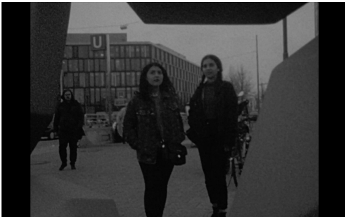
Abb. 10–12. Film-Stills, This Makes Me Want to Predict the Past .