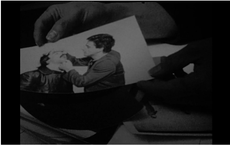
Abb. 16. Film-Still, This Makes Me Want to Predict the Past .

prüfend in den Mund, auf der Fotografie sind es zwei männliche Personen. Die Fotografie zeigt ein Reenactment der Situation, in der die sogenannten Gastarbeiter_innen im Auswahlprozess oder bei Ankunft in Deutschland auf ihre »Arbeitsfähigkeit« untersucht wurden (s. Abb. 16). Die Geste vermittelt in konzentrierter Form die demütigenden und entmenschlichen Elemente der »Gastarbeitergeschichte«. Die Kamera wechselt zwei Mal zu größeren Einstellungen, zuerst ist eine Hand sichtbar, dann eine zweite, dann andere Fotografien und ein runder Tisch, auf dem sie liegen, Unterarme. Später sind die Fotografien ein drittes Mal zu sehen sowie mindestens drei Paare Hände, Finger, die auf etwas zeigen, es entsteht der Eindruck einer Grupsituation, eines Gesprächs. Auf einigen der Fotografien ist nun deutlich eine Bühnensituation zu erkennen (s. Abb. 17). Die Fotografien dokumentieren das Kinder- und Jugendtheaterstück Düşler Ülkesi ( Land der Träume ), das 1982 an den Münchner Kammerspielen aufgeführt wurde. 28 Darin spielten minderheits- und mehrheitsdeutsche Laiendarsteller_innen Alltagsszenen aus dem Leben der »Gastarbeiter_innen« nach. Bei der Premiere des Stücks erhielt das Theater eine Bombendrohung.