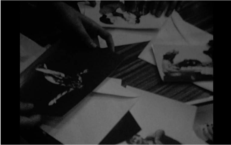
Abb. 17. Film-Still, This Makes Me Want to Predict the Past .