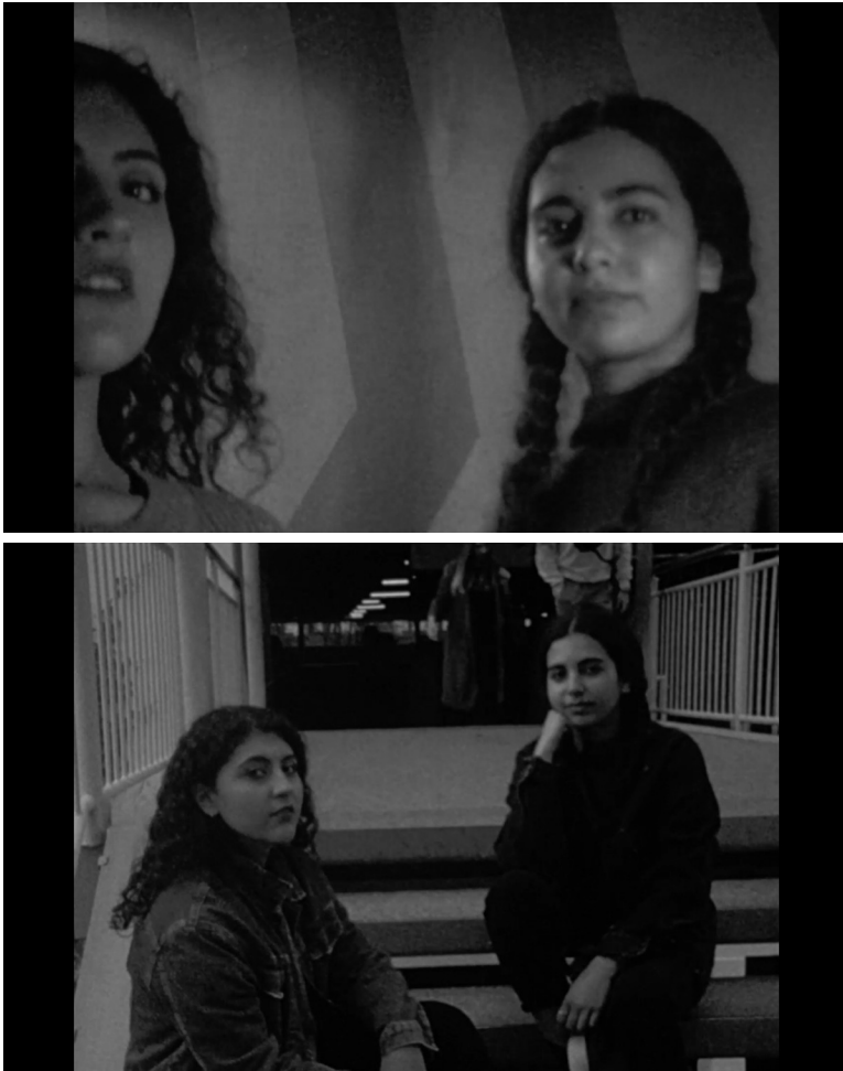
Abb. 8 und 9. Film-Stills, This Makes Me Want to Predict the Past , Regie: Cana Bilir-Meier (Cana Bilir-Meier, 2019).

low budget -Produktionen, politisch und sozial transgressive Formate und Themen sowie häufig queere Filmpraxis steht. 25