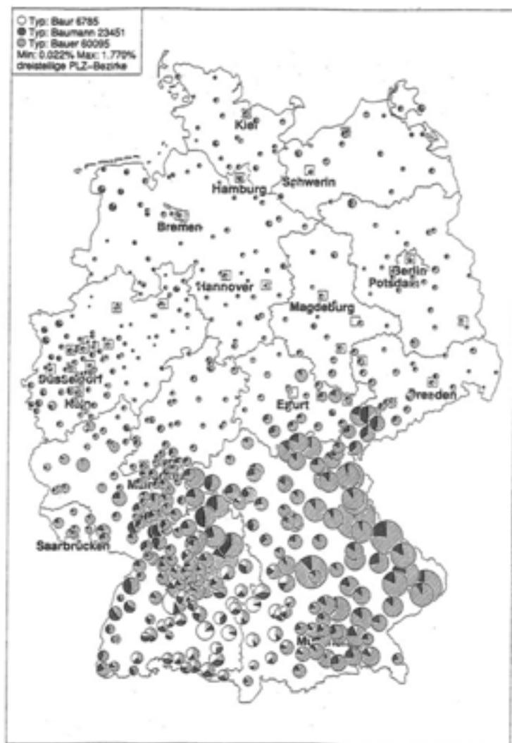
Karte 2: Verhältnis: Bauer – Baumann – Baur