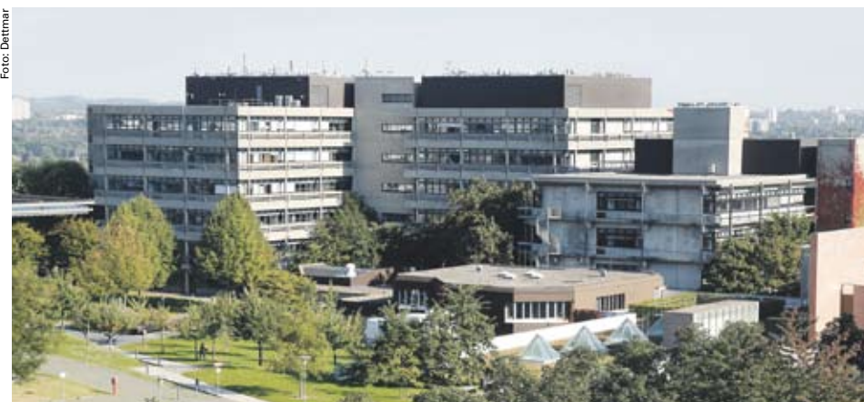
Die Gebäude der Chemischen Institute auf dem Campus Riedberg

Alle bisherigen Erfolge beim Auf- und Ausbau des Instituts habe man aus sich selbst heraus geschafft, resümiert Schwalbe nicht ohne Stolz, ohne jegliche Hilfe durch die Universität bei der Absicherung neu berufener Kollegen zum Beispiel. Immer seien die Forscher am OCCB bereit, innerhalb der akademischen Selbstverwaltung Verantwortung zu übernehmen,