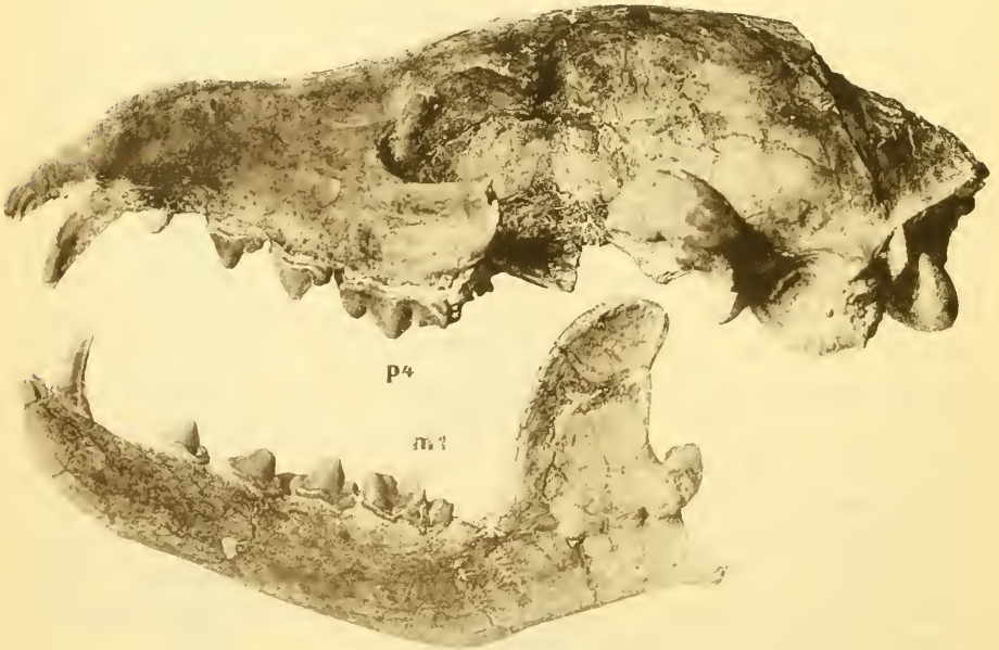
Schädel von Palhyaena hipparionum (Gervais) aus dem Unterpliozän von Samos (Seitenansicht). 2:3 nat. Gr.

Nach W. D. Matthew. Reißzähne sind nicht ausgebildet.