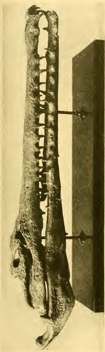
Tomistoma africanum Andrews, M. Eocän. Fajum, Egypten. Geschenk des Herrn E. Heinz 1912.