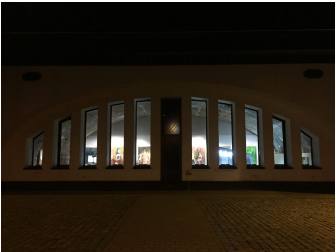
Der Blick durch die Fenster, WEGE-Ausstellung

Die 2015 gefertigte Skulptur findet in der Ausstellung WEGE auch ihren thematischen Bezug und kann als Versinnbildlichung der unterschiedlichen Wege verstanden werden. Die Spiegelskulpturen funktionieren aber nur im direkten Umgang mit dem Objekt, normalerweise dem Betrachter. Ohne Publikum fächert die Skulptur durch ihr Material nun die Arbeiten an der Wand auf und zeigt auf diese Weise unterschiedliche Blickwinkel und Wege.