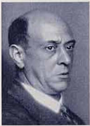
Arnold Schönberg 1874 – 1951

Geschätzte Freunde des Arnold Schönberg Center, sehr geehrte Damen und Herren!