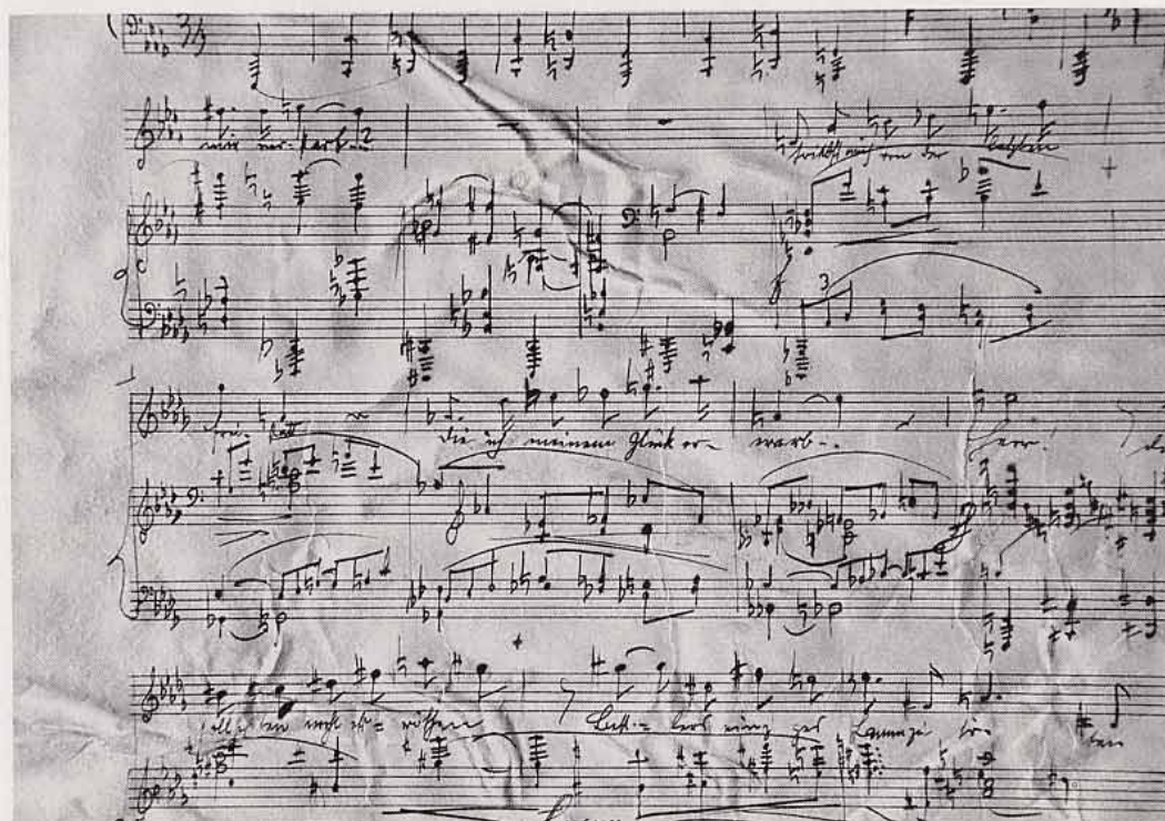
»Gurrelieder«, Archivnr. 2221 mit starken Stauchfalten; Detailansicht vor Ablösung der bis zu vier Schichten umfassenden Verklebung

With leaf 2215/2216 the adhesive showed little sign of swelling even after two hours of treatment with the Gore-Tex procedure. Only after additional treatment with the Albertina compress could the pasted papers be separated and the adhesive mechanically removed. This enzyme compress (for sale since the summer of 1999) was developed in Vienna expressly for dissolving starch-based adhesives that do not readily absorb moisture. The manufacturer's instructions recommend placing a thin piece of separating paper on the object to be treated, on top of this a fleece that has been