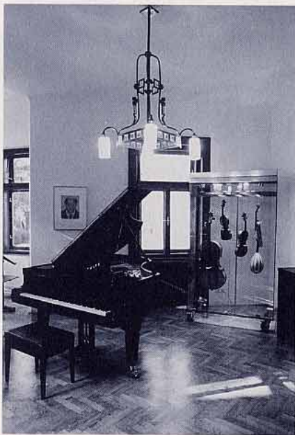
Arbeitszimmer Arnold Schönbergs, Schönberg-Haus in Mödling

Oliver A. Lång, Neue Kronen Zeitung, 30. September 1999