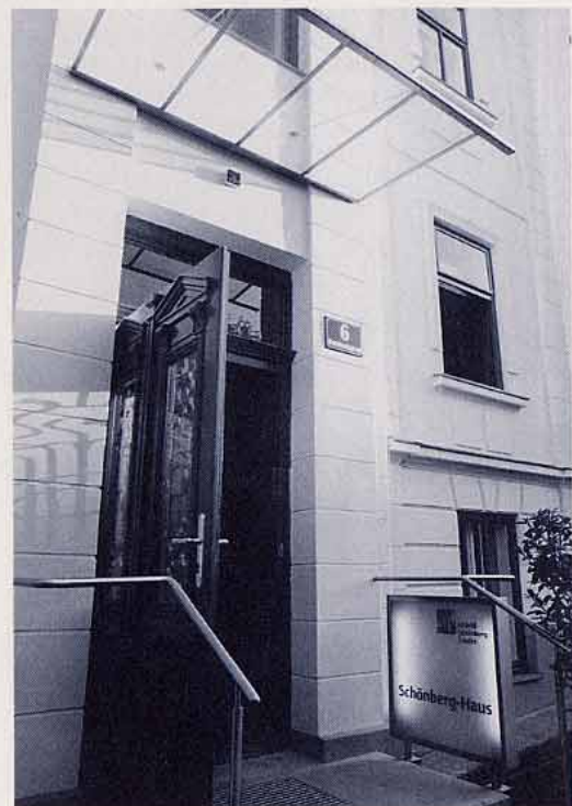
Entrance to the newly renovated Schönberg-House in Mödling, Bernhardgasse 6