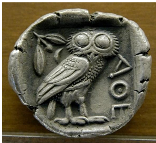
Silberne Tetradrachme mit Eule der Athene, ca. 480–420 v Chr., Musée des Beaux Arts, Lyon.

Beschäftigt man sich mit der Eule als Motiv in der Emblematis, stößt man auf eine kulturhistorisch vielfältige Zuschreibungsgeschichte. Dabei ist es mitunter nützlich, verschiedene Arten von Eulen zu unterscheiden. Denn von Eulen im Allgemeinen zu sprechen, erweist sich nicht immer als zielführend, da sich die Bedeutung je nach Art der abgebildeten Eule durchaus voneinander unterscheiden kann. Besonders auffällig sind die Unterschiede zwischen dem in der griechischen und römischen Antike positiv konnotierten Steinkauz und dem als Todesboten geltenden Uhu. In der griechischen Antike galt der Steinkauz als Attribut der Göttin Athene. Diese Verbindung lässt sich bis in die Anfänge der griechischen Überlieferung zurückverfolgen. Schon bei Homer begegnet die Bezeichnung \gamma\lambda\alpha\upsilon\kappa\tilde{\omega}\pi\iota\varsigma als Epitheton der Athene, die uns so als eulenäugige (bzw. kauzäugige) Göttin entgegentritt ( Odysee VI, 13). Vom sechsten bis zum ersten Jahrhundert vor Christus ist der Kauz als Motiv auf diversen Münzen der Stadt Athen abgebildet: 1