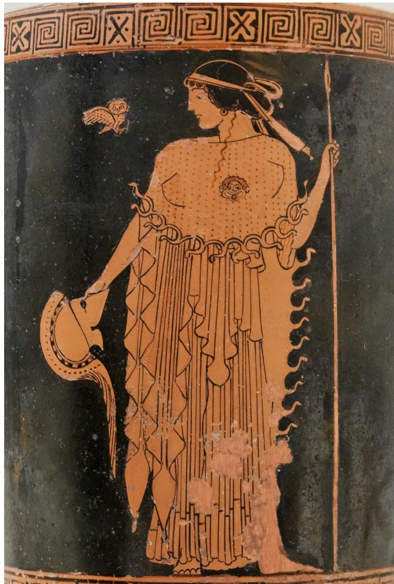
Athene, begleitet von einer Eule, attischer rotfiguriger Lekythos, ca. 490 v. Chr., Metropolitan Museum of Art. https://commons.wikimedia.org/wiki/File:Athena_owl_Met_09.221.43.jpg

Auch auf antiken bemalten Vasen und Gefäßen begegnet uns Athene vielfach in Begleitung ihres Wahrzeichens, des Eulenvogels, wie folgender Lekythos aus dem 5. Jahrhundert vor Christus illustriert: