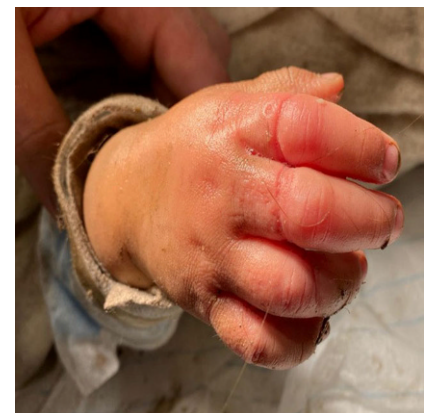
Abb. 2 ▲ Dargestellt ist die rechte Hand der Patientin nach der Entfernung des Abflussrohres. Man sieht die deutliche Schwellung und Weichteilaffektion der betroffenen Finger