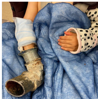
Abb. 1 ▲ Dargestellt ist die Patientin mit der vollständig in dem Abflussrohr befindlichen rechten Hand

Nach der Befunderhebung erfolgte die Rücksprache mit den Kollegen der hiesigen Feuerwehr sowie der gemeinsame Entscheid zur Entfernung des anliegenden Rohrs mittels Dremel und Zangen. Um ein sicheres Arbeiten zu gewährleisten, wurde die Patientin durch die Kollegen der Anästhesie narkotisiert. Anschließend wurde mit der schrittweisen Freilegung der Hand begonnen, wobei unter andauernder Kühlung beim Sägen auf die feststeckenden Finger geachtet werden musste. Nach schließlich 1,5 Stunden konnten die deutlich geschwollenen Zeige-, Mittel- und Ringfinger befreit werden. Bis auf oberflächliche Wunden zeigten sich die Weichteile intakt ( Abb. 2 ). Die Rekapillarierungszeit zeigte sich normwertig. Nach Ausleitung der Narkose wurden alle Finger frei bewegt. In der additiv durchgeführten Röntgendiagnostik zeigte sich keine knöcherne Affektion. Die Patientin wurde zusammen mit der anwesenden Mutter zur weiteren Überwachung sowie zur