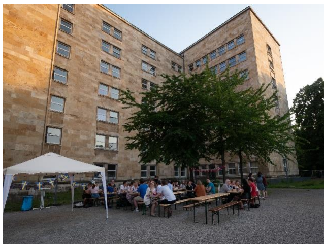
Mittsommerfest vor dem Institut.

Normalerweise sind wir im Fachschaftsraum (IG 157) anzutreffen, in dem auch die Spieleabende stattfinden. Zurzeit ist natürlich alles anders. Wir sind per Mail (siehe hier ) und über die Facebookgruppe Skandinavistik Uni Frankfurt erreichbar. Der Spieleabend findet auf unserem Discordserver Skandinavistik FFM statt. Über diesen Link könnt ihr ihm beitreten: https://discord.gg/zxF5HU3