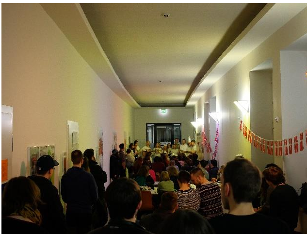
Auftritt des Chors beim Glöggfest.