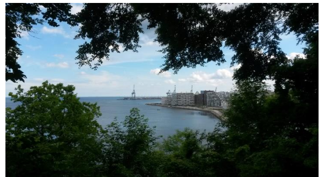
Blick auf das moderne Wohnviertel Aarhus Ø aus dem Wald Marienlund.

Viele Studierende leben in den Vierteln Aarhus N, Risskov, Skejby, Aarhus V, Brabrand und Viby, hauptsächlich in Wohnheimen. Auf dem Stadtplan wirken einige davon abgelegen, die Uni ist aber von überall gut zu erreichen. Tatsächlich dürfte der Weg mit dem Fahrrad aus der Innenstadt (Aarhus C) zur Uni am beschwerlichsten sein, da sie am Hafen und damit wesentlich tiefer gelegen ist.