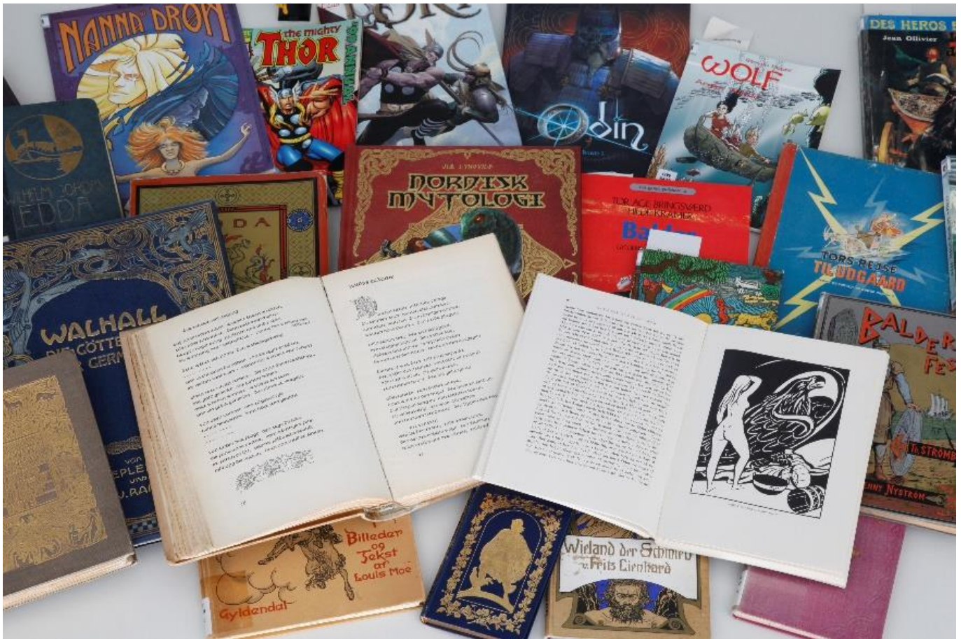
Die meisten Objekte der Edda-Sammlung sind Bücher. Foto Uwe Dettmar 2013.

Ein bisschen versteckt, buchstäblich im hintersten Winkel des IG-Farben-Hauses, steht an einer Tür „Edda-Sammlung“, und wer das liest mag sich fragen, was dort eigentlich gesammelt wird – vielleicht die schönsten Mädchen, die den Namen Edda tragen?