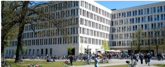
Gebäude Psychologie, Erziehung- und Gesellschaftswissenschaften (PEG).

Das SSC ist die zentrale Service- und Beratungsstelle der Goethe-Universität. Der Service-Point und die Telefonauskunft stellen euch Erstauskünfte zur Verfügung. Weiterführende Anliegen werden dann zum Beispiel vom Studierendensekretariat, vom International Office oder von der zentralen Studienberatung geklärt.