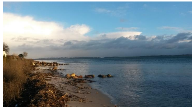
Skæring Strand, nördlich von Aarhus. In der Ferne lässt sich Schnee erahnen.

Um trotzdem sein Dänisch zu verbessern, kann ich empfehlen, einen Sprachkurs bei Lærdansk zu besuchen. Durch einen Einstufungstest war es möglich, in einen der höheren Kurse einzusteigen, der zweimal wöchentlich stattfand und in dem viel Konversation betrieben wurde. Außerdem gibt es ein Tandemprogramm, das passende Sprachpartner zusammenbringt. So lernte ich nach einer Weile einen deutschlernenden Dänen kennen und konnte über viele Freizeithemen sprechen. Mit den meisten Dänen kam ich letztendlich über die bereits erwähnten interdisziplinären Seminare ins Gespräch. Indirekt habe ich also durch englischsprachige Kurse mehr Dänisch gesprochen als durch dänischsprachige Kurse. Da sich das erst in meinem zweiten Semester entwickelte und alles seine Zeit braucht, kann ich nur empfehlen, ein ganzes Jahr in Aarhus zu studieren. Wäre ich schon im Winter wieder nach Hause gefahren, hätte meine Erfahrung deutlich schlechter ausgesehen – wohl nicht zuletzt getrübt durch das vorwiegend graue Wetter im Januar.