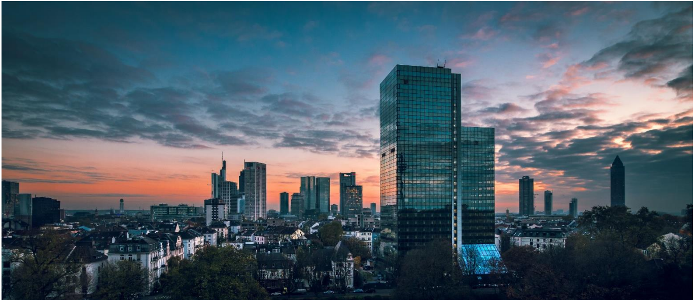
Blick auf die Skyline vom IG-Farben-Gebäude aus.

Wende dich einfach an die Institutsgruppe oder die Mitarbeiterinnen und Mitarbeiter. Wir helfen dir alle sehr gern weiter. Zum Schluss möchten wir noch auf den Beratungswegweiser hinweisen, der unsere Auflistung um einige Beratungsangebote ergänzt.