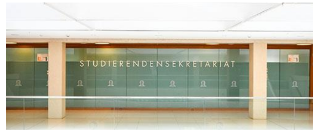
Studierendensekretariat im PEG-Gebäude.

Öffnungszeiten: Mo und Mi 12.30–15.30 Uhr, Di und Do 8.30–11.30 Uhr