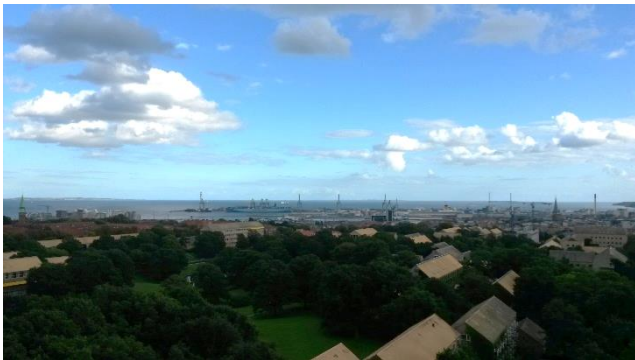
Blick vom Bibliotheksturm auf den Universitätspark und den Hafen.

Mit rund 38.000 Studierenden liegt die 1928 gegründete Aarhus Universität aktuell gleichauf mit der Københavns Universität. Bei einer Einwohnerzahl von nur 280.000 im Vergleich zu den über 1,3 Millionen Menschen in Kopenhagen hat die Universität in Aarhus jedoch einen ganz anderen Stellenwert. Die Stadt wirkt jung, die Wege zu den Universitätsgebäuden sind aus jedem Stadtteil gut mit Fahrrad oder Bus zu bewältigen, wobei man radelnd mit einem für dänische Verhältnisse unerwartet großen Höhenunterschied rechnen muss. Dennoch befindet man sich immer noch in der zweitgrößten Stadt des Landes, gelegen an der Küste Ostjütlands. 2017 war sie Kulturhauptstadt Europas.