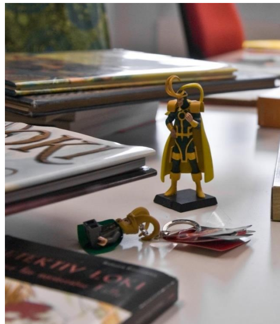
Der nordische Gott Loki in verschiedenen Gestalten.

elektronischen Datenbank dokumentiert, eine vollständige Erfassung wird angestrebt. Ein Projekt, das die Daten über ein Internetportal der Öffentlichkeit mit fundierten Erläuterungen auf der Grundlage aktueller Forschung sowie mit Text-, Bild- und Klangproben zugänglich machen sollte, hat leider keine Förderung erhalten und liegt vor allem auch wegen der prekären Stellsituation auf Eis. Schon jetzt aber sind Teile der Sammlung, vor allem Bücher, über den Online-Katalog der Frankfurter Universitätsbibliothek recherchierbar. Sie können im Bibliothekszentrum Geisteswissenschaften (BzG) der Universitätsbibliothek eingesehen werden. Die übrigen Bestände befinden sich im Institut für Skandinavistik – eben in jenem Raum der Edda-Sammlung im hintersten Winkel des IG-Farben-Gebäudes, in dem Sie also nicht die hübschesten Edda-Mädchen, dafür aber viele Mythen und Überraschungen aus dem Nachleben der Edda erwarten.