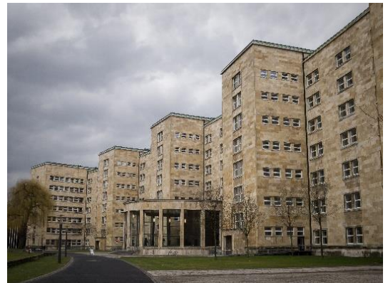
IG-Farben-Gebäude. Foto Lukas Maurer 2013.

...da ist die Informationsflut immens und man kann leicht die Übersicht verlieren. Wir, die Institutsgruppe, wollen dir helfen, dich von Anfang an gut zurechtzufinden und nichts Wichtiges zu vergessen. Als eine erste Anlaufstelle für aktuelle Nachrichten solltest du immer die Institutshomepage im Blick behalten. Dort findest du auch Informationen für Erstsemester . Darüber hinaus haben wir hier im Folgenden alles, was du für deinen Studienbeginn wissen solltest, zusammengestellt – über dein neues Studium, über das Institut, die Institutsgruppe und die Uni. Und wir würden uns sehr freuen, wenn wir dich auch bald persönlich kennenlernen. Gerade auch in dieser schwierigen Zeit der Corona-Pandemie ist es umso wichtiger, persönliche Kontakte zu knüpfen – das macht schließlich einen großen Teil des Studienlebens aus.