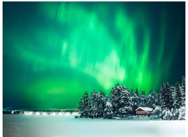
Nordlichter am Nydalasjön in Umeå.

Wir empfehlen euch, unbedingt ein oder zwei Auslandssemester zu machen. Das ist eine großartige Möglichkeit, eure gewählte skandinavische Sprache zu verbessern und Erfahrungen zu sammeln, die ihr später nicht mehr missen wollt. Ihr könnt euch schon in eurem dritten Semester für einen Auslandsaufenthalt entscheiden, die Lektor*innen empfehlen aber, es erst im fünften Semester zu machen – aus dem einfachen Grund, dass du deine skandinavische Sprache bis dahin viel besser beherrschen wirst und dich problemlos mit Muttersprachlern unterhalten können wirst. Wichtig ist, daran zu denken, dass du dich etwa sechs Monate vor deinem Auslandssemester schon darum kümmern musst. Hier erhältst du mehr Informationen.