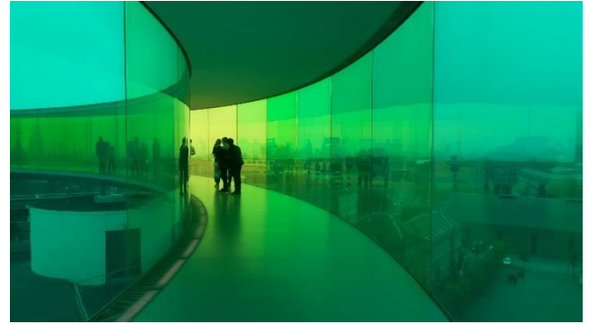
Das Regenbogenpanorama auf dem Dach des ARoS Museums.