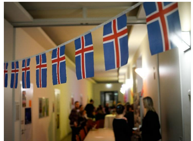
Immer ein Highlight: Das Glöggfest.