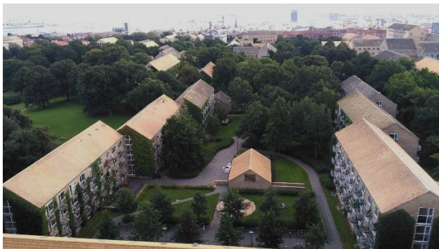
Der Universitätspark von oben.

„Apps für alles, 1001 Accounts und Passwörter. Wo bekomme ich jetzt die Zugangsdaten hierfür her?! Warum funktioniert meine EC-Karte nicht und was für eine krasse Akkuleistung haben diese Laptops? Alles online, alles digital. Ich werde nie wieder einen Text ausdrucken. Du kannst dich nicht einloggen – du existierst nicht! Accountdaten weg. Warum wusste ich nichts von studenthousing? Gibt es hier überhaupt Smartphone-rebellen? Kassiererlose Kassen im Føtex bei Klosterortvet. Blackboard und Facebookgruppen für einzelne Kurse.“