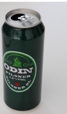
Der oberste Gott Odin als Pate für Bier. Foto Uwe Dettmar 2013.

Mit den individuellen Forschungsvorhaben der Projektbeteiligten – exemplarischen Studien zur Rezeption der nordischen Götter- und Heldensage in Literatur, bildender Kunst, Religion, Musik und Alltagskultur der Moderne – begann eine Phase der zielgerichteten Ergänzung der Edda-Sammlung: Gesammelt wurde nun, was konkret Gegenstand dieser Untersuchungen war oder – auch durch das Sammeln – wurde. So ist etwa der Bestand an illustrierten Büchern aus dem Themenbereich der nordischen Mythologie für die inzwischen abgeschlossene Dissertation von Sarah Timme über die nordischen Mythen in der Buchkunst erheblich ausgebaut worden, und für eine musikwissenschaftliche Studie über nordische Mythen im Heavy Metal wurde eine umfangreiche Sammlung von einschlägigen CDs angelegt. Ungewöhnlicher für eine philologisch verankerte Universitätsammlung sind die zahlreichen Objekte der Alltagskultur. Sie kamen für