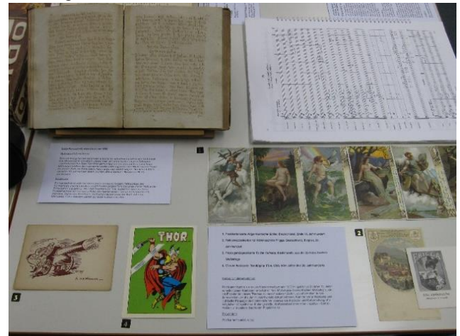
Nordische Mythen leben in Schrift, Bild, Ton und Alltagskultur weiter. Bild Katja Schulz 2012.

so, wie eben viele Forscher interessante Nebenaspekte oder Kuriosa ihres Spezialgebiets sammeln. Dazu gehörten etwa bibliophile Editionen oder Kartenspiele mit einem Blatt nordischer Götter, eine Ansichtskarte aus dem Hotel „Walhalla“ oder eine CD mit musikalischen Rekonstruktionen von Eddaliedern, Propagandamarken, die den Gott Heimdall als Garanten des Deutschtums abbilden oder Käseschachteln von einem Camembert der Marke „Valkyrie“. Bereits zu Beginn ihrer Projektarbeit konnte daher die Arbeitsgruppe „Edda-Rezeption“ auf einen – ziemlich zufälligen – Grundbestand an Objekten zurückgreifen, die ein breites Interesse an den eddischen Stoffen bis heute belegen. Schnell ließ sich so ein Eindruck gewinnen von der bis dahin noch nicht beschriebenen und erschlossenen Vielfalt, in der sich die nordische Mythologie und Heldensage seit dem Mittelalter bis zur Gegenwart manifestiert: in medialer Hinsicht ebenso wie in ideologischer, in zeitlicher wie in geografischer Ausdehnung.