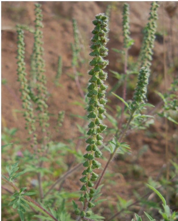
Abb. 1: Ambrosia artemisiifolia ; Mörlenbach, Akazienweg, 10. 10. 2005.