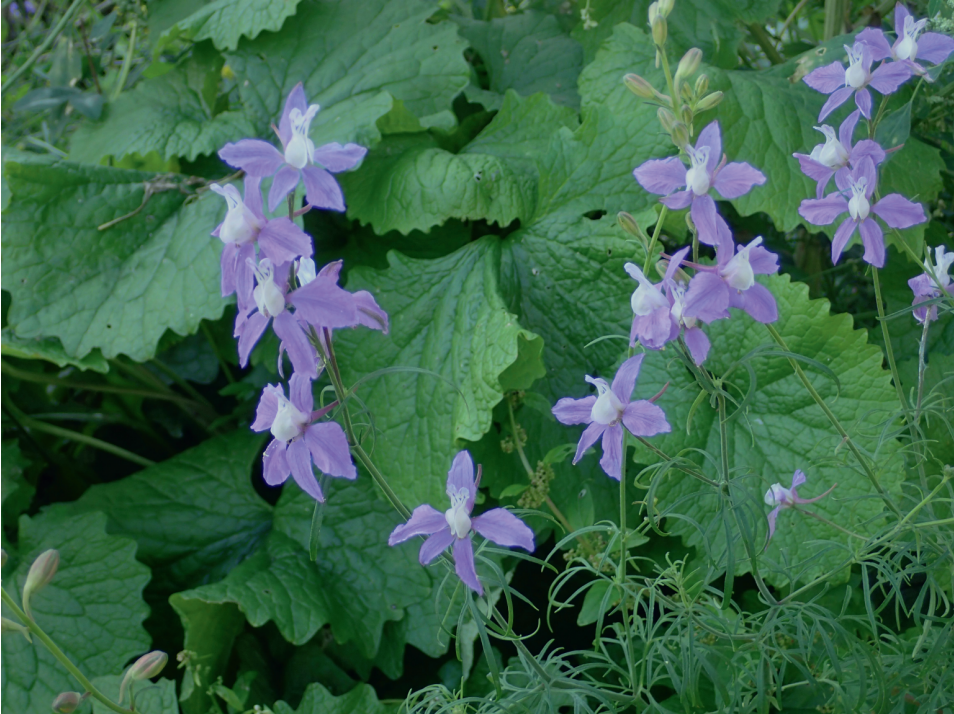
Abb. 3: Consolida ajacis ; östlich Mörlenbach-Groß-Breitenbach, 1. 9. 2021.

Unbeständige Verwilderungen der Art wurden schon mehrfach im Weschnitztal gefunden.