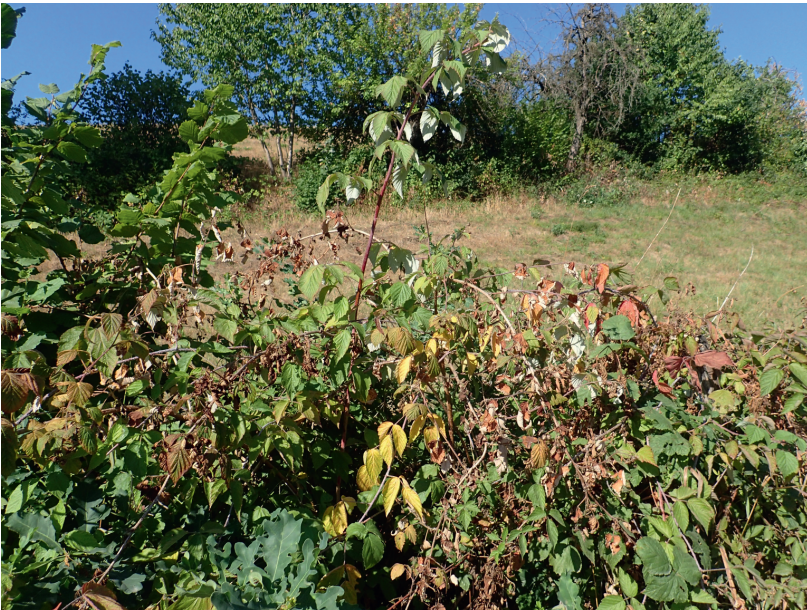
Abb. 9: Rubus ×idaeooides ; westlich Mörlenbach, am Fuß des Willenberges, 15. 8. 2022.