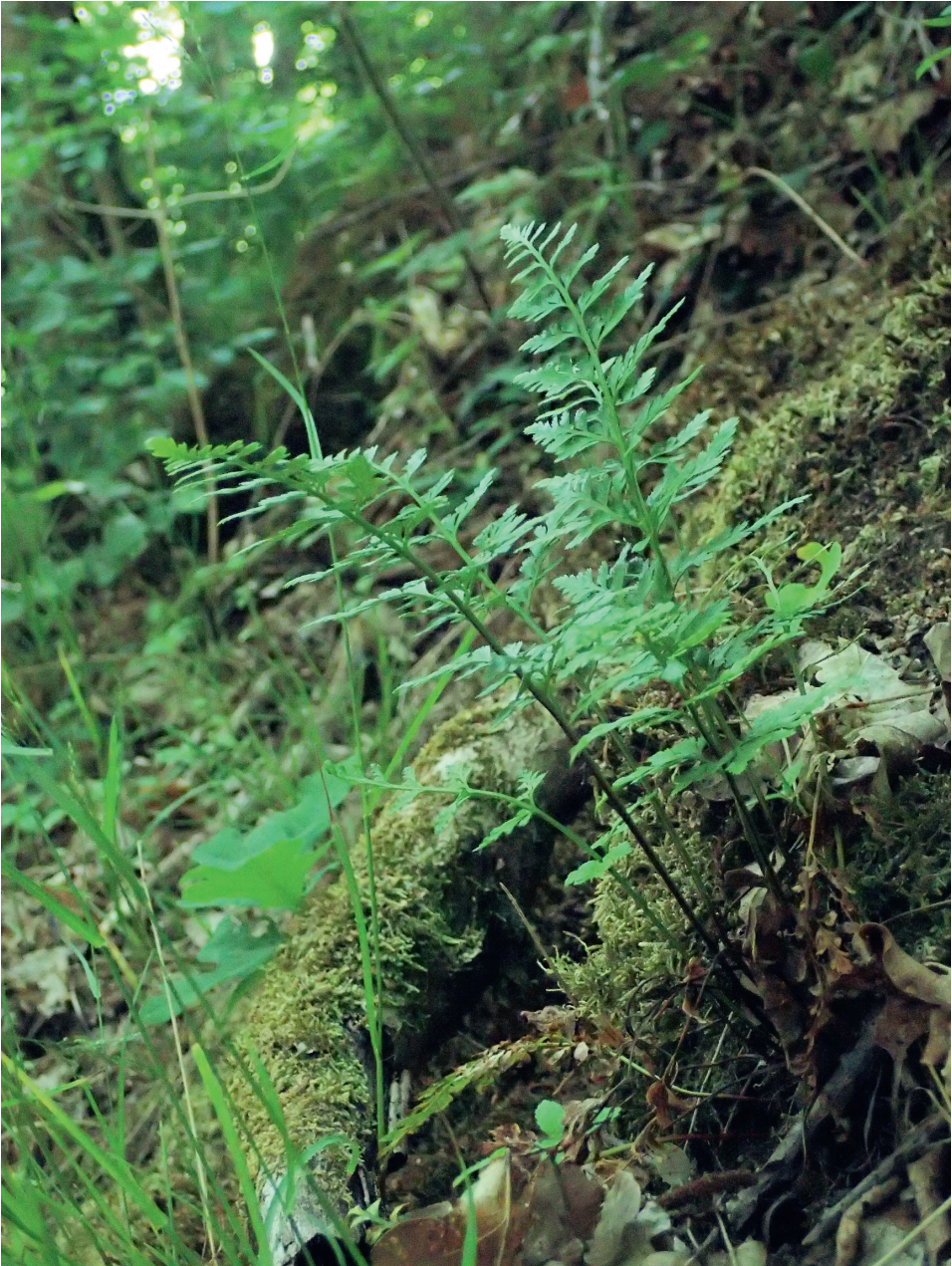
Abb. 2: Asplenium adiantum-nigrum ; nordöstlich Mörlenbach-Groß-Breitenbach, 15. 5. 2020.