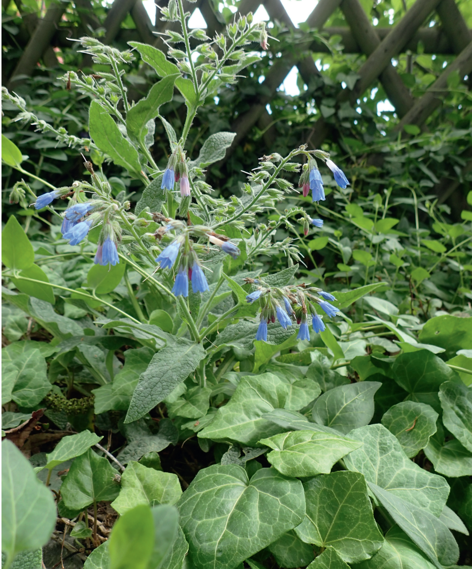
Abb. 10: Symphytum caucasicum ; Mörlenbach, am Bürgerhaus, 10. 5. 2020.

Symbol für Mengenstufe 1 in der Verbreitungskarte der Weschnitztalflora. Die Art wurde bereits in Weinheim gefunden und aufgrund des langjährigen Bestehens als in Einbürgerung begriffen angesehen. Das aktuelle Vorkommen dürfte allerdings unbeständig sein.