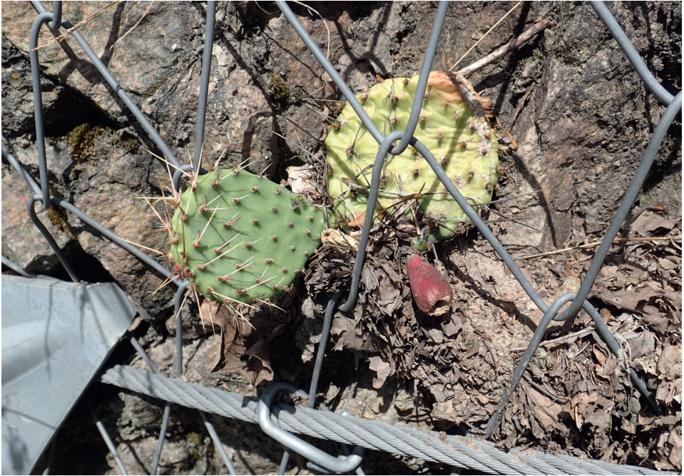
Abb. 6: Opuntia humifusa ; östlich Fürth-Brombach, an der Bundesstraße 460, 8. 7. 2022.