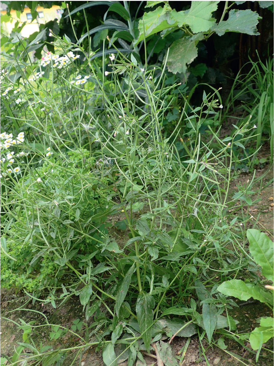
Abb. 4: Epilobium ciliatum ; Mörlenbach, Am Knippelsacker 7, 6. 7. 2022.