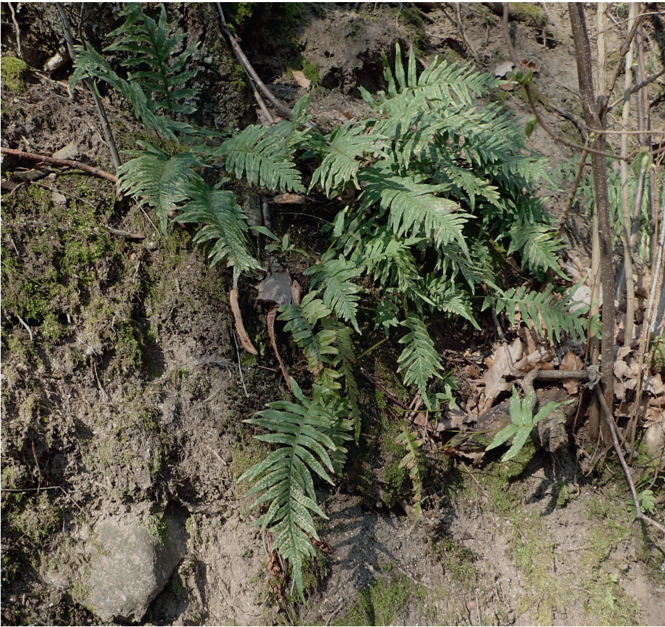
Abb. 7: Polypodium interjectum ; südöstlich Rimbach-Albersbach, 1. 3. 2022.