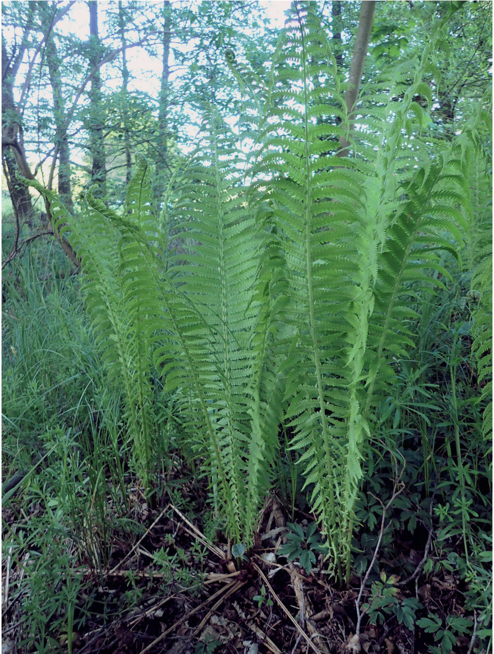
Abb. 5: Matteuccia struthiopteris ; südlich Weschnitz, 5. 5. 2020.