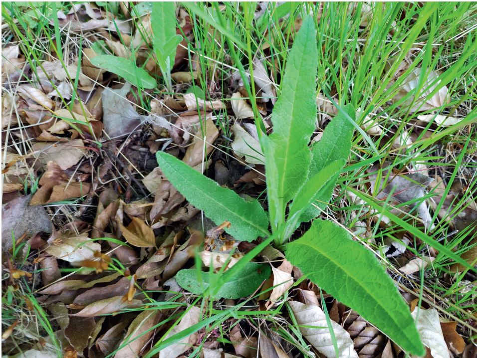
Abb. 2: Grundblätter von Campanula cervicaria ; 13. 5. 2022, Ober-Gleen. – Basal leaves of Campanula cervicaria .