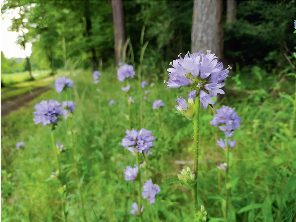
Abb. 4: Campanula cervicaria am Habertshäuser Berg südlich Ober-Gleen; 7. 7. 2021. – Campanula cervicaria south of Ober-Gleen at Habertshäuser Berg.