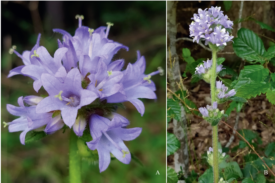
Abb. 1: A: Blütenstand von Campanula cervicaria , Ober-Gleen; 7.7. 2021. B: Borstiger Stängel von Campanula cervicaria mit Blütenstand; Jossa; 26. 6. 2022. – A: Inflorescence of Campanula cervicaria in Ober-Gleen (Hesse, Vogelsberg county). B: Bristly stem of Campanula cervicaria with inflorescence in Jossa (Hesse, Main-Kinzig county).

Blütezeit ist von Ende Juni bis Ende Juli, es können sich aber auch Nachblüten bis in den September hinein entwickeln. Gelegentlich wird Campanula cervicaria mit C. glomerata verwechselt, die aber keinen borstigen Stängel besitzt und in deutlich anderen Habitaten wie Trockenrasen, magere Wiesen etc. vorkommt.