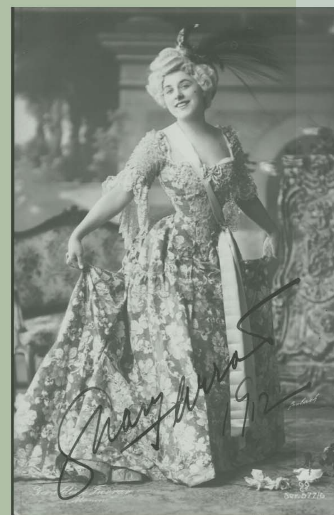
Farrar, Geraldine [Sängerin, Schauspielerin, Schriftstellerin] (1882-1967) Rollenbild als Manon, in: Jules Massenet, Manon, 1912

Das inzwischen abgeschlossene Projekt der Universitätsbibliothek Frankfurt umfasste die Sicherheitsverfilmung und Digitalisierung von über 17.500 Bildnissen von Personen und Objekten aus dem Musik- und Theaterbereich aus der Zeit von 1700 bis 1900 (Druckgrafik) bzw. 1860 bis 1944 (Fotos). Die Bilder sind über den Online-Katalog der Bibliothek sowie direkt auf einem Server (mit vereinfachter Recherchefunktion) allgemein zugänglich.