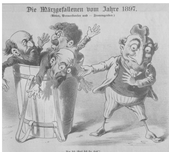
Abb. 3: Bildautor unbekannt: »Die Märzgefallenen vom Jahre 1897«, in: Kikeriki. Humoristisches Volksblatt, Nr. 22, 18.3.1897, Titelseite

konservativ orientierte Blatt Kikeriki , antisemitisches Sprachrohr der Christlichsozialen Partei, prophezeite Folgendes: »Von den Märzgefallenen. Nachdem diesmal die Wahlen im Monat März stattfinden, so wird es zweierlei Märzgefallene geben: die Einen, an die man sich jedes Jahr erinnert, die Anderen, nach denen kein Hahn mehr krächt«. 89 Die sozialdemokratisch orientierte humoristisch-satirische Zeitschrift Die Glühlichter sah den Ausgang der Wahlen zum Reichstag 1897 ähnlich: »Die Reichstagswahlen finden im März statt. Da werden am Ende gar unsere Liberalen – Märzgefallene werden«. 90 Diese Wahl fiel aber auch für die Sozialdemokratie ausgesprochen schlecht aus. Kikeriki ernannte daraufhin die sozialdemokratischen Verlierer zu den »Märzgefallenen des Jahres 1897«. 91 Mit Viktor Adler (1852–1918) und Engelbert Pernerstorfer (1850–1918) werden der Begründer der Sozialdemokratischen Arbeiterpartei Österreichs (SPÖ) und ein weiteres prominentes Mitglied der SPÖ abgebildet.