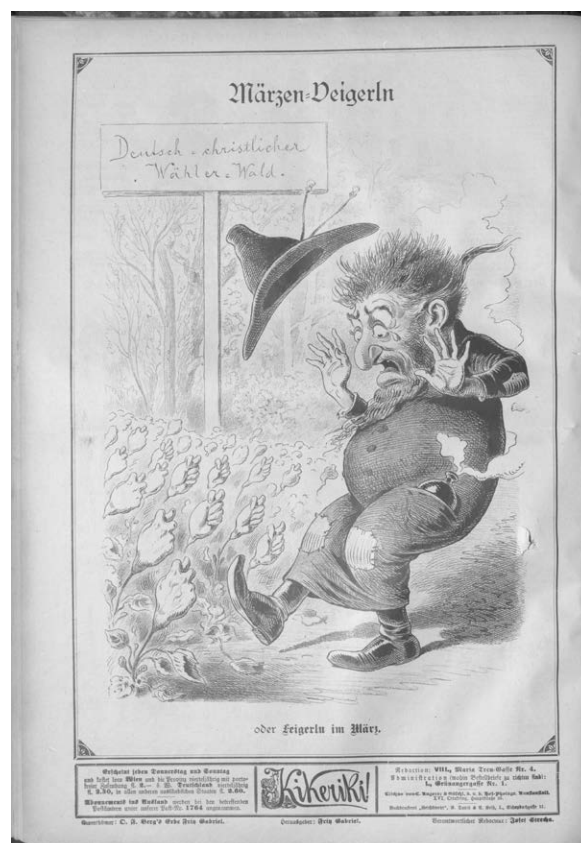
Abb. 4: Bildautor unbekannt: »Märzen-Veigerln«, in: Kikeriki. Humoristisches Volksblatt, Nr. 22, 18.3.1897, ohne Pag. (S. 4)

Haltung. Die Darstellung des Gesichts ist deutlich antisemitisch konnotiert. In der linken Tasche glimmt die Lunte einer Bombe. Der »Märzgefallene« weicht ängstlich und erschreckt zurück. Ein Schild mit der Aufschrift »Deutsch-christlicher Wählerwald« verweist auf die Wahl vom März 1897 und zugleich darauf, wer sich dem »Märzgefallenen« entgegenstellt: Unzählige Pflanzen mit Blüten in Form einer Feigenhand (Daumen zwischen Zeige- und Mittelfinger) stellen sich ihm in den Weg. Die Geste der Feigenhand symbolisiert die Abwehr von Unheil und Zumutungen und ist zugleich sexuell konnotiert (etwa im Sinne von: »Fick dich ins Knie!«). Diese doppelte Konnotation zeigt sich auch in der Bildüber- und -unterschrift. Der Bildautor spielt mit den Begriffen »Feigerln« und »Veigerln«. Ersteres ist ein Synonym für »verspotten«, »ärgern«. Zweites spielt – ebenso wie die Feigenhand – auf derbe Weise auf den Geschlechtsverkehr an.