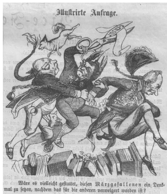
Abb. 2: Bildautor unbekannt: »Illustrierte Anfrage«, in: Figaro. Humoristisches Wochenblatt , Nr. 27, 6.7.1861, Titelseite; ANNO/Österreichische Nationalbibliothek

hier nicht zu jedweder Anpassung bereite Opportunisten, sondern im Gegenteil: einen gesellschaftlichen Stand, der nicht mit der Zeit geht, sondern dies verweigert und das Rad der Geschichte anhalten, wenn nicht zurückdrehen will. Man könne, wenn man nicht den wahren Märzgefallenen ein Denkmal bauen wolle, dies dann zumindest für die Gestrigen tun, für die Verlierer des historischen Fortschritts.