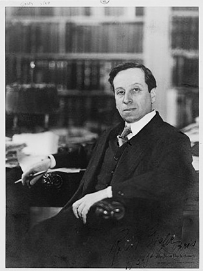
Abb. 1: Robert Eisler 1925 in Paris

Kapitalismus als Religion (Walter Benjamin, 1921) – als den unbewussten Zusammenhang von Schuldenmachen und Schuld in Verlängerung zu und gleichzeitiger Konkurrenz mit dem Christentum – versprache. 56 Auch seine kurze Tätigkeit 1925 in Paris, als er stellvertretender Sekretariatschef des Völkerbundinstituts für geistige Zusammenarbeit wurde, übergehe ich. 57 Erwähnen möchte ich nur, dass das Foto Eislers, das ich hier abbilde, aus dieser Lebensphase stammt. Es zeigt ihn am Schreibtisch seiner Pariser Wohnung und war, mit einer Widmung versehen, ein Geschenk für Scholem. 58