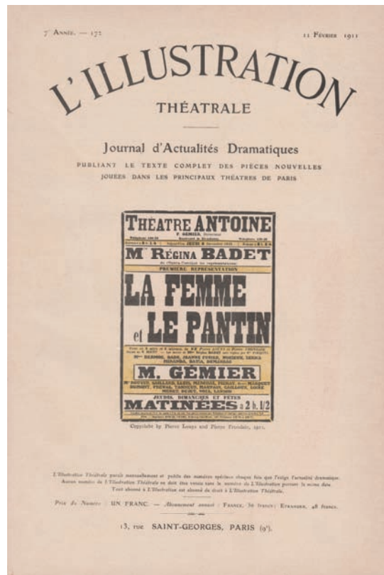
Abb. 3: O. A.: Le théâtre illustré de pneu , in: L'Illustration théâtrale , 11. Februar 1911, S. 1.

gleich über die Maßen realistisch. Das liegt zum einen am selten gewährten Anblick eines zerfetzten Schlauchs selbst, den wahrscheinlich nur wenige Personen im bildungsbürgerlichen Publikum von L'Illustration théâtrale je zu Gesicht bekommen hatten. Große Löcher, lange Risse und der mal raue, mal glatte Rest an Kautschuk-Struktur verleihen den Oberflächen und Volumina eine ausgesprochen organische Lebendigkeit. Diese Wirklichkeitsnähe, welche die Photographie damals noch generieren und versprechen konnte, muss für zeitgenössische Augen frappierend gewesen sein. Zum anderen resultiert die ungewöhnliche Abstraktion der Abbildung aus einer Kombination von Farbigkeit, Maßstab und Umgebung. Sie war rot-weiß statt schwarz-weiß und gewährte in ihrem Detailreichtum annähernd mikroskopische Einblicke. Zudem ist sie das einzige Bildelement der Annonce, das auf einer Photographie basiert, nun aber freigestellt, das heißt ausgeschnitten und in einen neuen Kontext gesetzt. Dadurch verliert die Schlauchfigur entschieden ihren eigentlichen Gegenstandsbezug.