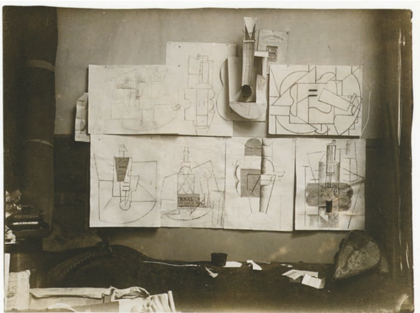
Abb. 6: O. A.: Pablo Picasso: „Installation de papiers collés n°1 (I).“ Ansicht von Picassos Atelier am Boulevard Raspail 242, Paris, 9. Dezember 1912. Photographie, 9 × 12 cm. Privatsammlung.

des komponierenden Ausschneidens und Klebens in zwei wie drei Dimensionen veranschaulichen konnten.