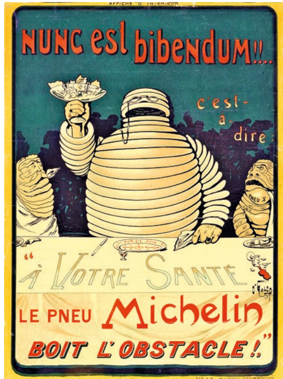
Abb. 2: Marius Rossillon: Plakat „Nunc est bibendum!“, um 1900, Lithographie, 45 × 36 cm.

mental verdeutlichen, die sich als Trinkgenossen rechter und linker Hand von Bibendum wohl verschluckt haben. Die Überschrift „Nunc est bibendum!“ – zu Deutsch: „Jetzt gibt es zu trinken!“ – ist eine Sentenz aus einem Lied von Horaz und verankert somit die innovative Figur im antiken Rom sowie die moderne Plakatwerbung in der Form des neuzeitlichen Emblems.