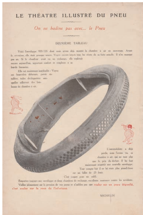
Abb. 4: O. A.: Le théâtre illustré de pneu , in: L'Illustration théâtrale , 4. März 1911, S. 28.

von „sans rechanges“ im Text – und habe, nachdem er einen spitzen Gegenstand überfahren hat, etliche Kilometer mit dem Platten fortsetzen müssen. Der Schaden belief sich dabei nicht alleine auf die kursiv gesetzten „6 francs“ für den Luftschlauch, sondern sei noch höher. Doch wer den wahren Betrag erfahren möchte, müsse bis zur nächsten Ausgabe mit der Fortsetzung des Théâtre illustré du Pneu warten. Ein solcher Cliffhanger war bereits im 19. Jahrhundert bezeichnend für die Massenmedien und konnte sich in den erwähnten Feuilleton-Romanen sowie in Ratespielen auf der Rückseite von Illustrierten äußern, deren Auflösung erst in der Folgeausgabe stand. 12 Das waren erprobte Mittel der Motivation zum Abonnement und somit zur Vorfinanzierung der kostspieligen Produktion. Auf der Rückseite der nächsten L'Illustration théâtrale am 4. März 1911 war schließlich zu erfahren, dass nicht nur der Schlauch, sondern auch der Reifenmantel irreparabel beschädigt war. Wie diese zweite, in Dunkelbraun und Rot gehaltene Annonce informierte, erhöhte das die Kosten um weitere 25 Francs (Abb. 4).