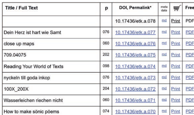
Abb. 7: aaaa press-Titelliste (Screenshot eines Auszugs aus dem Cloud-Dokument unter aaaa.etkbooks.com )

Auch in dieser Reihe spielt eine intensive Metadatenarbeit eine größere Rolle, mit dem wei-teren Effekt einer späteren Auslagerungsmöglichkeit der Distribution über das digitale Web-archiv einer Bibliothek (Schweizer Nationalbibliothek). Im Moment liegen die digitalen Ob-jekte alle noch frei zugänglich in meiner Google-Drive-Cloud (erreichbar über die URL aaaa.etkbooks.com ) und sind über ein Webdokument ebendort mit spezifischen Ordner-Deeplinks der Cloud verknüpft. Ebenso werden die Links zu den Print-on-Demand-Bestelloptionen aller Einzelwerke aufgeführt (vgl. Abb. 7). Jedoch kann sich die Reihe im Netz jederzeit zurück-ziehen und ihre ursprüngliche URL samt Cloud aufgeben und damit – ohne deren explizite Einwilligung – der Schweizer Nationalbibliothek, wo die digitalen Objekte gespeichert sind, auch die Rolle eines Verlags, zumindest Distributors übertragen.