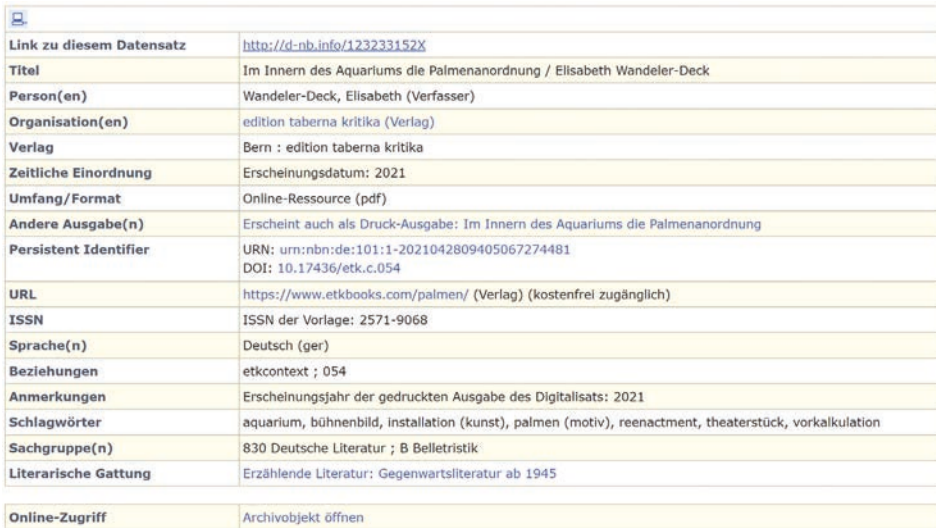
Abb. 6: Katalogisat in der Deutschen Nationalbibliothek, http://d-nb.info/123233152X . Der Verlags-DOI ist hier im Feld Identifier abgelegt, was bedeutet, dass über eine spezielle Katalogsuche mit den Identifiern serienmäßig eindeutige Deeplinks generiert werden können. Die im Nachhinein anpassbare URL-Verlinkung eines DOI kann also auf Wunsch und unter Kontrolle des Verlags auf ein Katalog- und Archivobjekt der DNB zeigen und diese quasi als Document Cloud herangezogen werden.

Weitere Maßnahmen sollen eine gewisse Nachhaltigkeit in der Verfügbarkeit gewährleisten: Neben dem Verlagsserver werden von mir diverse bibliothekarische Web- und Langzeitarchive wie die DNB, die Schweizerische Nationalbibliothek und das UB Repository der Universität Bern mit „Archivobjekten“ (DNB) und deren Meta- und Erschließungsdaten bestückt, sodass die Titeldaten dann über diverse Metakataloge wie den Karlsruher Virtuellen Katalog oder Suchmaschinen wie Google Scholar findbar sind. Und auch diese digitalen Objekte werden retrospektiv in die jährlich aktualisierte, von etkbooks herausgegebene Annotierte Bibliographie (Print und Online) der Verlagsproduktion aufgenommen und dort ausgewiesen. Dort werden die Erschließungsdaten als Schlagwortregister der Reihen etkbooks und etkcontext in einem gemeinsamen Index verschmolzen, was mediale Unterschiede in der Präsentation praktisch aufhebt bzw. die üblichen Priorisierungen angleicht. Der verschmolzene Index in der Annotierten Bibliographie vollzieht damit letztendlich auch analog das nach, was in dynamischen Bibliothekskatalogen schon länger üblich ist: Inhaltliche Recherche nach Literatur mit der Möglichkeit facetrierter inhaltlicher Filterung ist eine wichtigere, höher zu gewichtende Option als eine relevanzmäßige Präselektion nach Medium (digital oder print). Ein Ziel einer sol-