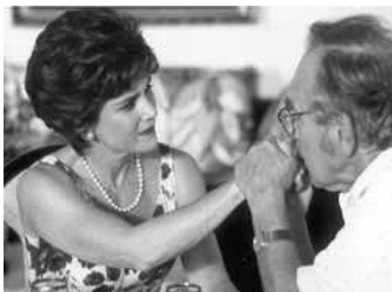
Aus dem Kurzfilm „Späte Liebe - Old Love“

20 Min., D, 2000, Kurzspielfilm Der Film fragt, warum der Mensch geboren wird und warum er sterben muss. Er erzählt die Geschichte vom alten Harry Bendiner und seiner neuen Nachbarin Ethel. Die bei den fühlen sich gleich bei ihrem ersten und einzigen Aufeinandertreffen stark zueinander hingezogen. Obwohl Ethel erst vor kurzem ihren Mann verloren hat, macht sie gemeinsame Pläne für ein Leben mit Harry.