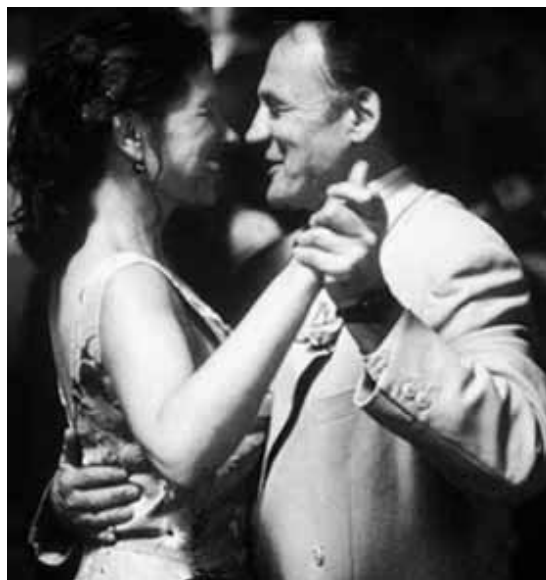
Aus dem Spielfilm „Brot und Tulpen“

fon – doch für Rosalba beginnt ein neues Leben, eine Auszeit, in der ihre Missgeschicke abnehmen und ihr Glück wächst.