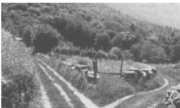
Aus der Diareihe „Wege“ (Verleihnummer 100305)

Setzen Sie z.B. Dias zur Einstimmung oder zum Abschluss einer Veranstaltung ein. Oder Sie können selber Reihen aus verschiedenen Diasammlungen anlegen, z. B. Thema Lebensweg, Geborgen- oder Einsamsein, Abschied nehmen, Neues wagen, das Fremde usw.