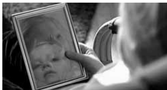
Aus dem Kurzfilm „Tytönen“

Mann, der sie "Mutter" nennt. Der finnische Kurzfilm zeigt auf eine liebevolle Art und Weise die Beziehung zwischen Jung und Alt - Traum und Realität.