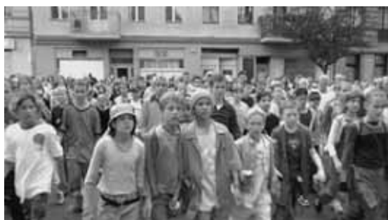
Aus dem Spielfilm „Emil und die Detektive“ (Verleihnummer 4300656)

Großeltern und Enkel lachen und bangen zusammen im Kino, eine Schulklasse lädt das benachbarte Altenheim zum gemeinsamen Filmerleben ein: zwei Beispiele aus dem generationsübergreifenden Kino für Jung und Alt. Da locken Klassiker des Kinderfilms von damals kleine und große Kinofans in die Vorführungen. Junge und alte