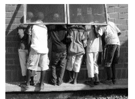
Bildungshunger: Großer Andrang während der ersten Führungen durch die Ausstellung – die Wartezeiten betragen bis zu einer Stunde

Die zumeist aus freiwilligen Helfern bestehende Crew der Uraha Foundation Malawi und Deutschland zielt jedoch nicht nur auf die Vermittlung von fossilem »Knochenwissen«. Das kulturelle Erbe der Ngonde lässt sich auch zwei Millionen Jahre nach dem Fund des ersten Bewohners des Karonga Distrikts weiterverfolgen. Die Geschichte Karongas geht weiter: Mit der Besiedlung Mbande Hills, einem Berg, 20 Kilometer östlich des Museumsprojektes, fängt die moderne Geschichte Karongas an. Bereits früh wird das Idyll am fruchtbaren Rukuru-Fluss durch Sklavenhandel und kriegerische Auseinandersetzungen zerstört. Missionierung, Kolonialmacht, Erster Weltkrieg folgen und erst 1964 scheint das Land und damit auch Karonga wieder in die »eigenen« Hände zu fallen. Doch der Schein