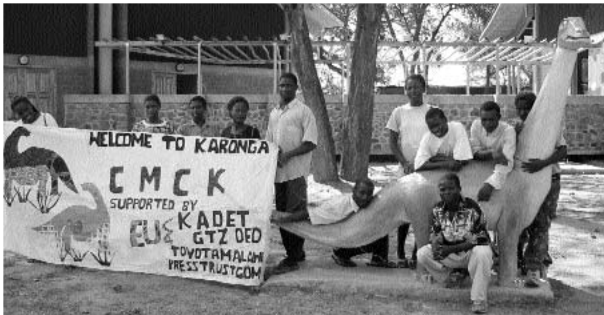
Dinodoners: Ohne sie ginge gar nichts: Die Sponsoren und die Volontären des Museums-Clubs, die für die Touren durch 240 Millionen Geschichte zuständig sind, haben das Projekt erfolgreich durch die vierjährige Implementierungsphase geführt