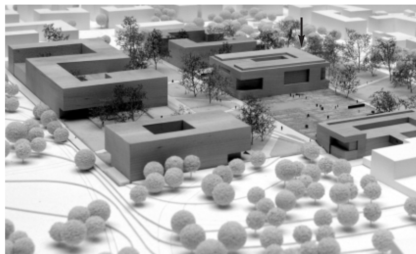
Einzigartiges Neubaugebiet: Blick auf das Ensemble der fünf Gebäude, hier die Entwürfe von Ferdinand Heide Architekten BDA, Frankfurt, die im Wettbewerb um das Hörsaalgebäude (Pfeil) siegten; unten der siegreiche Entwurf des Institutsgebäudes Rechtswissenschaften/Wirtschaftswissenschaften von Thomas Müller Ivan Reimann Gesellschaft von Architekten mbH, Berlin

Die Aufgabe, so der Vorsitzende des Preisgerichts, Prof. Klaus Humpert, sei ebenso herausfordernd gewesen, wie sie zunächst fast unlösbar schien: Fünf verschiedene architektonische Objekte galt es, in einer Parklandschaft zu einem Ensemble zu komponieren und zu fügen. Die Preisrichter waren sich in ihrer Einschätzung einig: Die gestellte Aufgabe war von den meisten Teams hervorragend gelöst worden. Orientierende Leitlinie war dabei das städtebauliche Konzept, das im vergangenen Jahr mit der Entscheidung des Städtebaulichen Realisierungswettbewerbs formuliert worden war: die Vision einer Campus-Universität im Zentrum der Stadt. Mit einem Investitionsvolumen von insgesamt knapp 120 Millionen Euro sollen, so sehen es die Planungen vor, zwischen 2006 und Anfang 2008 auf einer Fläche von knapp 7,5 Hektar das