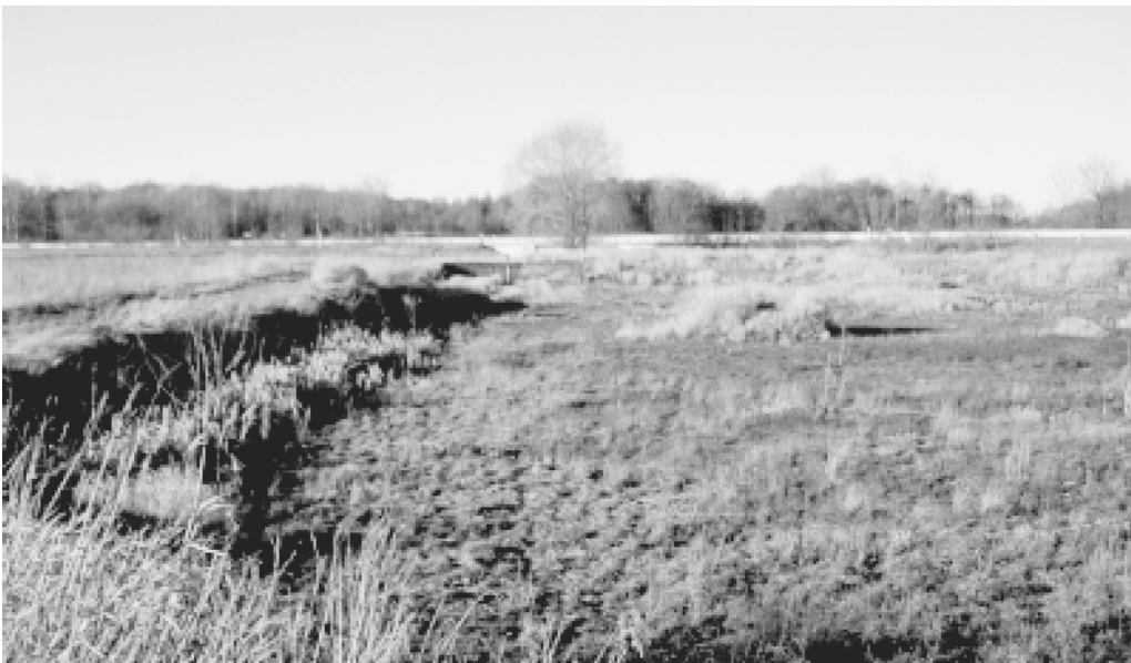
Abb. 2: RWRB Averdiekstraße.