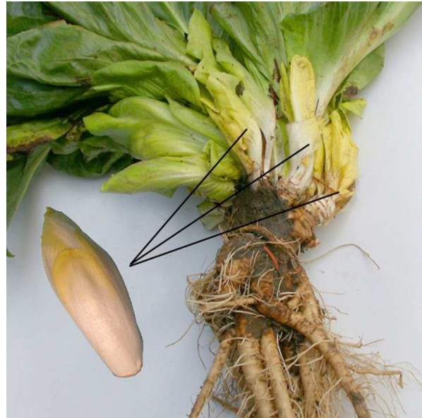
Abb. 4: Wurzeln und junge Triebe (Chicoree) der Blatt-Zichorie ( Cichorium intybus var. foliosum ) (Foto: A. HÖGGEMEIER).