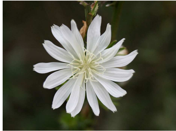
Abb. 2: Weiß blühendes Exemplar (Albino) 2008 bei Magdeburg.

Im Juli beginnt die Wegwarte mit vielen Körbchenblüten zu blühen. Die Blüten haben – anders als z. B. die Sonnenblumen – nur Zungenblüten. Sie öffnen sich nur an hellen Tagen oder bei Sonne. Gegen 15 Uhr schließen sich dann die Körbchen wieder.