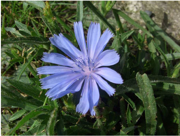
Abb. 1: Blütenköpfchen der Gewöhnlichen Wegwarte ( Cichorium intybus ), 2008 im Westpark Bochum.

Die Wegwarte gehört zu der Pflanzenfamilie der Korbblütler (Compositen). Sie kann bis 120 cm hoch werden. Der Stängel ist recht verzweigt. Die dunkelgrünen, etwas rauhaarigen Blätter sind am Grund etwas fiederspaltig, die mittleren und oberstehenden Blätter sind aber fast ganzrandig.