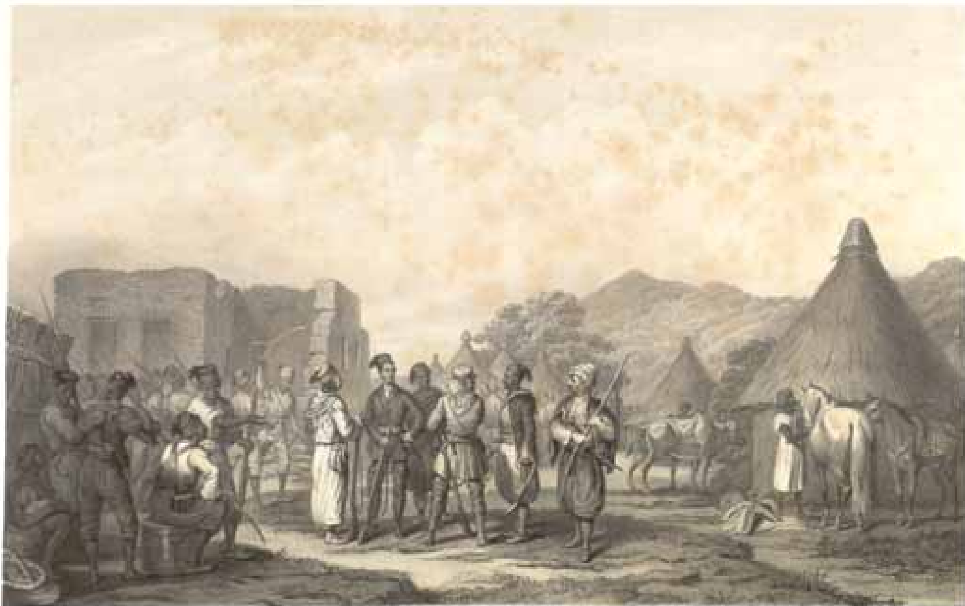
Yamalo, (Kamchatka) 1811-1812