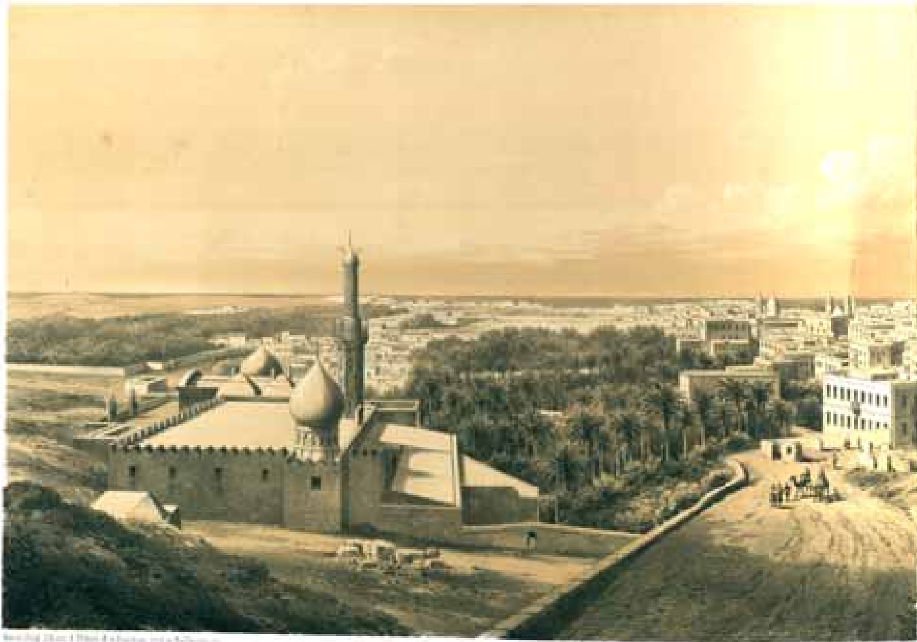
Alexandria, Egypt, from the Citadel, 1860s.