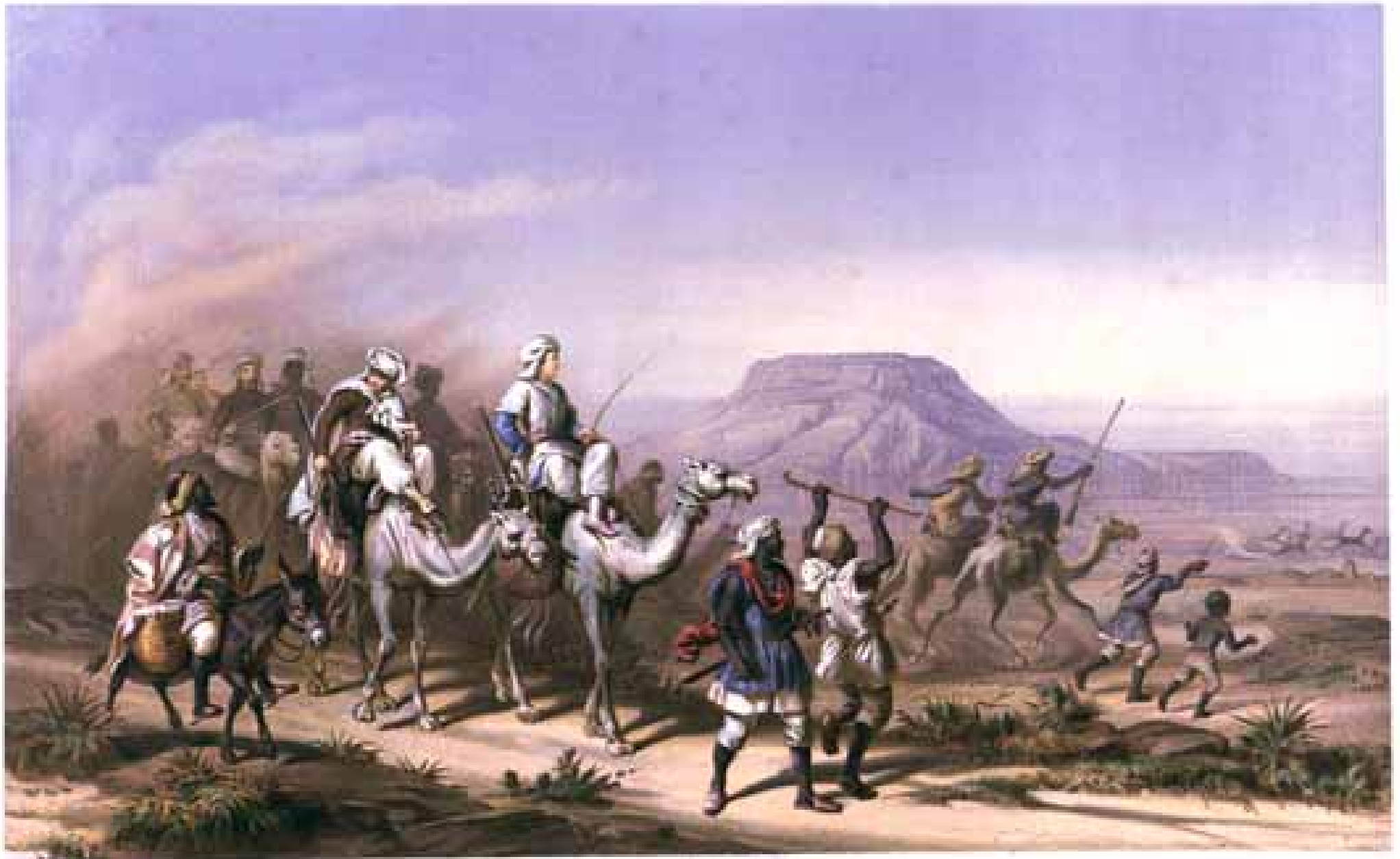
Karawane des Freiherrn Adalbert von Barmia in der Wüste des Bats-el-Dagur (Sudan)