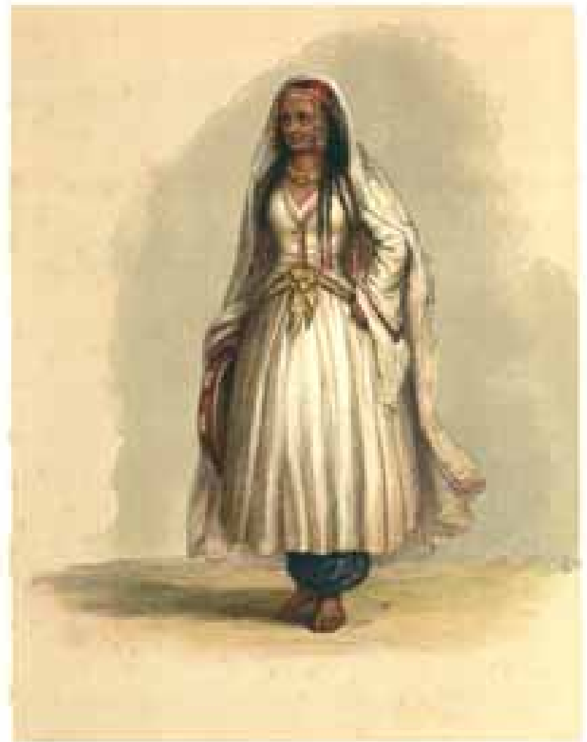
1874, No. 12, 13 1874, No. 14, 15