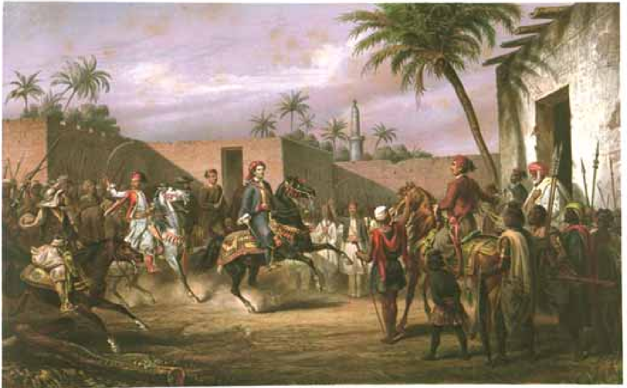
Urdu [El-Oudh] - Hen Dangalah