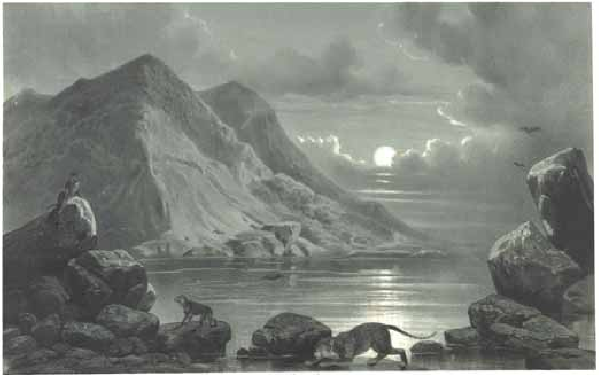
Teich bei Hellet-Järis.