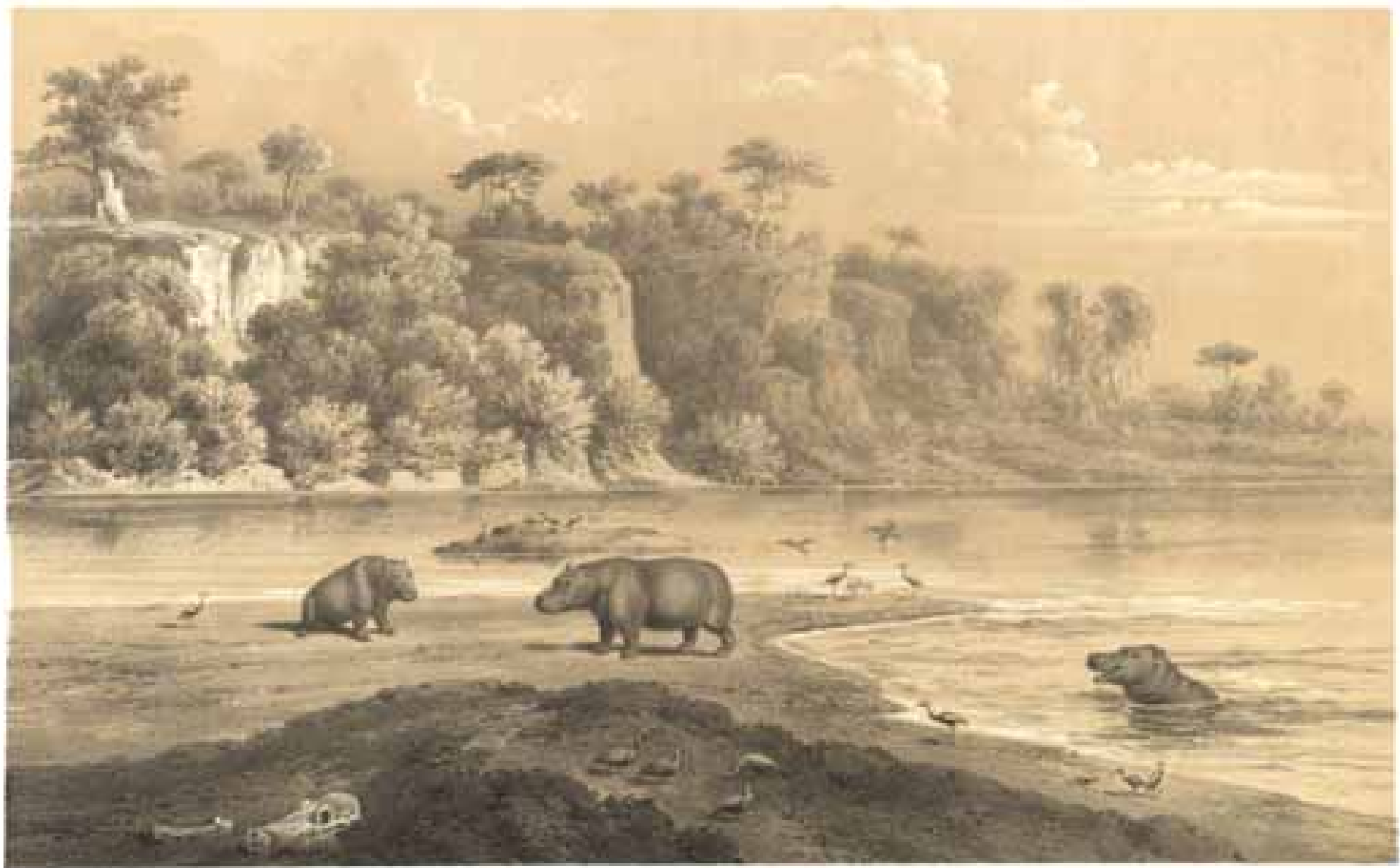
Der blaue Fluss umseit Bodja. 1884. No. 100.