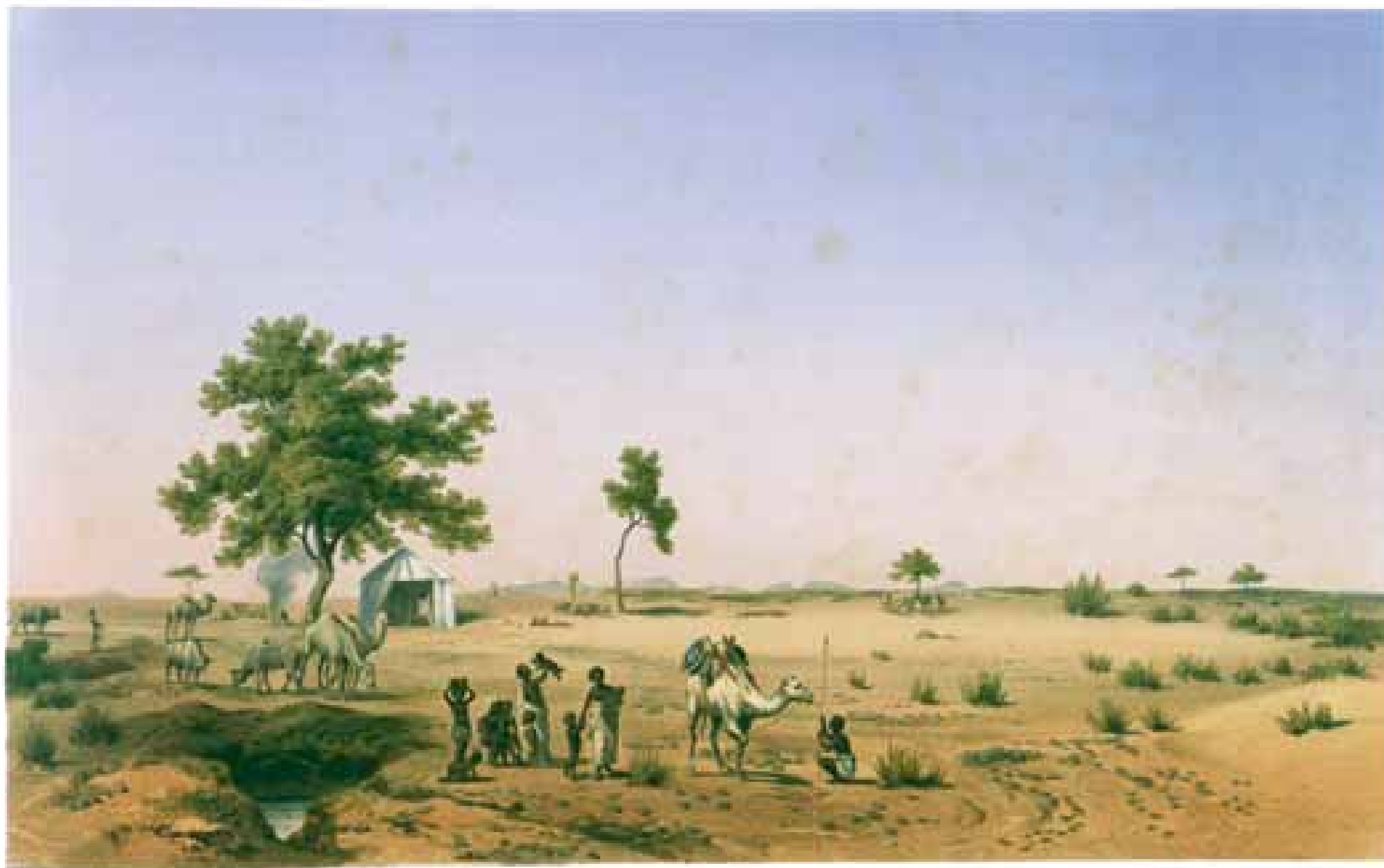
Ein si-Bogalig, neantuch aLlita stover