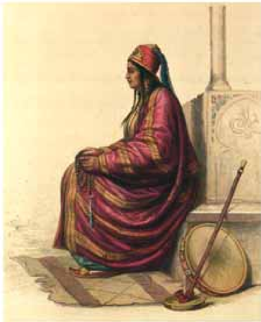
1874, No. 10, 11