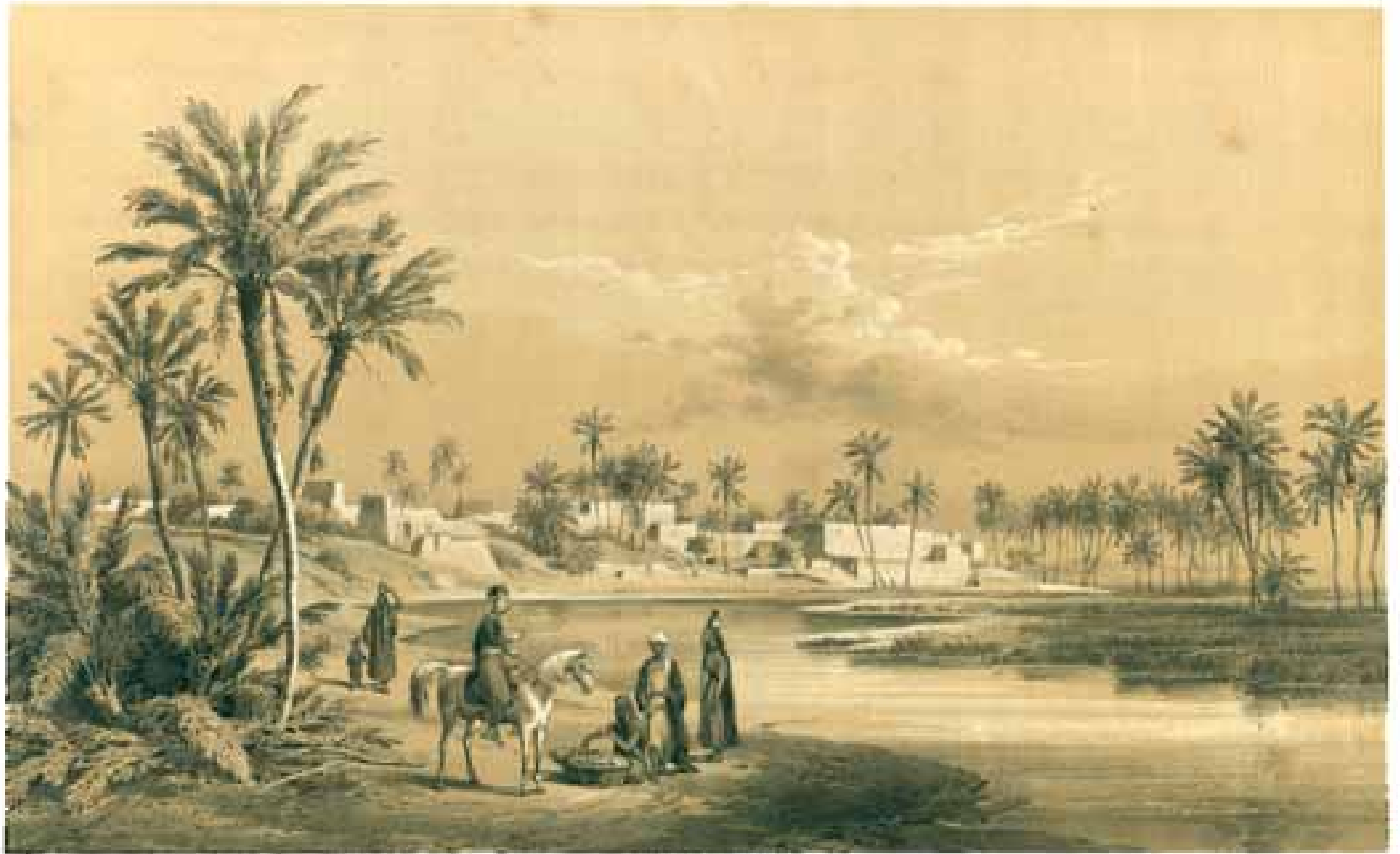
W. & A. G. & Co. N.Y.