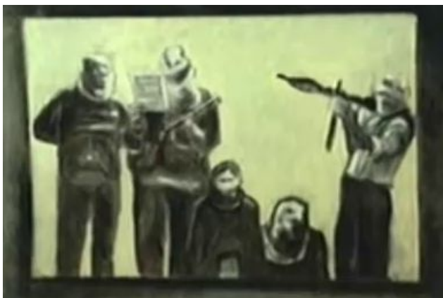
Exit (2008, Ausschnittsvergrößerung)

In Neulich 4 , aber dann auch vor allem in Exit wandeln die Protagonisten in einer düsteren Welt des Terrorismus umher. Gleich zu Beginn von Neulich 4 wird von einem Gasanschlag gesprochen, in Exit sehen wir einen Selbstmordattentäter, und dann immer wieder diese moderne Ikone des Soldaten mit Maschinengewehr, die durch die Medien hindurchflimmert.