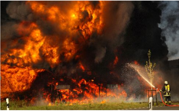
Auf verlorenem Posten. Ein Feuerwehrmann bei einem Brand, fotografiert von Günther Jockel.

top dabei hat. Da ist die Arbeit für den Fotografen ruhiger und auch für die Redaktion. Aber früher sind andere Bilder gemacht worden. Der Anspruch nach Photoreportagen zum Beispiel ist stark angestiegen. Die sind früher auch gemacht worden, aber nicht in dieser Art wie heute.