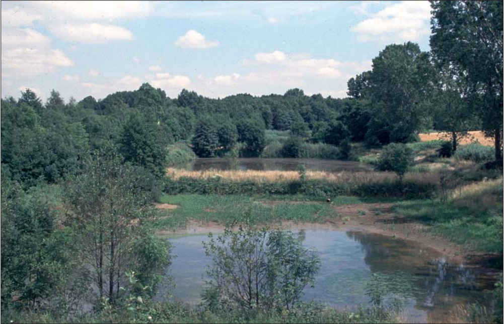
Abb. 1: Blick aus westlicher Richtung auf die Kleinen Heideteiche im NSG „Heideteiche bei Osterfeld“.