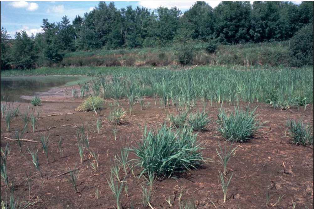
Abb. 2: Unbespannter Fischteich – die so entstehenden Schlammflächen bieten zahlreichen Pflanzenarten idealen Lebensraum. Aufn.: A. LÖB.