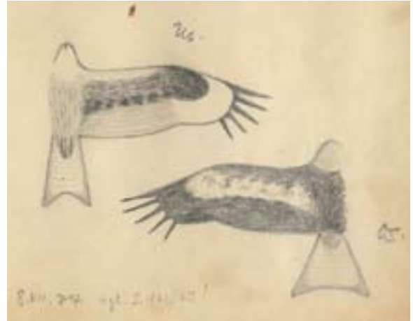
Abb. 3: Flügel und Schwanz des Schwarzmilans ( Milvus migrans ). Aus dem Tagebuch Band 9, 1934. - Wings and tail of the Black Kite. From diary vol. 9, 1934.

Berlin: 14.6.1933 Gesang eines Birkenzeisigs. Leipzig, Hamburg, 28.8.-24.9.: Helgoland, Bremen. Frisches Haff, Rossitten. 1934: Berlin, Leipzig. 10.5. Exkursion mit E. Stresemann. Pfingsten 1934 Unterspreewald. 3.6. Exkursion mit O. Steinfatt. August: Travemünde, Fehmarn.