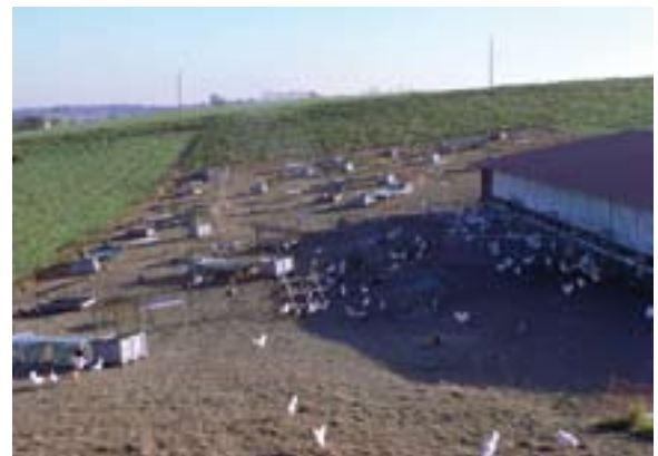
Abb. 2: Freiland-Geflügelhaltung mit Hühnern bei Nr. 1 in Abb. 1 - Outdoor poultry holding with chicken at No. 1 in fig. 1.

Die Untersuchung fand im Rahmen einer Diplomarbeit unter Betreuung der FH für Forstwirtschaft Rottenburg und der Vogelwarte Radolfzell statt. Wir danken Prof. Rainer Luick für die freundliche Unterstützung. Dr. Iris Brunhart und dem Schweizer Bundesamt für Veterinärwesen (BVET) gebührt unser Dank für die unkomplizierte Überlassung der erforderlichen Informationen zu den Geflügelhaltungen und den Geflügelhaltern für ihre freundliche Kooperationsbereitschaft.