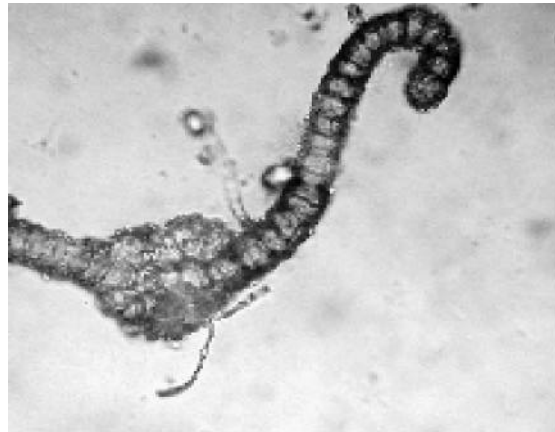
2b. Tortula brevissima , Rippenquerschnitt