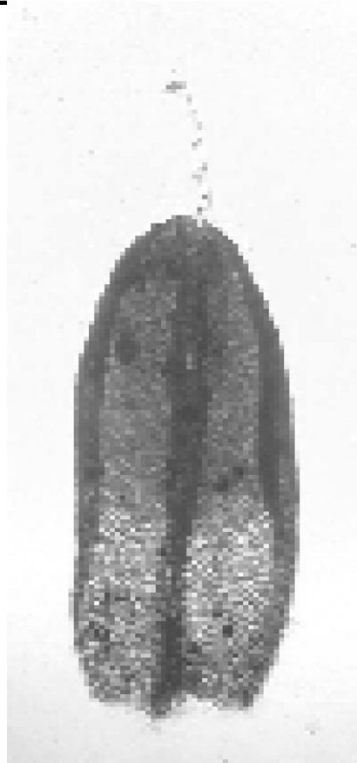
2a. Tortula brevissima , Blatt