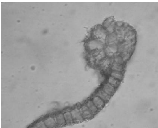
1b. Tortula canescens , Rippenquerschnitt