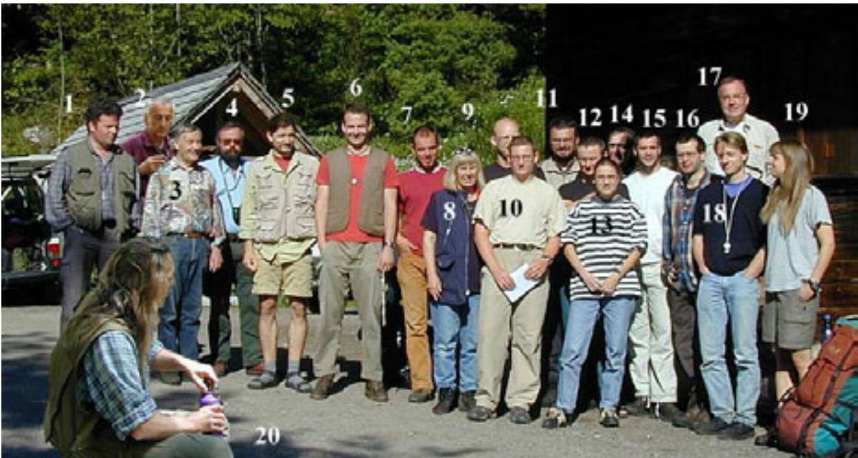
Teilnehmer der Schwarzwald-Exkursion: