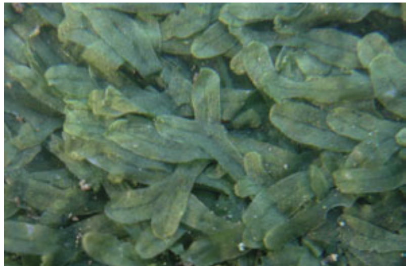
Metzgeria furcata mit einer Leuchtlupe im Gelände fotografiert.

die Fa. Peak auch - wie schon im Bryonet bekannt gemacht - mit Vergrößerungen von 10x und 15x. Mit einer Digitalkamera kann man einfach durch die Lupen hindurch fotografieren (vgl. Abbildung). Klebt man sich ein Filtergewinde in die Lupe, kann sie sogar fest mit der Kamera verbunden werden.