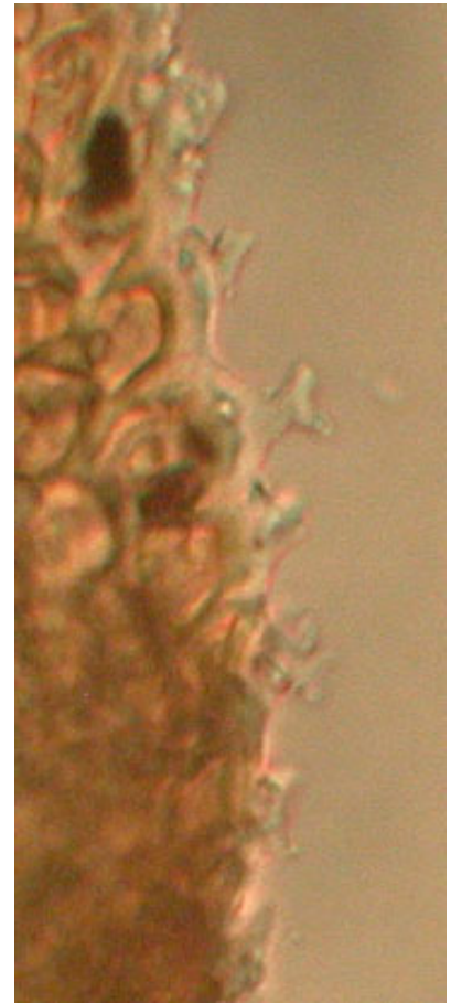
Abb. 2: Gabelpapille am Blattrand von T. subpapillosissima .