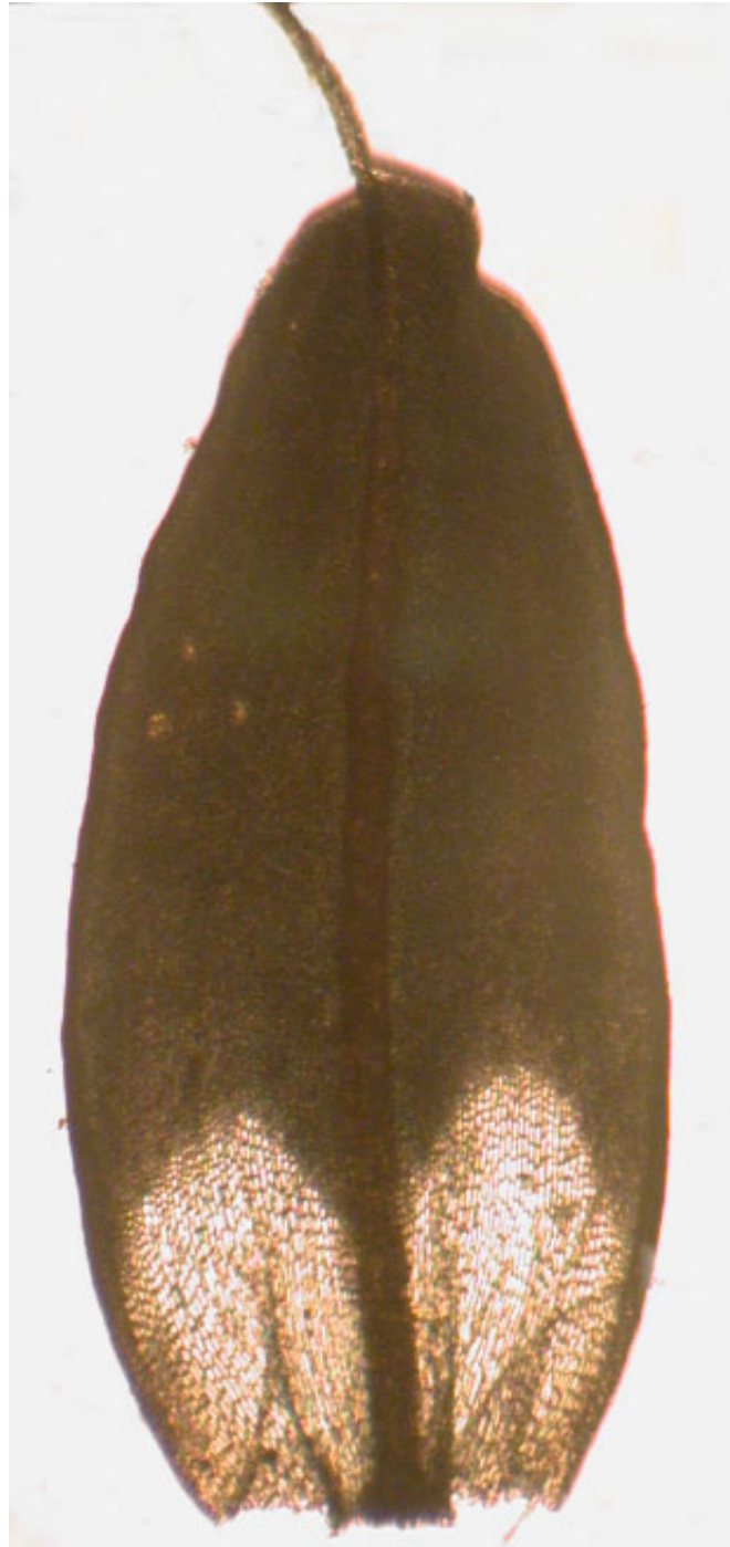
Abb. 1: Blatt vom Holotypus der Tortula papillosissima var. submamillosa aus dem Botanischen Museum Helsinki.

(2) Ein Blattschnitt mit einer verschmälert zulaufenden Spitze (das macht auch T. ruraliformis ). Zum Teil aus einer breit eiförmigen Basis kontrahiert und dann schräg zulaufend, jedoch an der Spitze zumeist abgerundet. In diesen