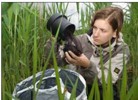
Abb. 2: Probenahme auf einer Wiesenfläche.