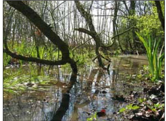
Abb. 1: Tümpel im Wald.

Um diese Fragen beantworten zu können, wurde 2007 im Rahmen komplexer Untersuchungen