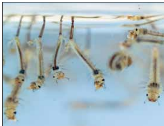
Abb. 4: Mückenlarven Culex pipiens .

Nahrungskonkurrenten ausgerichtet. Es wurden alle vorhandenen Culiciden erfasst und die Arten bestimmt. Als Nahrungskonkurrenten wurden alle filtrierenden Kleinkrebse (Crustacean) angesehen, die dasselbe Nahrungsspektrum wie die Mückenlarven beanspruchen. Die untersuchten Kleinkrebse wurden in die Klassen Daphniidae (mit den Unterordnungen Daphnia, Ceriodaphnia, Simocephalus und Scapheloberis), Chydoridae, Ostracoda und Copepoda (mit den Unterordnungen Harpacticida und Calanoida) unterteilt. Für die statistische Analyse wurde der nicht-parametrische Kruskal-Wallis-Test angewandt.