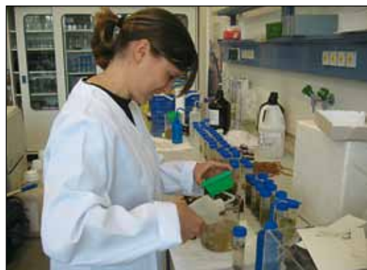
Abb. 3: Probenaufbereitung im Labor.

ten eine Ausdehnung von 20 bis 800 m 2 und eine Wassertiefe von 3 bis 30 cm. Durch die höhere Verdunstung im Sommer trockneten die Wasserflächen schneller aus als im Frühjahr. So hielt die Wasserbedeckung der Probenflächen im Frühjahr 6,5 Wochen (Wald) bzw. 5,3 Wochen (Offenland), im Sommer hingegen nur 4,6 Wochen (Wald) bzw. 3,7 Wochen (Offenland) an. Das die Gewässer umgebende Grünland wurde im Sommer zwei Mal gemäht, während die Waldbiotope keiner Pflege unterlagen.