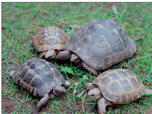
Abb. 2: Landschildkröten.