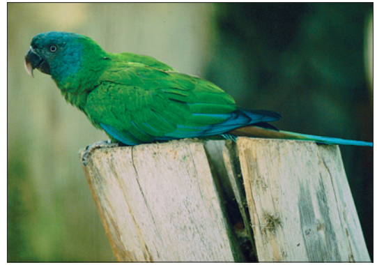
Abb. 5: Gebirgsara.

se Daten im Rahmen der Berichtspflichten zur Umsetzung des Washingtoner Artenschutzübereinkommens für das Bundesministerium für Umwelt zusammengestellt worden sind, bleiben Verfahren bezüglich der national geschützten Arten, wie für heimische Singvögel und Frühlings-Knotenblume, unberücksichtigt.