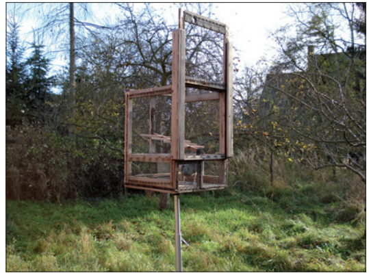
Abb. 3: Ein fängisch gestellter Greifvogelfang („Habichtskorb“) mit einer Taube als Lockvogel ist eine Straftat.

Trotz der intensiven Öffentlichkeitsarbeit werden in jedem Jahr einige Zuwiderhandlungen gegen das Artenschutzrecht festgestellt (DORNBUSCH 2006). Die zumeist durch die Prüfung der Tierbestandsmeldungen ermittelten groben Mängel bei der Nachweisführung, insbesondere für Papageien, werden durch Bußgelder geahndet.