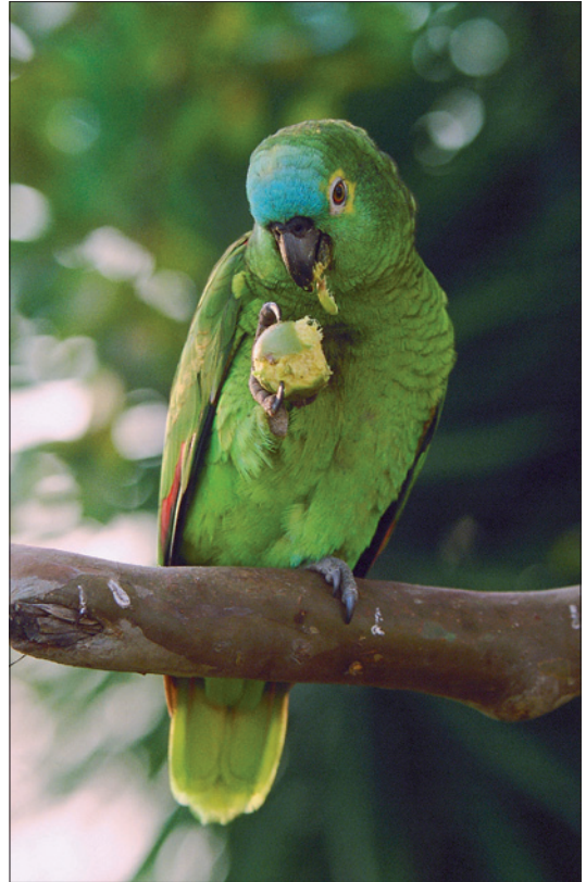
Abb. 1: Blaustirnamazone.

Werden Landschildkröten wiederholt und in größeren Anzahlen nachgezüchtet und verkauft, muss darüber ein Bestandsbuch geführt werden. Diese Buchführungspflicht gilt für Papageien bereits ab dem ersten geschlüpften Jungtier. Beim Verkauf dieser geschützten Tiere sind die vorhandenen Herkunftsnachweise und Dokumente dem neuen Besitzer mitzugeben. Für junge Landschildkröten sind dafür EG-Bescheinigungen erforderlich, die beim CITES-Büro zu beantragen sind. Anträge für EG-Bescheinigungen sowie Muster für den Herkunftsnachweis zur Abgabe von Blaustirnamazonen sind auf der Internetseite des Landesamtes für Umweltschutz Sachsen-Anhalt verfügbar.