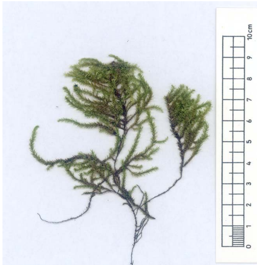
Abb. 1: Scan von „ Oxyrhygium rusciforme var. stagnalis „