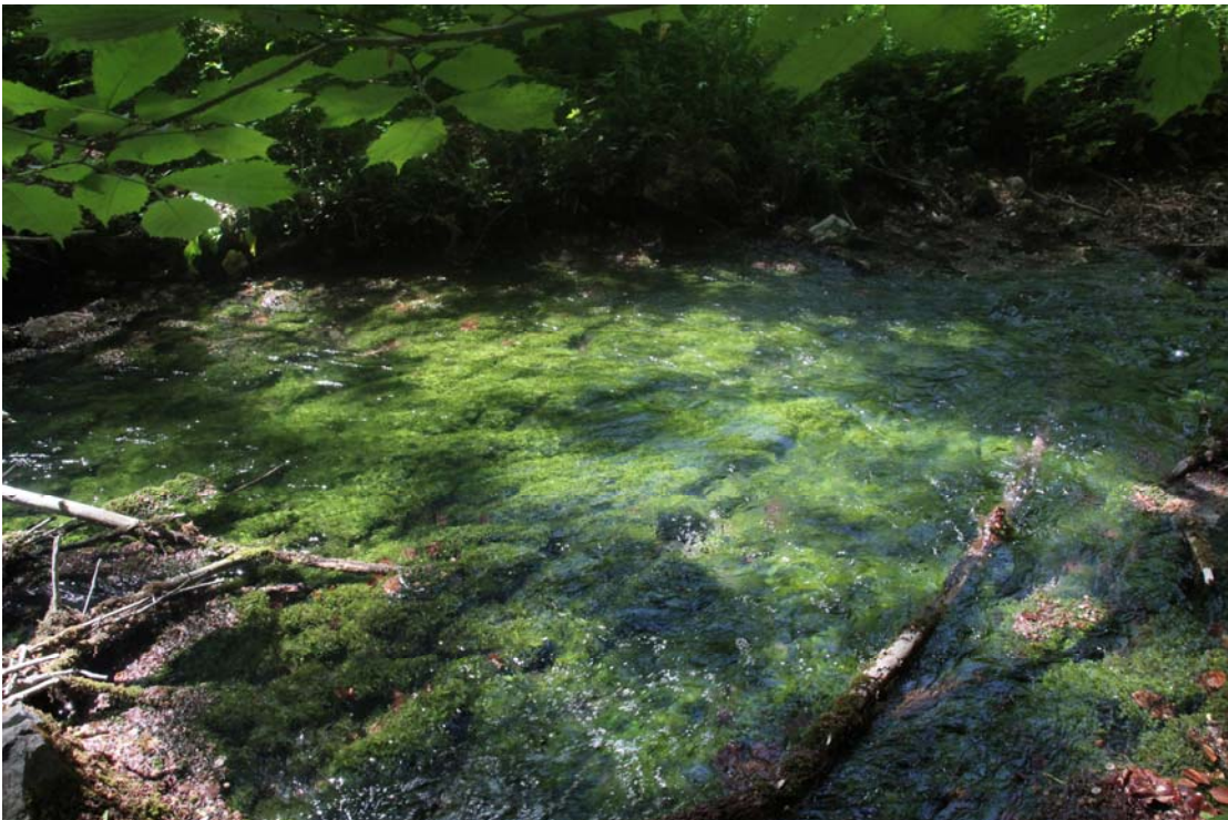
Abb. 4: Massen von Platyhypnidium am Grund der Alme.