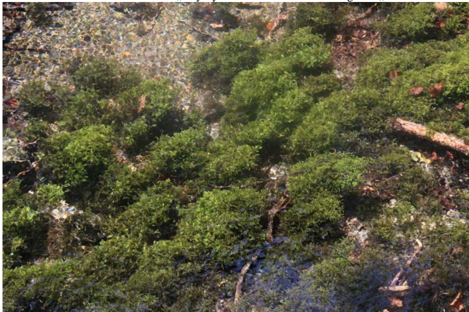
Abb. 2: Standort des Taxons in einem Karst-Quelltopf.