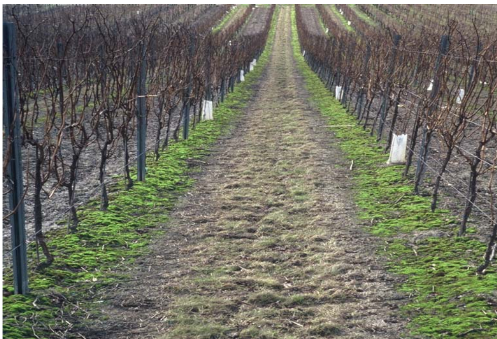
Abb. 1: In einem Weinberg mit regelmäßiger Herbizidanwendung in den Zeilen und unterlassener Bodenbearbeitung siedeln sich schnell Moose an.

Die durch Herbizide hervorgerufenen Schäden sind am einfachsten durch Vergleich mit unbehandelten Kontrollpflanzen zu erkennen. Sie äußern sich je nach Wirkstoff in abweichendem Wuchs, Missbildungen, Unterdrückung der Sporophyten, Nekrosen und unspezifischen Absterbeerscheinungen.. Die genannten Einflüsse wurden seinerzeit aber nicht näher beschrieben. Dieses soll mit den vorliegenden Ausführungen und anhand von Abbildungen exemplarisch nachgeholt werden.