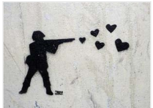
Peace, Graffiti in Bogotá, Colombia

Die Ziele und den Erfolg von Protesten rund um den Globus diskutiert Duncan Green auf seinem Blog From Poverty to Power . Er bezieht sich auf eine Studie der Friedrich-Ebert Stiftung, die wir auch schon in einer unserer Netzschauen verlinkt hatten. Green merkt kritisch an, dass die Studie zu sehr die Sichtbarkeit in den Medien als ihre tatsächlich Größe widerspiegelt. Mit der (Un-)Möglichkeit politische Proteste vorauszusagen , setzt sich der Darth-Throwing Chimp auseinander und stellt entsprechende Statistiken für den Zeitraum von 1956 bis 2012 gegenüber. Eine kritische Anmerkung zu entsprechenden Datensätzen, konkret zu der auch schon im Bretterblog erwähnten „ Global Database of Events, Language and Tone “ (GDELT) findet sich bei Political Violence @ a Glance .