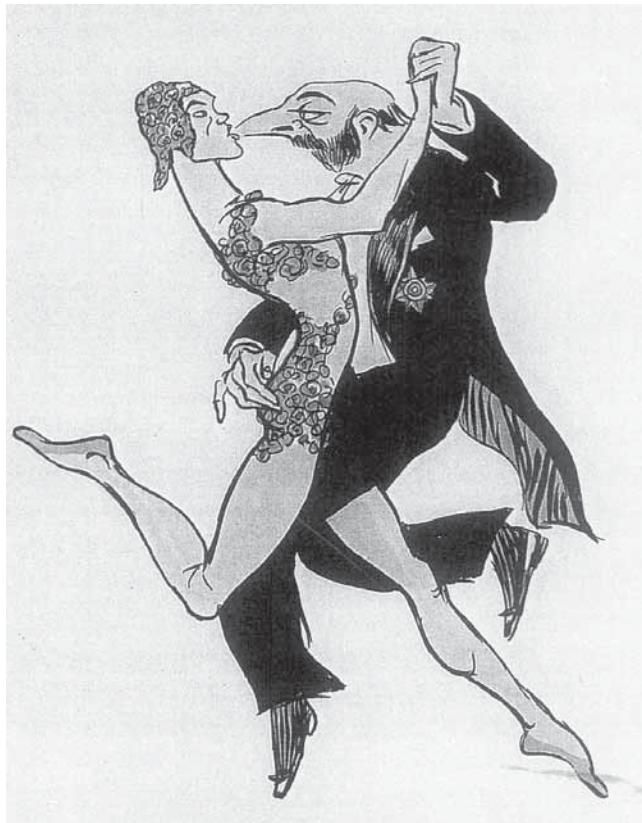
Abb. 4: Sem (Georges Gousat), »Le Massacre du Printemps«, 1913

eine wilde Fahrt durch die nächtliche im Mondschein wie ausgestorbene Stadt, Bakst sein Taschentuch am Spazierstock wie eine Fahne schwenkend, Cocteau und ich hoch oben auf dem Dach des Autos, Nijinski in Frack und hohem Hut still vergnügt in sich hineinlächelnd. Der Morgen dämmerte, als mich die wilde, lustige Gesellschaft an meiner Tour d'Argent absetzte. 35