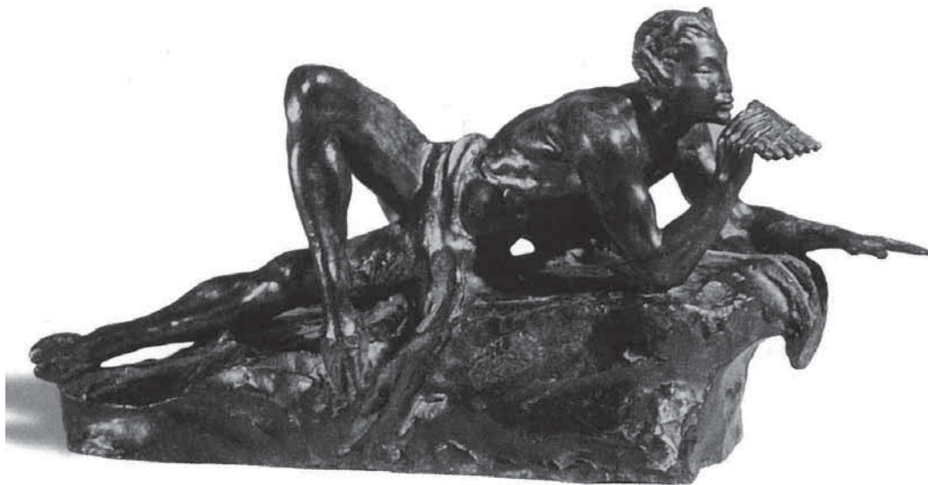
Abb. 6: Malvina Hoffman, Nijinsky als Faun. Bronze, ca. 1912

Der Faun: das Tier, das den Menschen ahnt, das ahnt, was es heisst, Mensch zu sein, ein Tier das vergleicht, das sich und die andren vergleicht, erstes Aufflammen der Reflexion und damit der Tragik und auch der Komik; aber die Tragik überwiegend. Man meint, in allen Bewegungen von Nijinski zu fühlen, dass es ein Tier ist, das sich seiner Nacktheit schämt (Sündenfall). Äusserste Konzentration des Ausdrucks; eine solche Gewalt in der Sparsamkeit der Mittel erreicht nur das Genie. 57