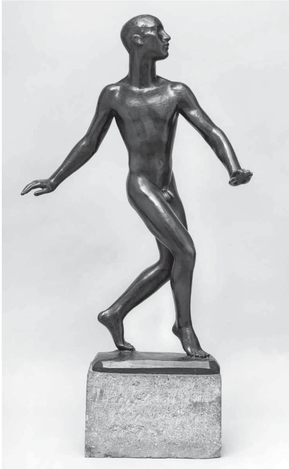
Abb. 1: Georg Kolbe, Tänzer (Nijinsky), 1913/19.