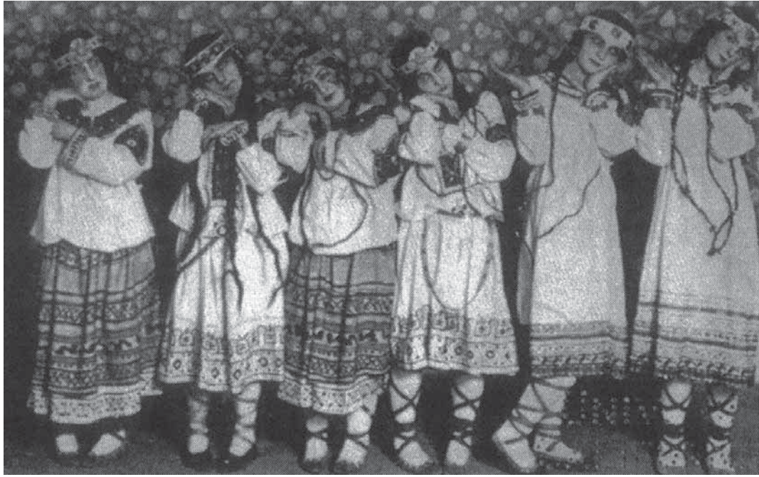
Abb. 5: Fotografie von Charles Gerschel, »Sacre du Printemps«, 1913, aus »Le Théâtre« vom 1. Juli 1913

Die Formation des Raums war durch Nicholas Roerichs Bühnenbild – das einen rituellen Raum für das sagenhafte ›prähistorische‹ slawische Frühlingsopfer darstellte – und durch Nijinskys korrespondierende choreographische Körper-Anordnung strukturiert.