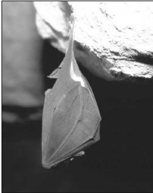
Petit Rhinolophe, Rhinolophus hipposideros

Nous clôturerons la soirée avec la projection de quelques diapositives de chauves-souris.