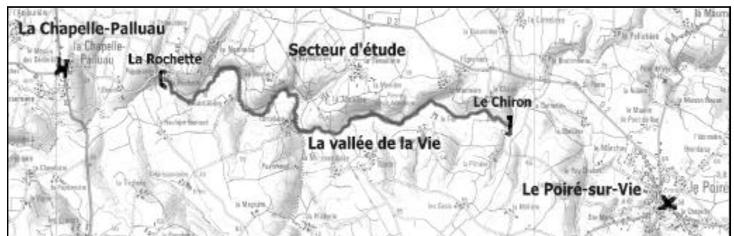
Le secteur d'étude proposé est constitué du cours de la Vie et des terrains bordant la rivière entre les lieux-dits Le Chiron à l'est et La Rochette à l'ouest, soit environ 8 km d'une belle vallée bocagère.